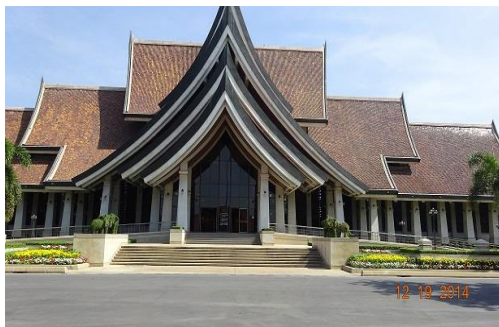
皇家手工藝品展示中心