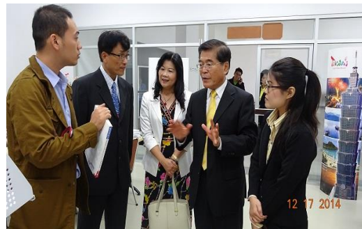
參觀華語文教育中心