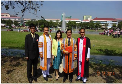
RMUTI 校園風光 1