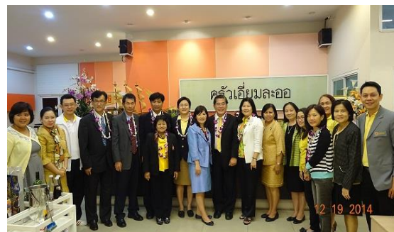
教育部秘書設晚宴接待泰國教育部官員