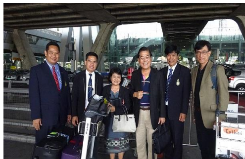
曼谷國際機場接機歡迎