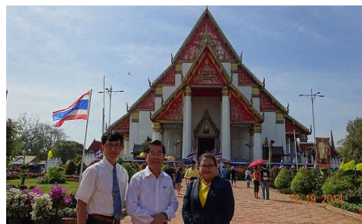
參觀 Ayutthaya 世界文化遺產