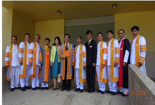
頒贈榮譽博士後之合影