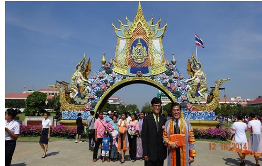
RMUTI 校園風光 2