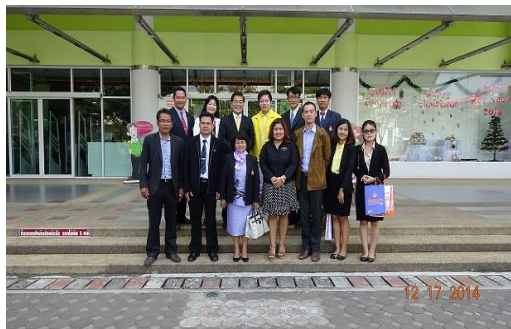
參觀 RMUTI 圖書館