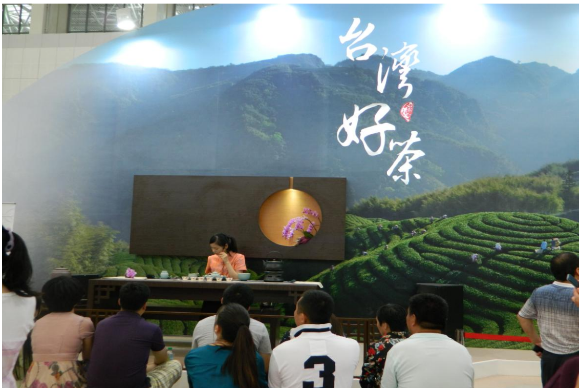
臺灣名品博覽會會場-展場設計 (7/5下午)