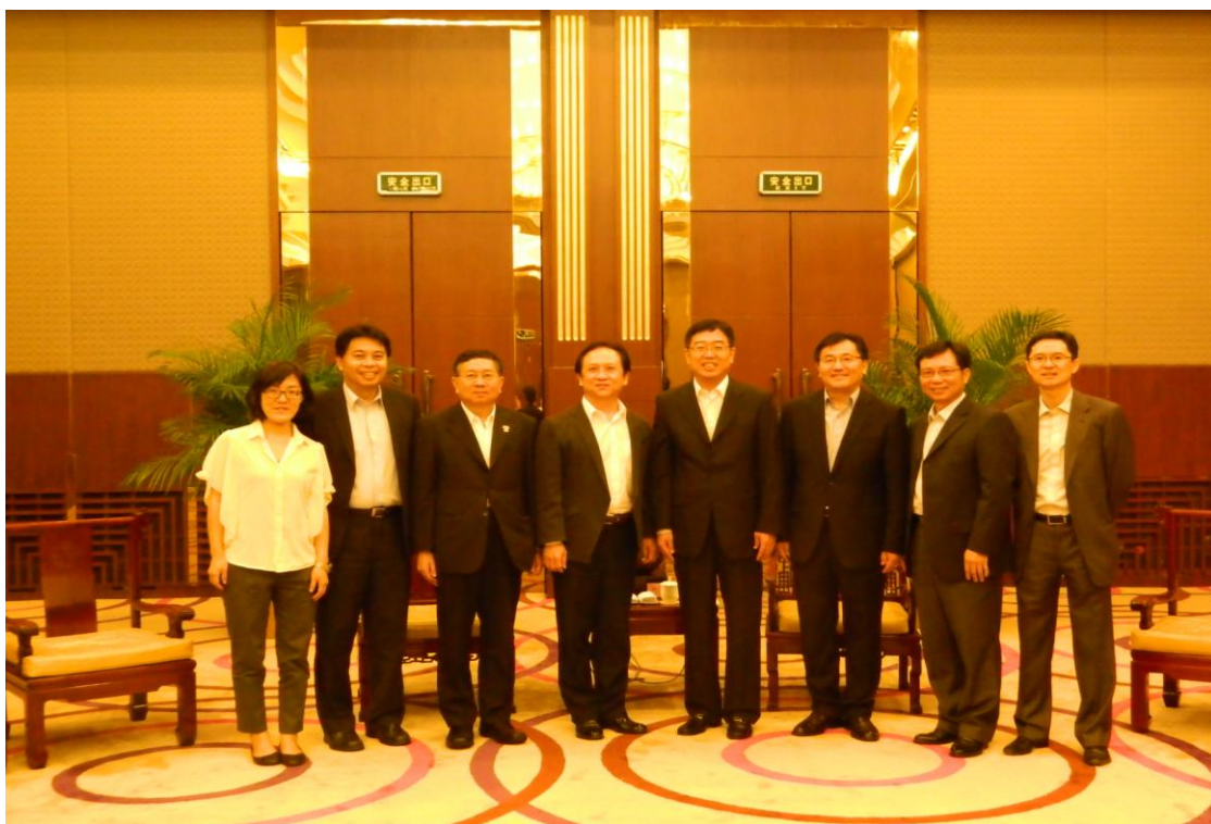
與國家旅遊局成員合影（7/8上午）