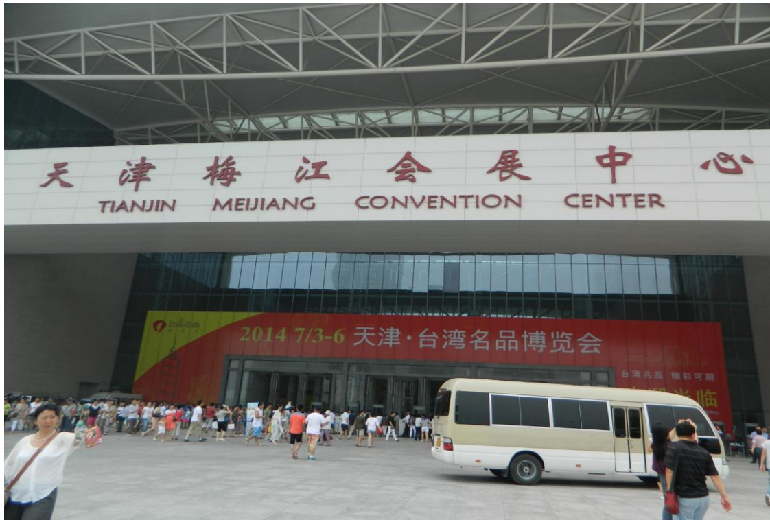
7月5日下午參觀臺灣名品博覽會