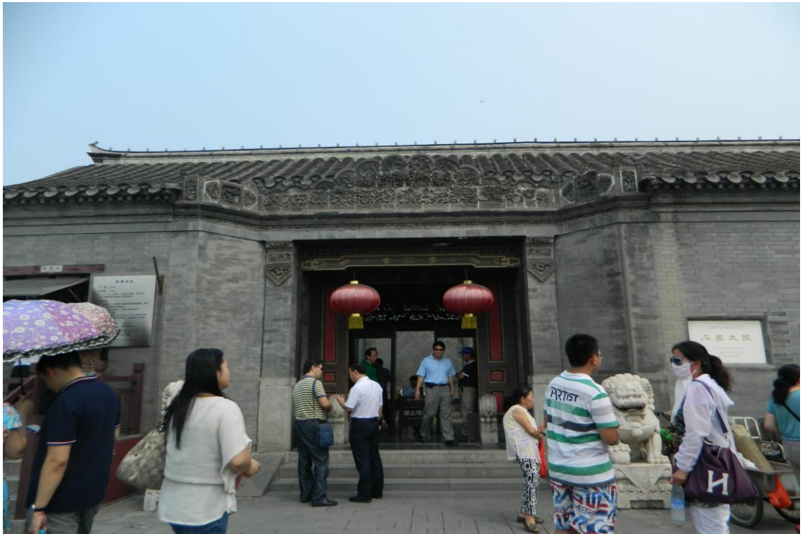
參觀天津石家大院 (7/6下午)