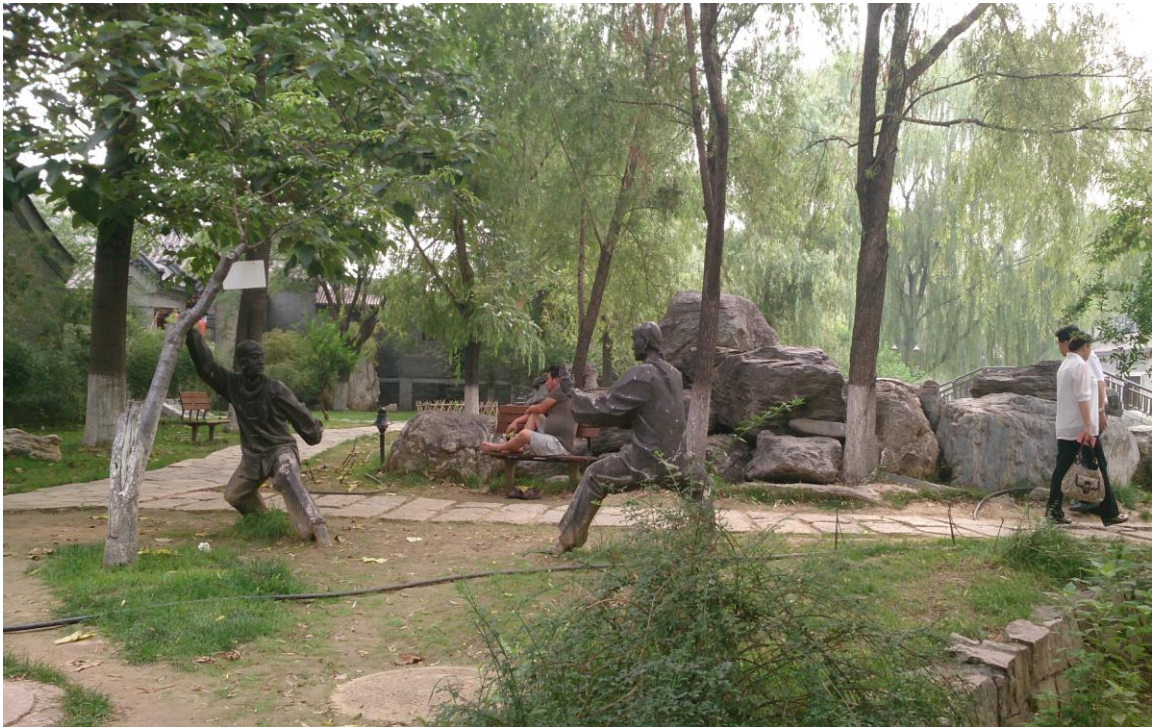
北京市蟹島綠色生態農莊（7/7上午）