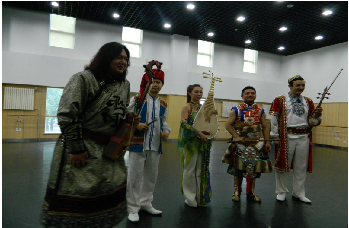
觀賞中央民族歌舞團表演（左起蒙古族、壯族、滿族、藏族、維吾爾族） （7/7下午）