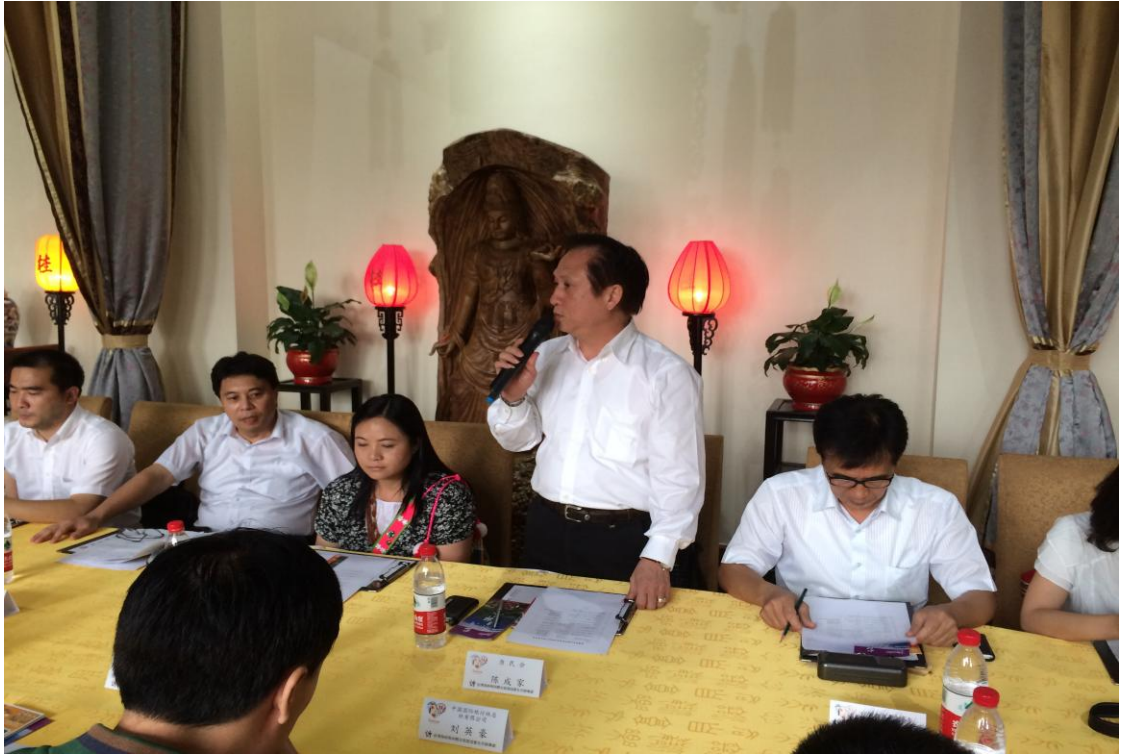
7月4日下午辦理推廣部落深度旅遊推介會