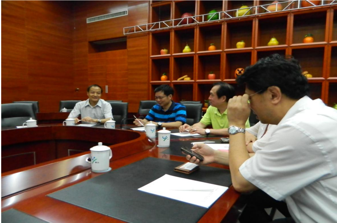
7月7日上午於蟹島綠色生態農莊研商於該基地成立臺灣原住民族產品拓銷據點之可行性