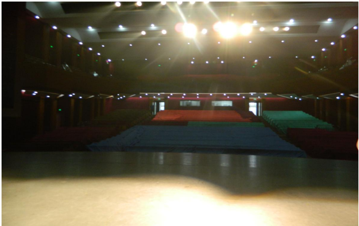
觀賞中央民族歌舞團劇場（7/7下午）