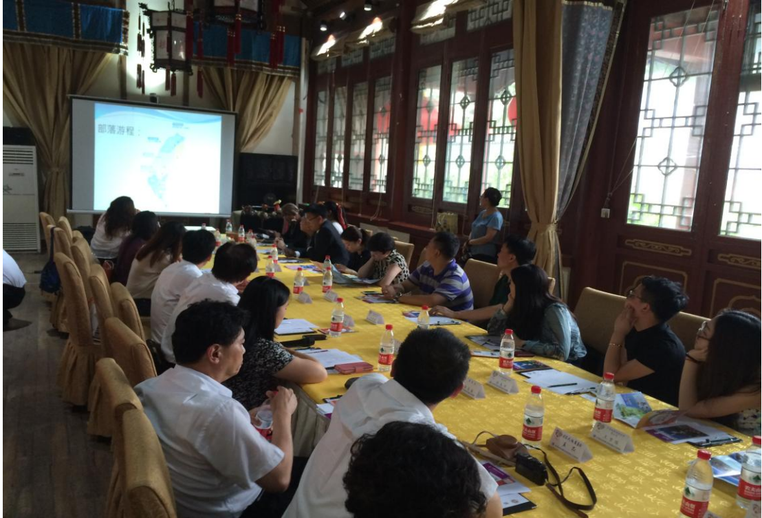
部落深度旅遊推介會參與情形 (7/4下午)