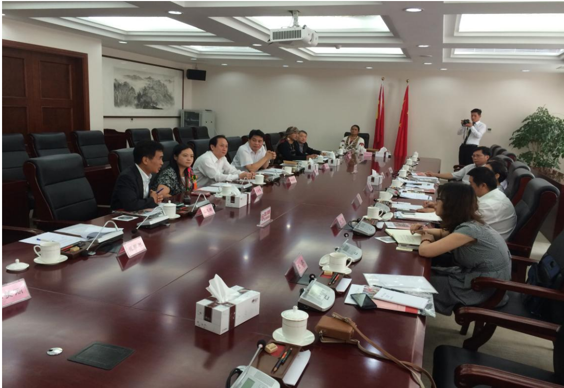
7月4日上午辦理推廣部落深度旅遊工作會議