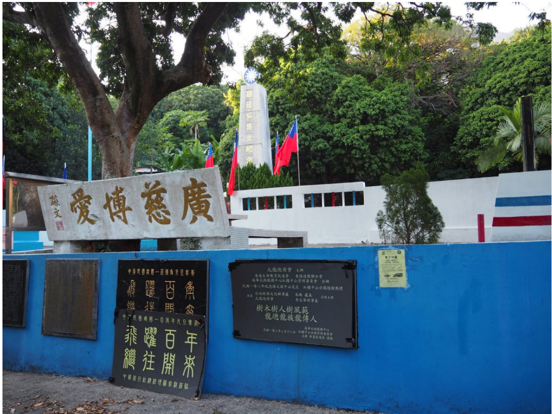
視察屯門中山公園青山紅樓修復情形