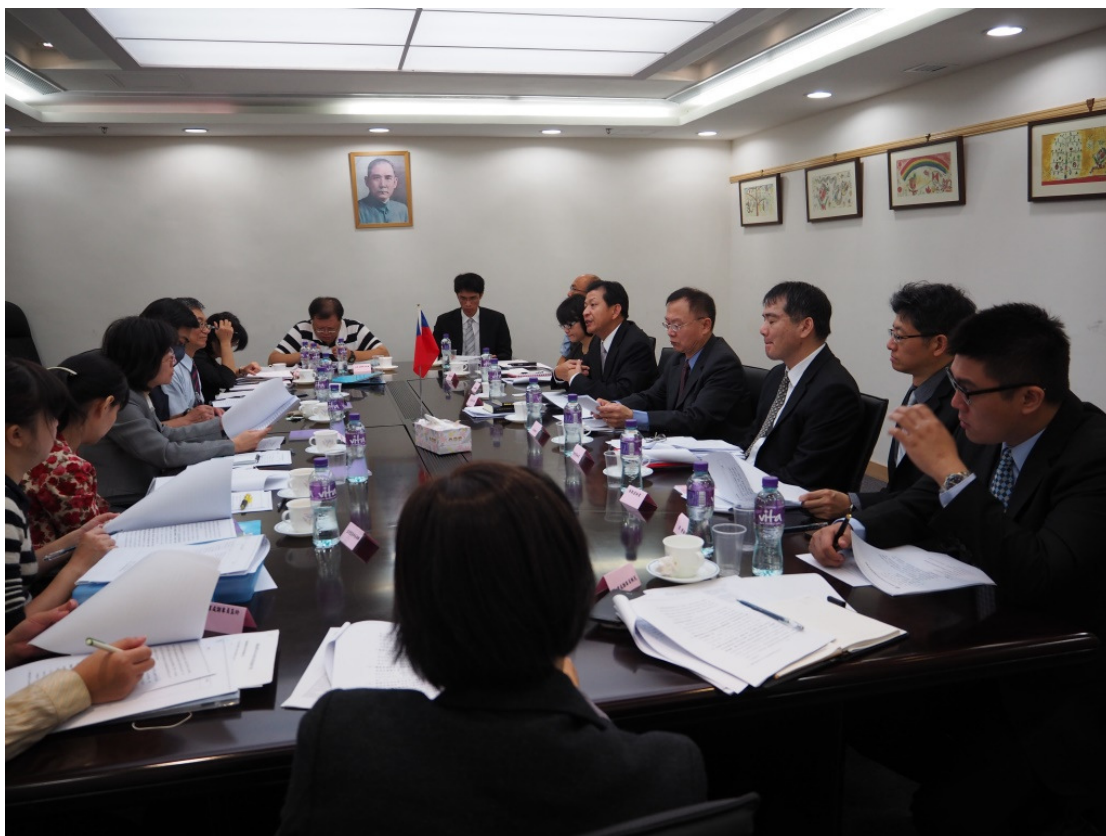
與澳處業務簡報及各組工作會談