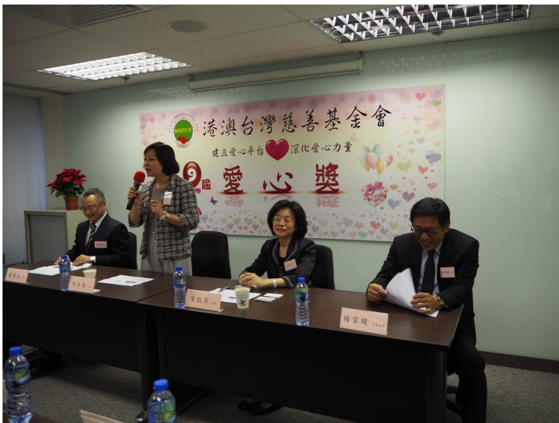
拜會港澳慈善基金會