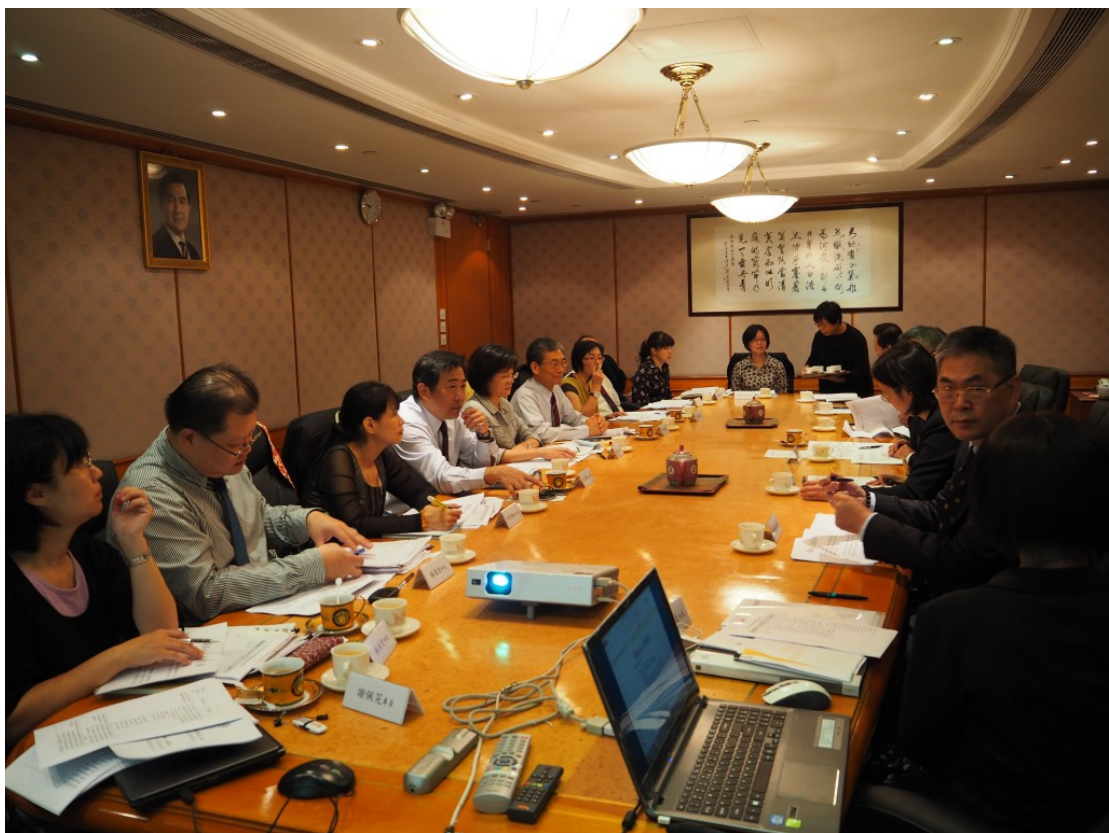
與港局業務簡報及各組工作會談