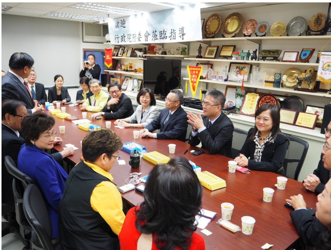
拜會港澳臺灣同鄉會