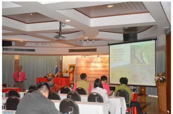
照片 10 詹前主秘專題報告