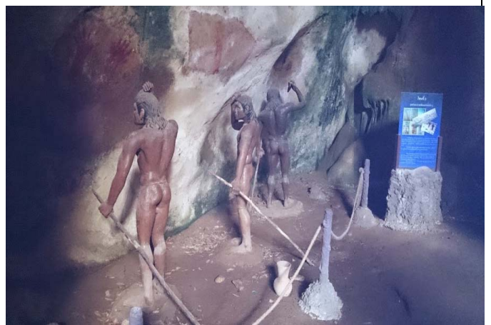
照片 28 地質公園教學與景觀結合