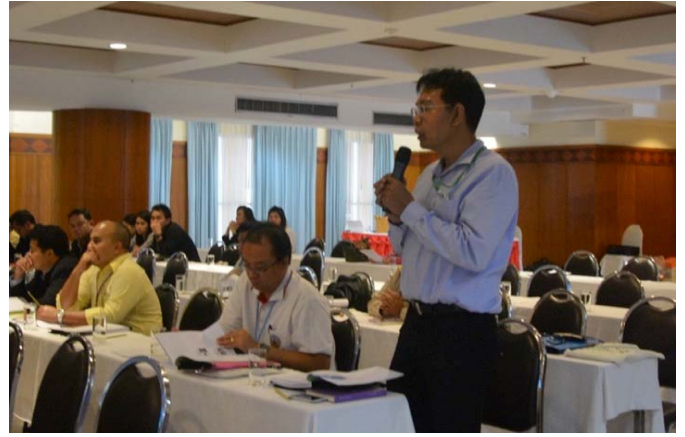
照片 6 研習班學員提問討論