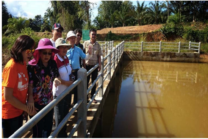
照片 25 KhoPhanom 地區滯洪壩參訪