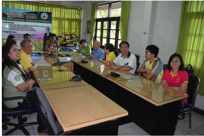
照片 19 由第 11 分局分局長親自主持簡報會議