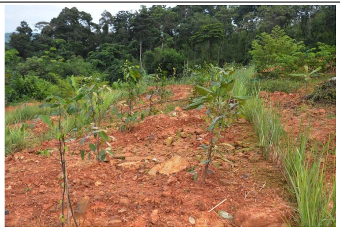
照片 16 邊坡植生以培地茅為大宗，但土壤肥份不足又無配合措施，植生效果不彰