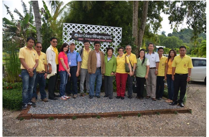
照片 20 臺泰人員於素叻府推廣中心前留影