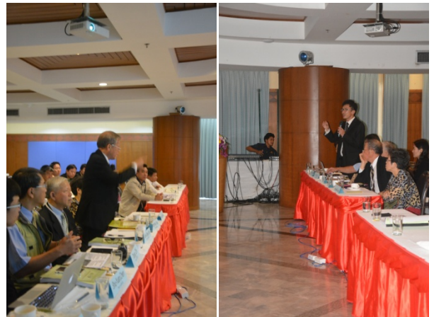
照片 4 段教授及嚴副工程司針對專題提出討論