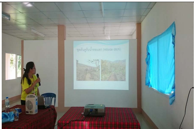
照片 17 小組報告中案例分享