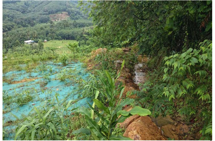
照片 14 排水渠道高於坡面，易生漫地流，且溝面無保護