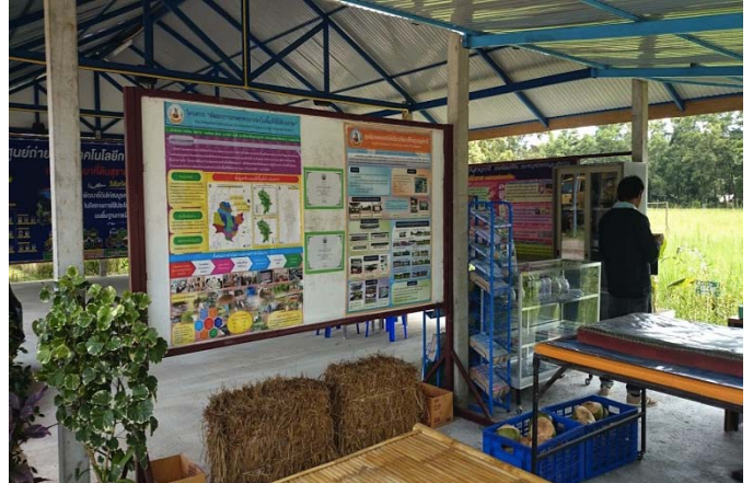
照片 22 推廣中心教室一旁的看板及教學樣品