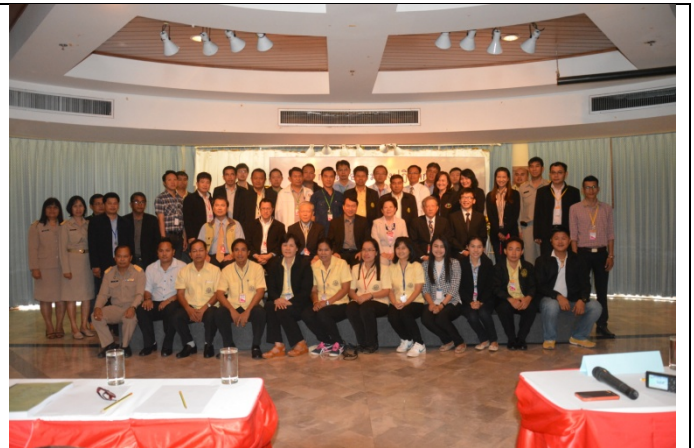
照片 2 與會全體人員合影