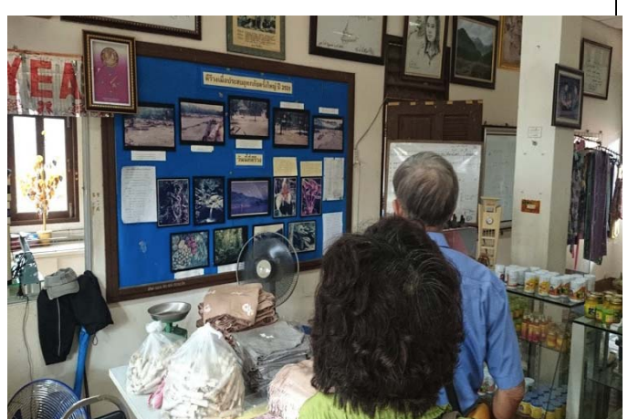
照片 24 災區居民留有災時影像作為防災教材