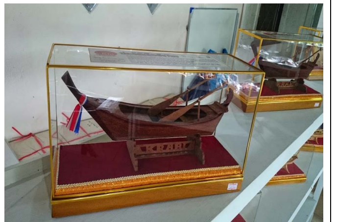
照片 30 Baan KohKlang 社區傳統船隻模型