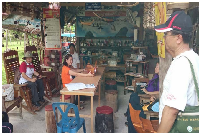
照片 29 居民進行 Baan KohKlang 社區發展簡介