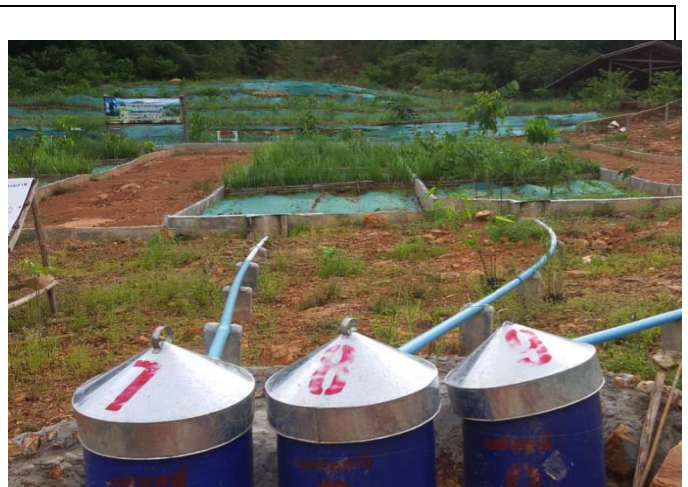
照片 12 試驗區設有集水筒，可蒐集不同區沖蝕量資料