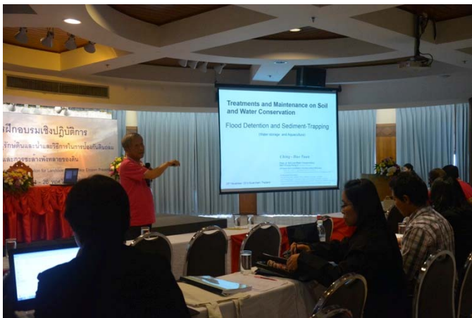
照片 9 段教授專題報告