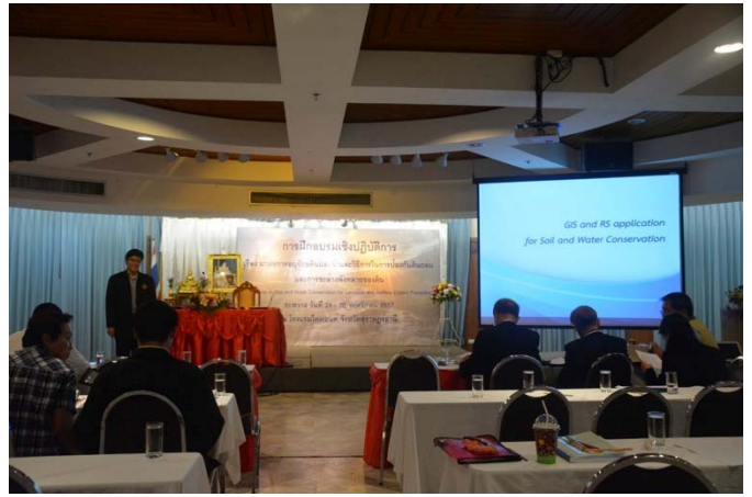
照片 8 LDD Monton 科長專題報告