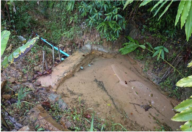
照片 13 簡易節制壩，未清餘且排水管容量明顯不足