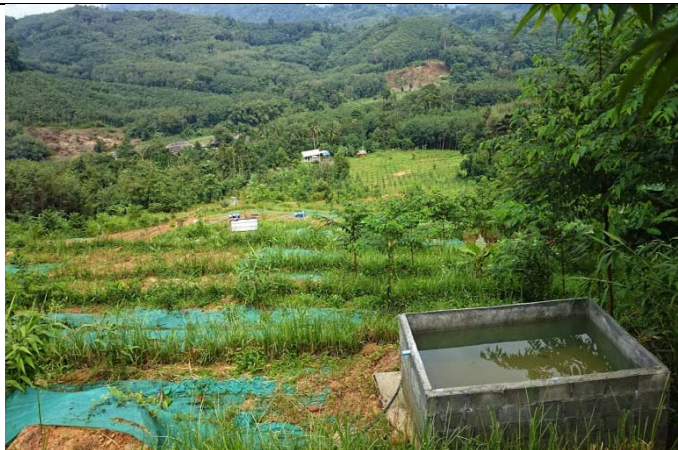
照片 15 崩塌地原則以平臺階段方式整理，但橫向排水不明顯，集水池可作為灌溉水源，無滯洪效果