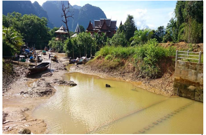
照片 26 滯洪壩下游盡量維持原有景觀