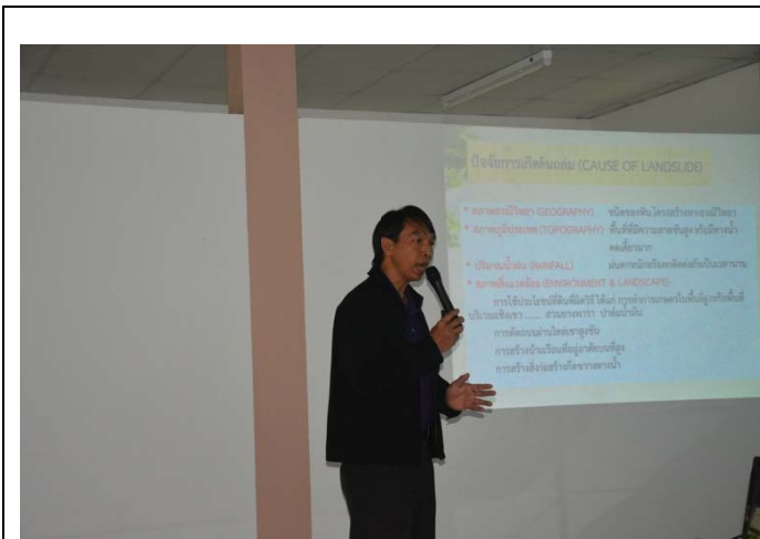
照片 11 泰方人員介紹 Sichon 崩塌地治理始末

在現勘後研習班即利用鄰近的會議室進行小組報告，由 LDD 各分局之地區辦公室同仁分組報告。報告中可以發現臺灣常用的山邊溝、平臺階段、等高耕作、打樁編柵、農塘（滯洪池）、節制壩等方法已在泰國各地區逐漸推行，而這些工法及觀念皆為數年來臺方在交流中提供給泰方應用的。由此可見近年來臺泰技術交流已有初步之成果。於分組報告後，各小組提出問題並討論。同時，臺方 5 位專家也以臺灣經驗，就各個案例中各項工法之施作方式，提出看法及建議，在小組報告結束後研習班也進入了尾聲。活動情形如照片 11~18。