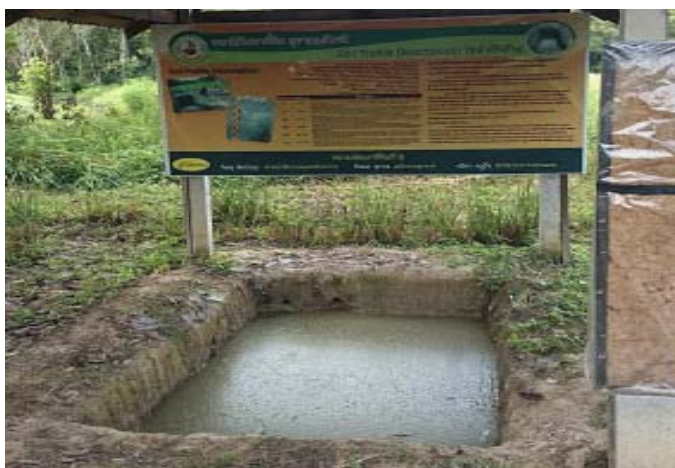
照片 23 推廣教室內的示範農塘