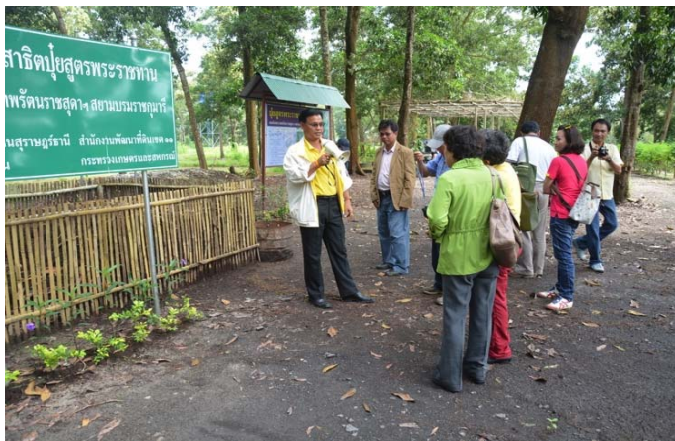
照片 21 素叻府辦公室主任親自介紹教學資源及方法