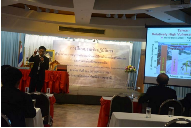
照片 5 嚴副工程司專題報告