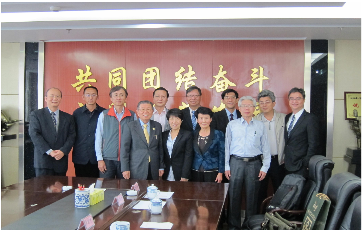
103 年臺灣醫療團團員於衛生和計畫生育委員會合影