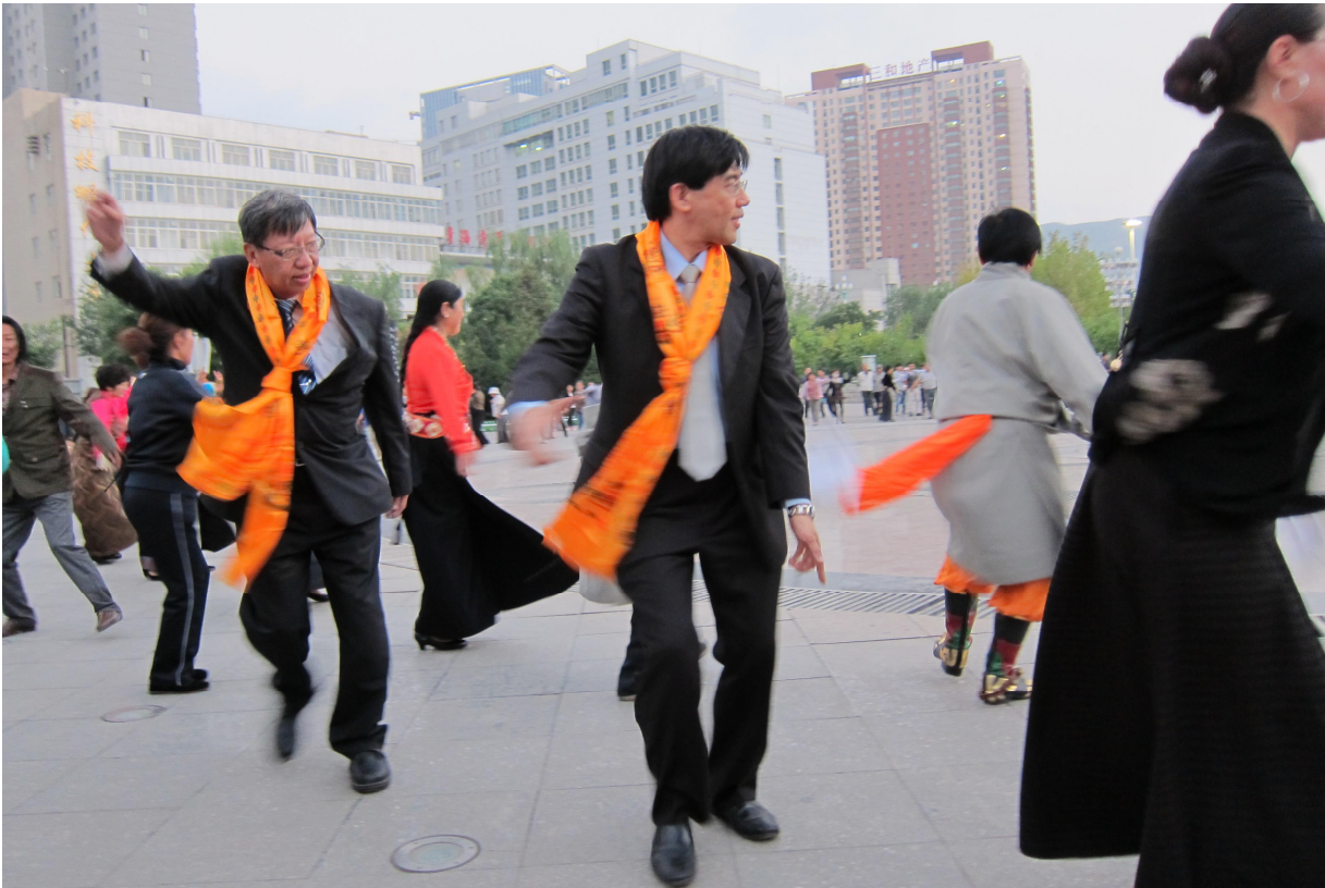
與當地藏人跳鍋莊舞