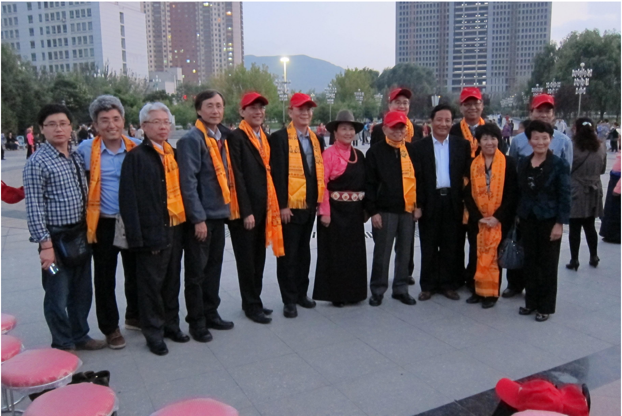
於青海福利慈善醫院廣場合影