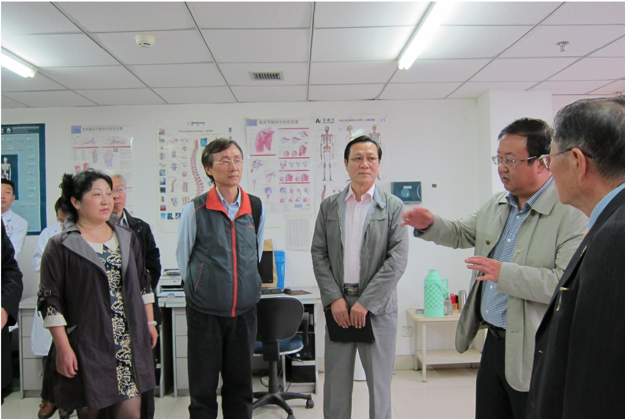
參訪西寧市第一人民醫院