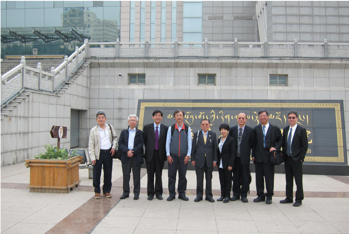
103 年臺灣醫療團團員於藏醫院博物館合影