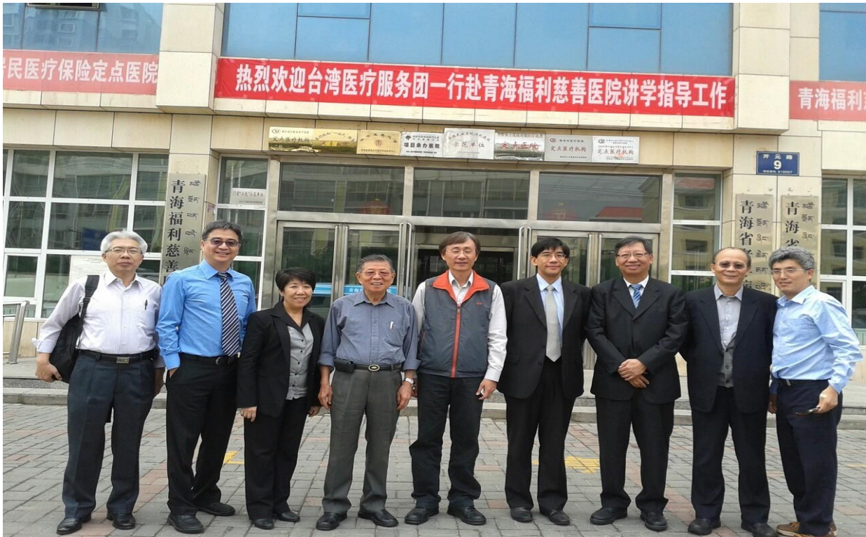
103 年臺灣醫療團團員於青海福利慈善醫院合影