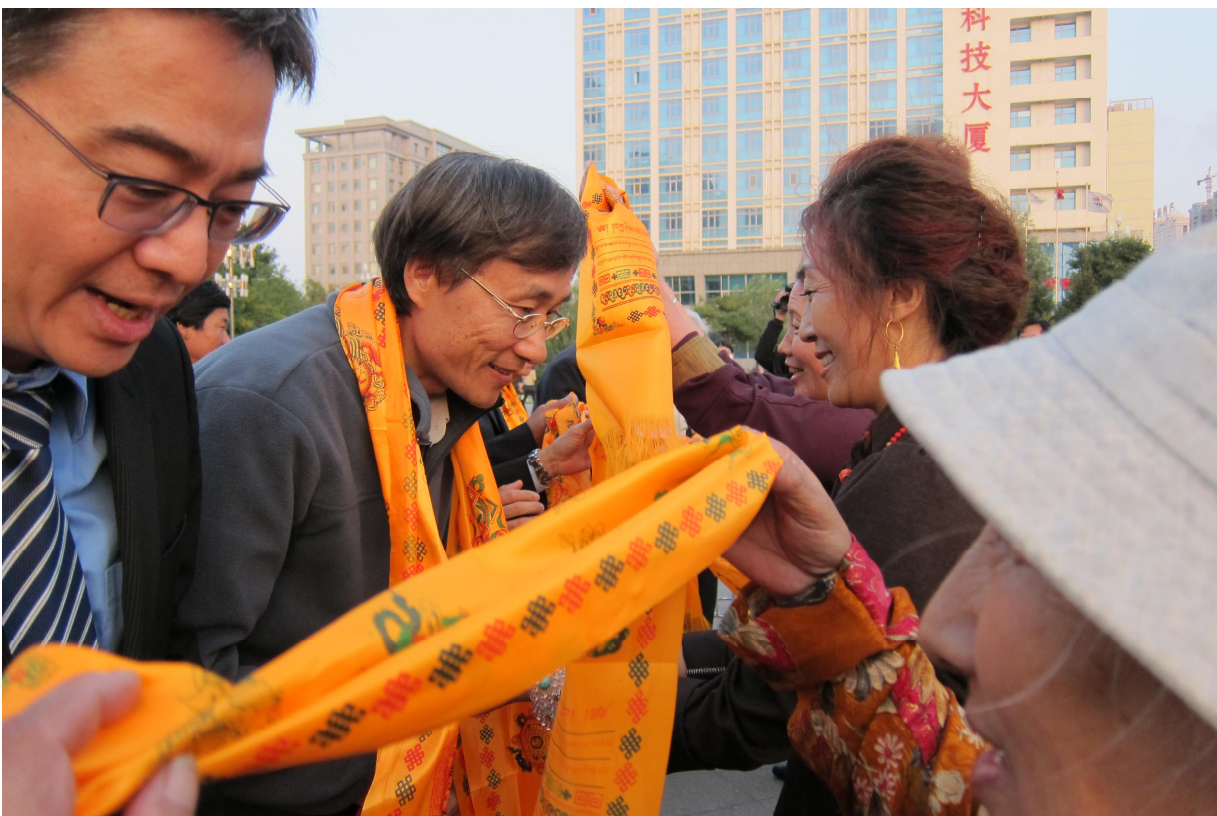
與當地藏人互動並獻哈達給醫療團團員