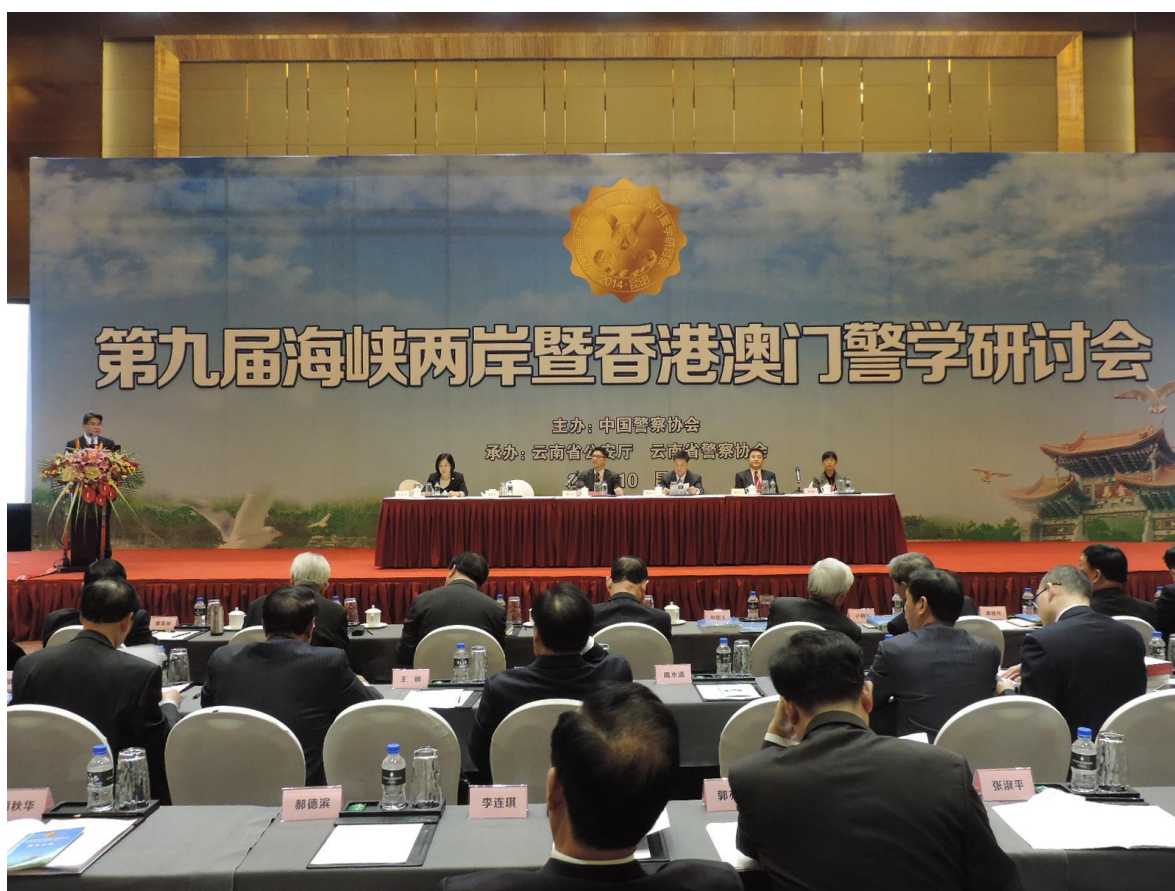
照片 14 第四場論文交流主持人、點評人及發表人

1. 本場主持人：劉保祿(香港警察學院院長)，點評嘉賓：馬振華(警政署刑事警察局警政監)，發表人分別為：汪毓璋(中央警察大學國境警察學系教授)、張躍進(江蘇省蘇州市副市長、公安局局長)、朱蓓蕾(中央警察大學公共安全學系教授)、黃麗娟(大陸地區中國人民武裝警察部隊學院邊防系副教授) 等四位，如照片 14。