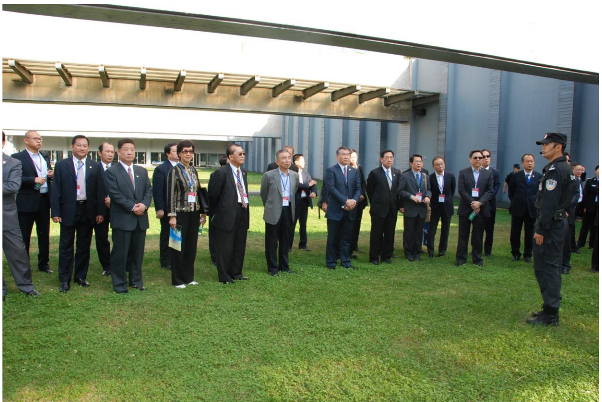
照片 27 昆明市公安局特警訓練基地中心主官為研討會介紹該中心設備及訓練情況