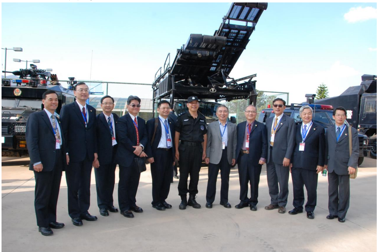
照片 28 本校代表團成員與特警訓練基地中心主官合影