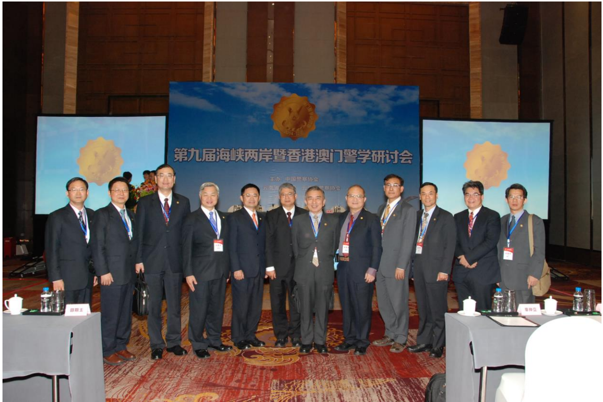
照片 24 本校代表團成員於閉幕後合影