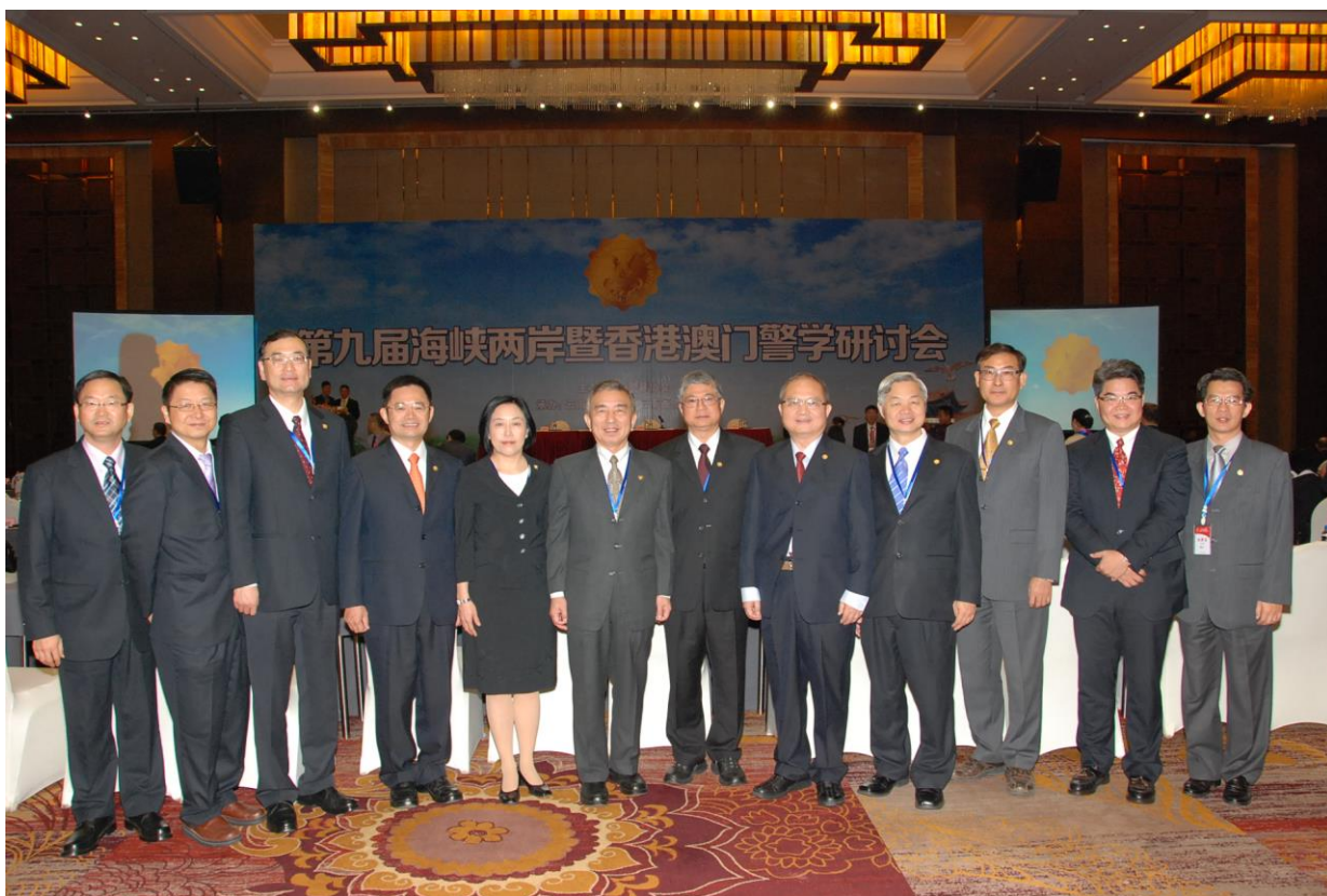
照片 5 本校代表團參加 2014 年第九屆海峽兩岸暨香港澳門警學研討會開幕典禮合照