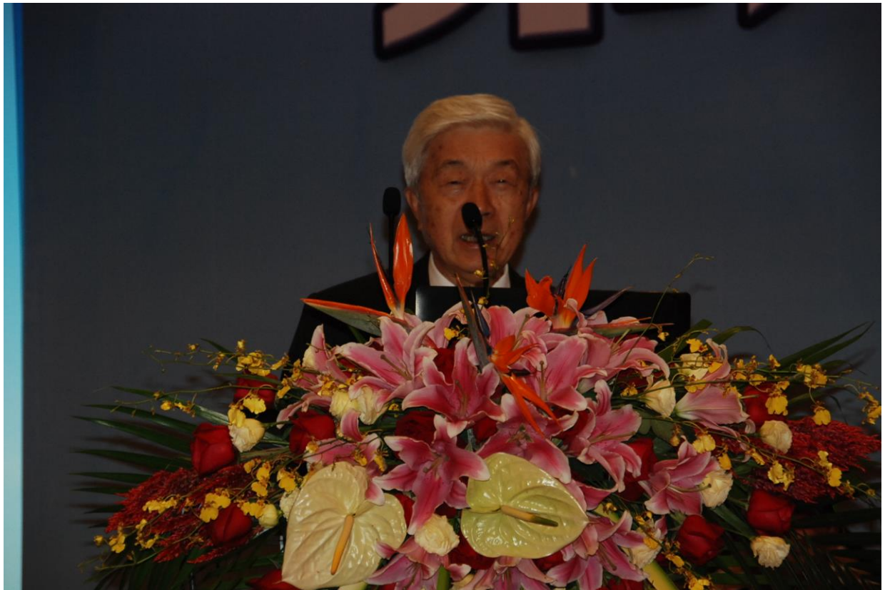
照片 3 大陸地區中國警察協會主席田期玉先生致開幕詞