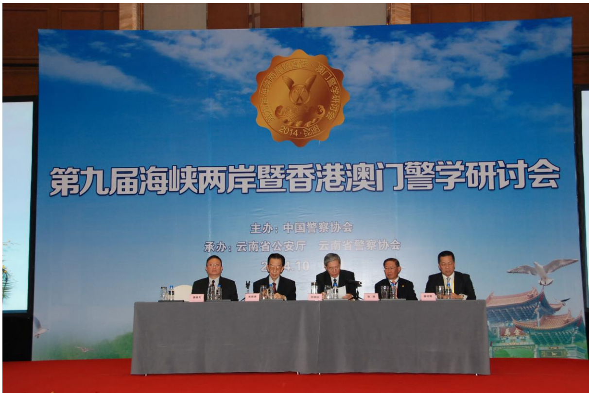
照片 22 第九屆海峽兩岸暨香港澳門警學研討會閉幕典禮代表