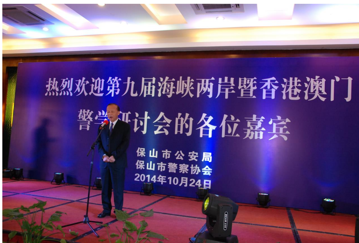
照片 29 保山市公安局唐雲澤局長致詞

本次參訪團至雲南省保山市參訪，保山市唐雲澤副市長(亦是保山市公安局長)親自接待，對參加海峽兩岸暨香港澳門警學研討會的代表團表示熱烈歡迎，表示兩岸四地的治安息息相關，因此警務實務的交流著實重要，特別對海峽兩岸暨香港澳門警學研討會能到雲南來舉辦，也是表示對雲南發展的肯定，也希望代表團的參訪行程能夠充實、圓滿，並祝賀代表團的每一位成員家庭和順、事業騰衝。照片 29 為保山市公安局唐局長雲澤致詞。