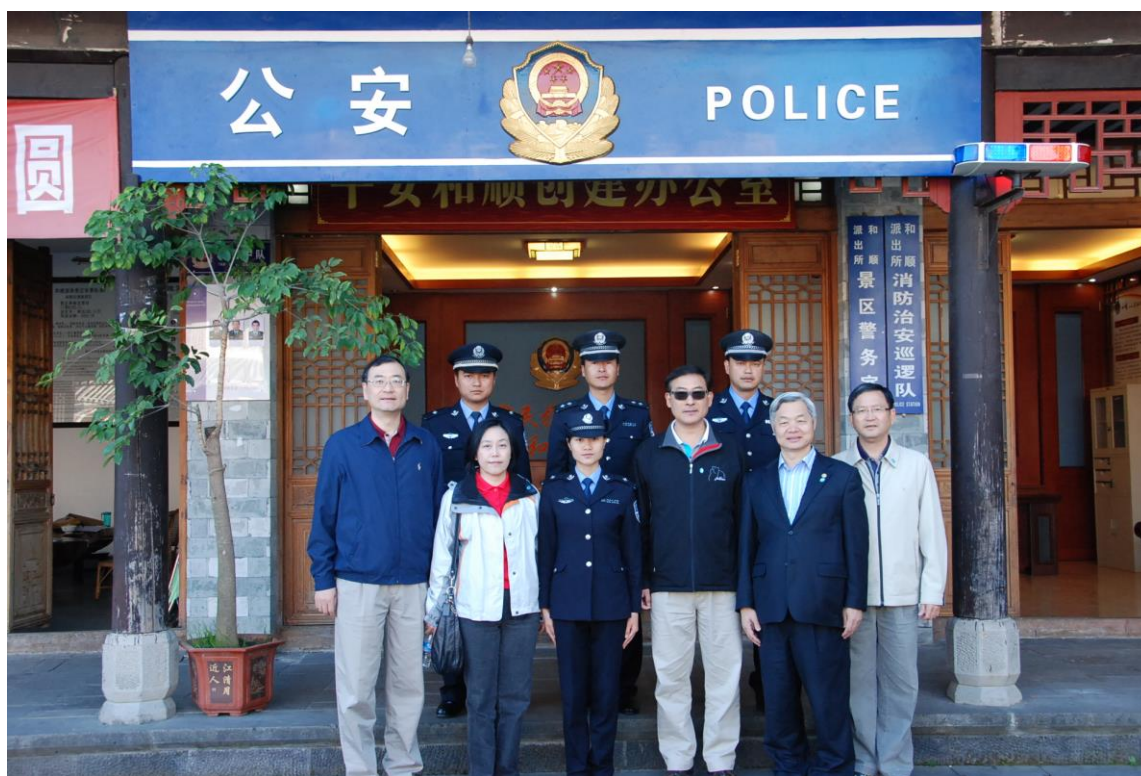
照片 31 為本校參訪團於和順派出所前與該所員警合影