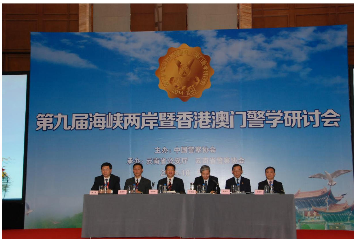
照片 21 第七場論文交流主持人、點評人及發表人

1. 本場主持人：孫明山(中國警察協會副主席)，點評嘉賓：鄭德明(香港警察學院副院長)，發表人分別為陳永銜(移民署專員)、梁嘉文(香港警務處總督察)、王誼華(澳門治安警察局副警長)、趙立功(雲南省昆明市副市長)等四位，如照片 21。