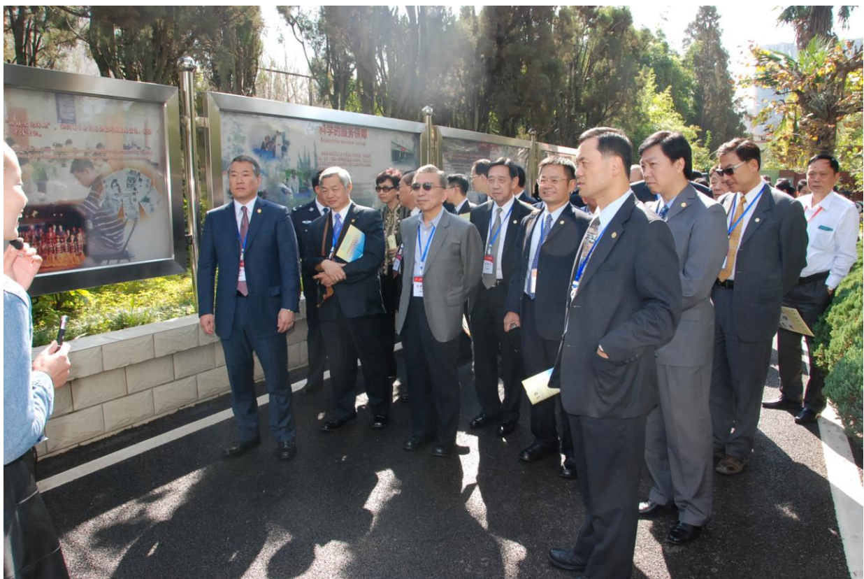
照片 26 本校代表團成員參觀和諧家園戒毒康復社區