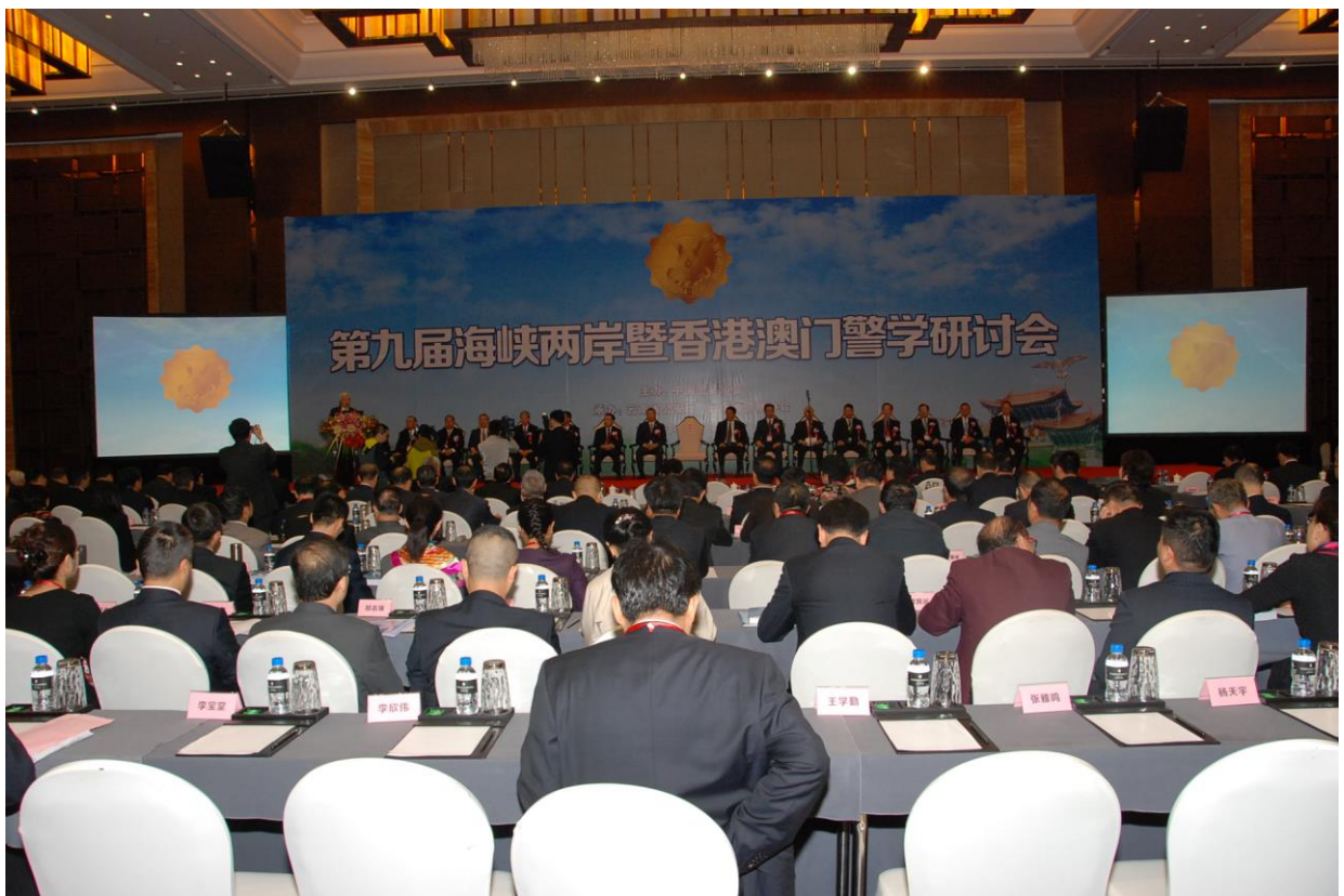
照片 4 2014 年第九屆海峽兩岸暨香港澳門警學研討會開幕典禮會場