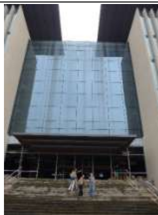
四川圖書館新館建築工地