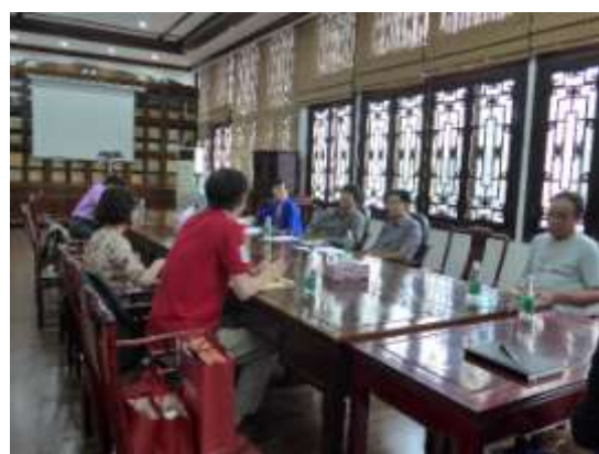
本團同仁與四川圖書館進行交流座談