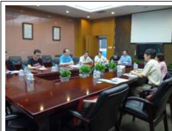
重慶圖書館任館長率同仁與本團座談