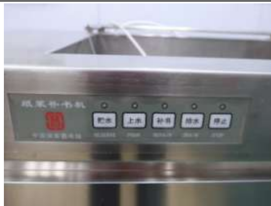
中國國家圖書館研製之紙漿補書機