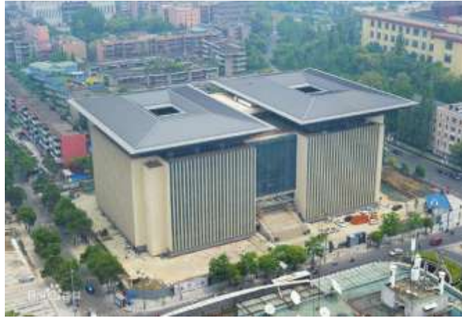
四川省圖書館(新館)