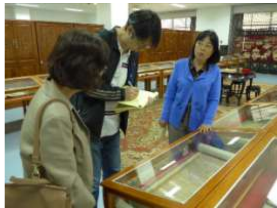
西北大學圖書館古籍書庫