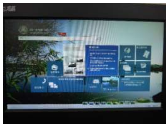
四川大學圖書館的檢索網頁