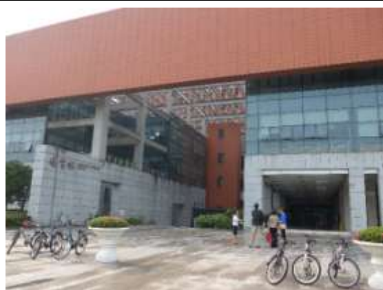
重慶大學圖書館新館建築