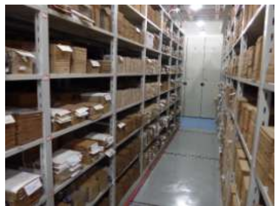
古籍書庫（重慶圖書館）