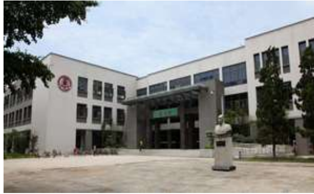
四川大學文理分館