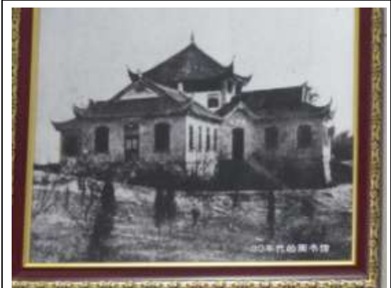
重慶大學圖書館舊館照片