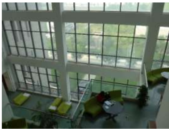
西北大學圖書館窗景