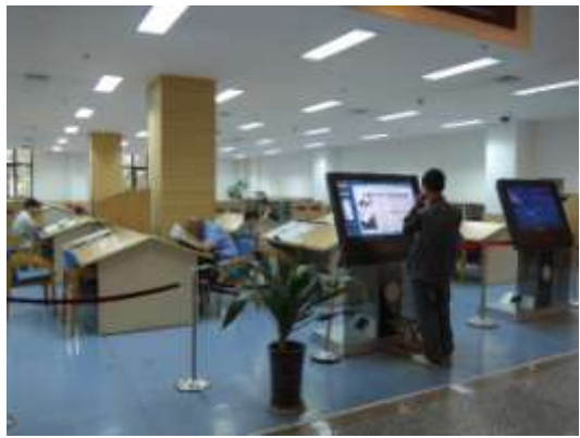
電子閱讀裝置（陝西省圖書館舊館）