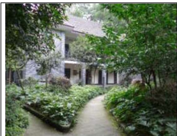
重慶抗戰遺址博物館