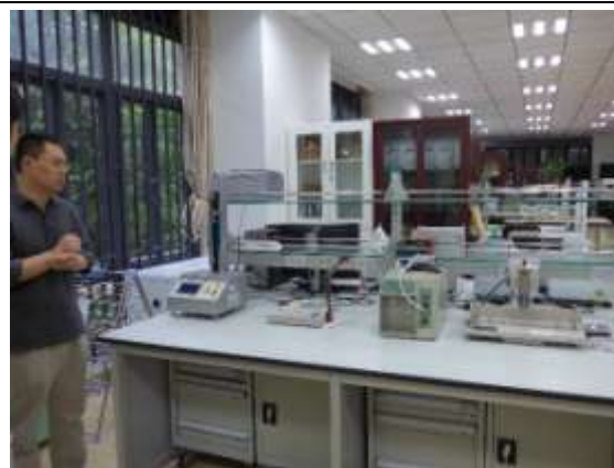
四川大學圖書館的古籍修復設備