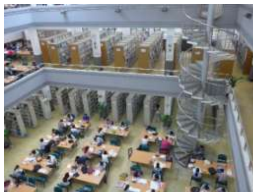
四川大學圖書館的週末讀者