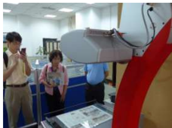
平臺式掃描機（重慶圖書館）