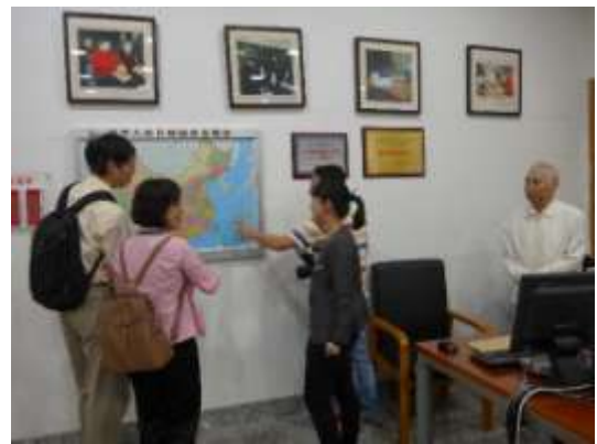
盲人專用地圖（重慶圖書館）