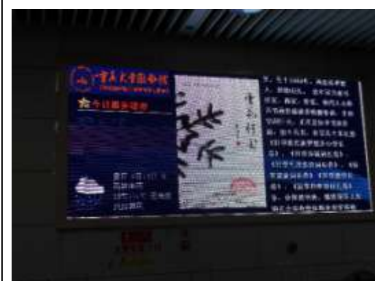
重慶大學圖書館電子服務看板