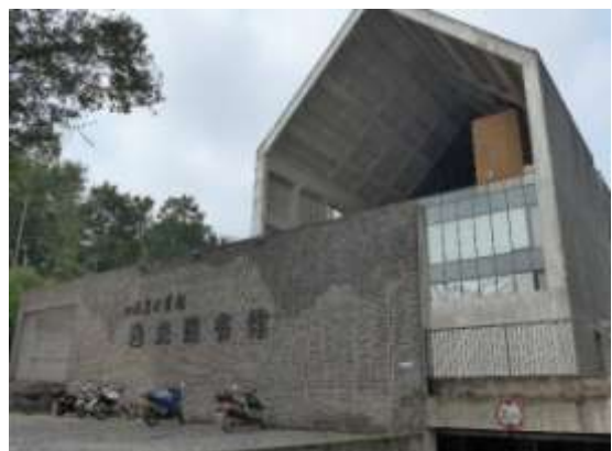
四川美術學院圖書館