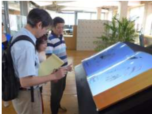
體感控制導覽設備