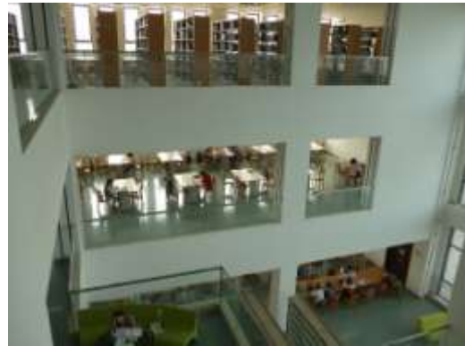
西北大學圖書館閱覽空間