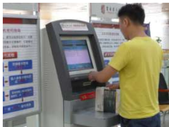
自助借還書設備（重慶圖書館）