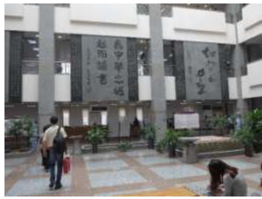
陝西省圖書館大廳