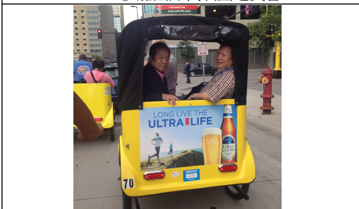
8.20 體驗零污染的人力三輪腳踏計程車