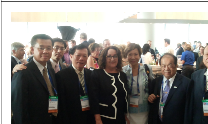
8.18 與新任當選主席內華達州史密斯參議員合影