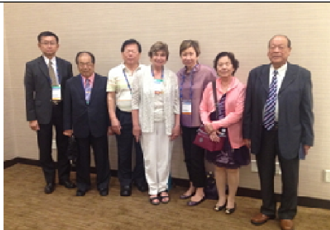
8.18 與 2014 年明州參議會代理議長瑞斯特合照