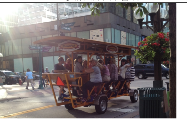
8.20 體驗零污染啤酒觀光電動車