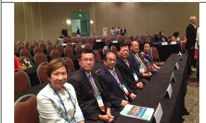
8.18 參加國際代表團迎賓會