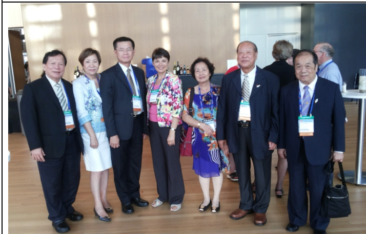
8.18 與 2014 年明尼蘇達州參議會議長帕帕斯合照