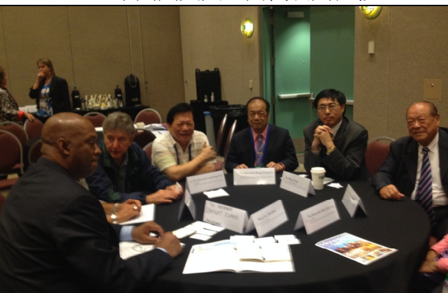
8.19 參加國際圓桌會議