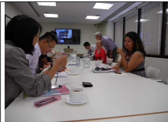
參訪團成員與昆士蘭州政府貿易投資局代表聽取雙方簡報，並進行雙方意見交流