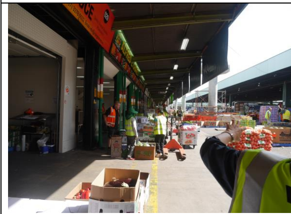
Brisbane Markets 占地 77 公頃，超過 7 千個供貨生產單位，有 53 個批發商