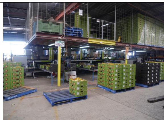
Piñata Farms 鳳梨包裝作業現場