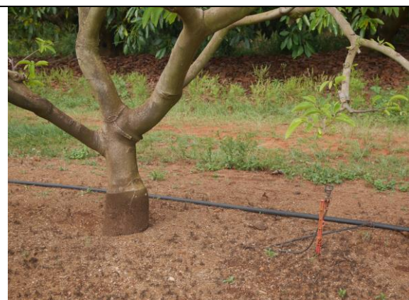
澳洲水資源缺乏 Smerdon Enterprises 的鳳梨釋迦灌溉方式採微噴灌