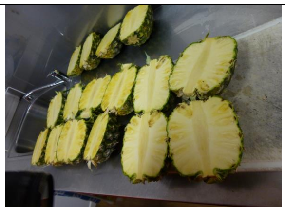
Piñata Farms 品管室在鳳梨採收前會先取 10 個果實進行品管