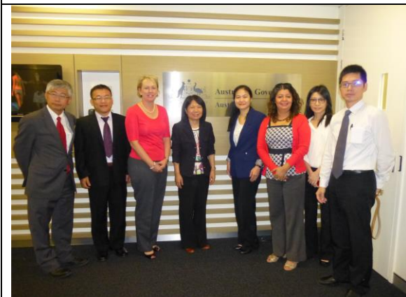
參訪團成員與澳州貿易屬代表合影