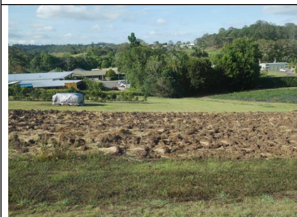
Maroochy Research Facility 佔地 65 公頃，是昆士蘭州農業部的重要研究機構