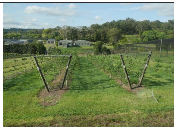
Maroochy Research Facility 內鳳梨釋迦 V 型棚架垂直整枝模式修剪後情形