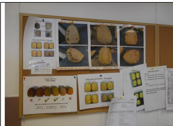
Piñata Farms 鳳梨品管標準