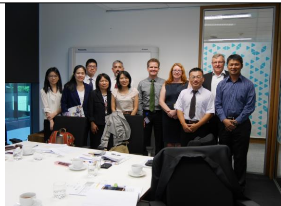
參訪團成員與昆士蘭州政府貿易投資局、澳洲園藝出口協會、芒果產業協會代表合影