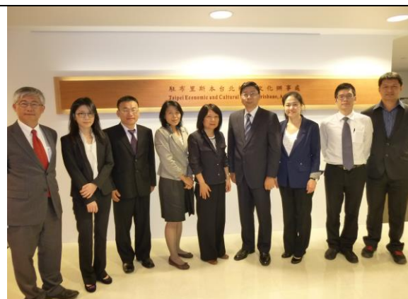
參訪團拜會協助此行的駐布里斯本台北經濟文化辦事處