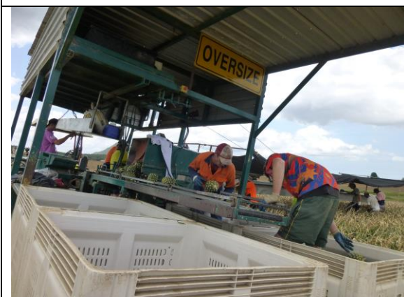
Piñata Farms 鳳梨田間機械採收作業