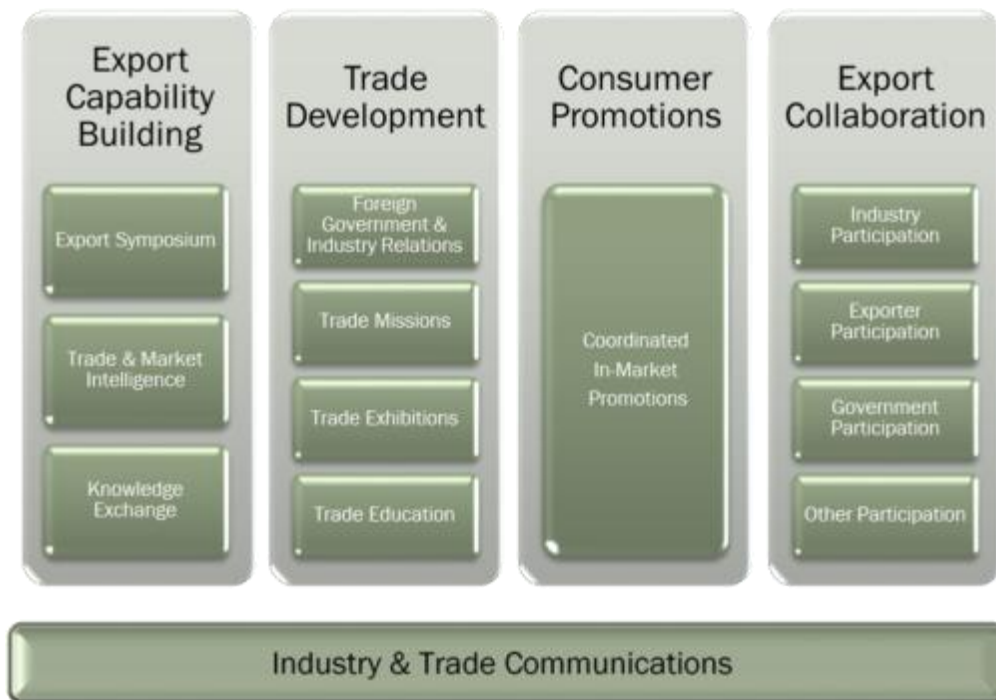
圖一、Australia Fresh 營運內容