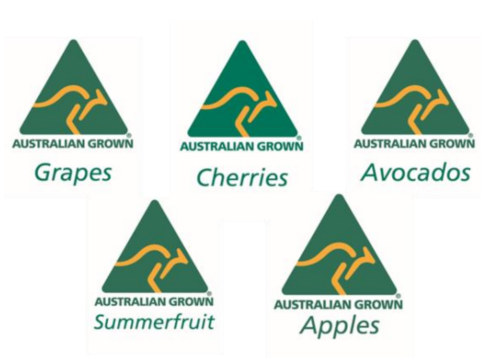
圖二、Australia Fresh 出口產品商標(Australia Fresh 出口水果產品，以三角形袋鼠標誌為商標，其下打上各別水果名稱)