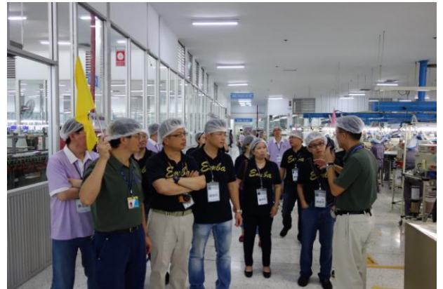
臺北科大經管 EMBA 與泰達電子公司合影及廠區參觀