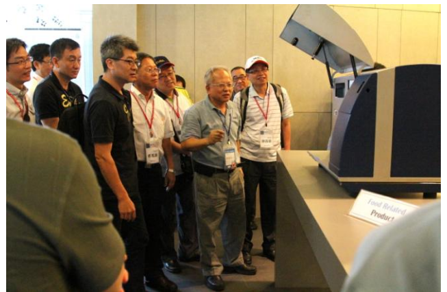
臺北科大經管 EMBA 於經寶精密工業公司門前合影及經寶精密廠區參觀介紹