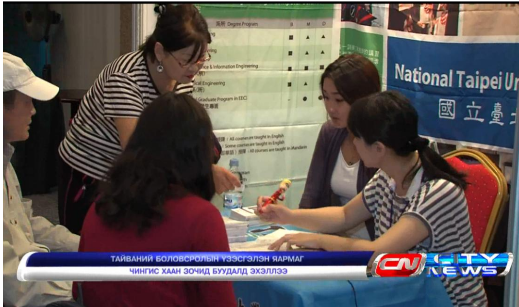
蒙古電視台來採訪教育展首日之新聞畫面