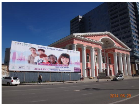
主辦單位分別於兩個主要路口設置教育展大型看板，以吸引來參觀教育展人潮(此為其一)