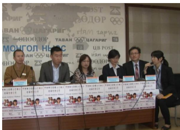
參加 MN25 電視專訪，以英文簡單介紹臺北科技大學學校及科系特色