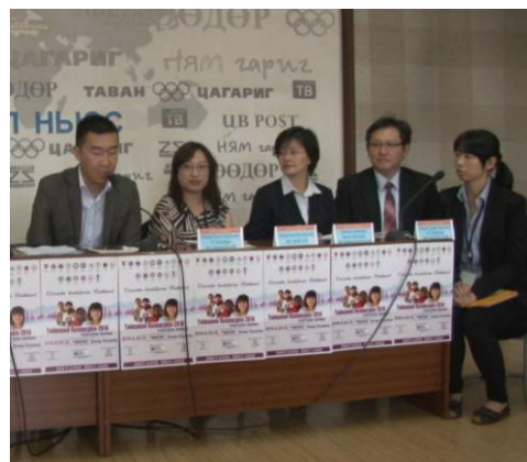
專訪中，主持人以蒙文對觀眾翻譯及介紹本校及科系特色