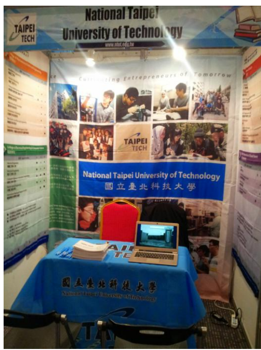
國立臺北科技大學(Taipei Tech) 展覽攤位