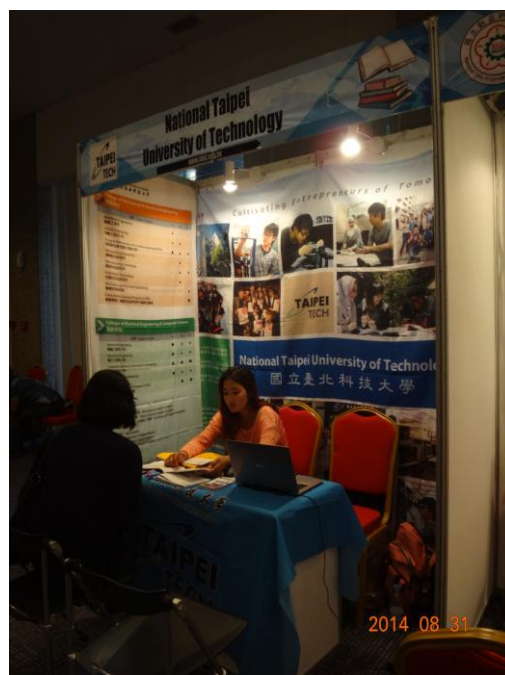
主辦單位所安排的翻譯正以蒙文幫忙介紹學校特色及科系