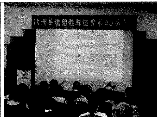
◀ 出席歐洲華僑團體聯誼會第40屆年會，林副主委專題演講「打造和平榮景，再創兩岸新局」