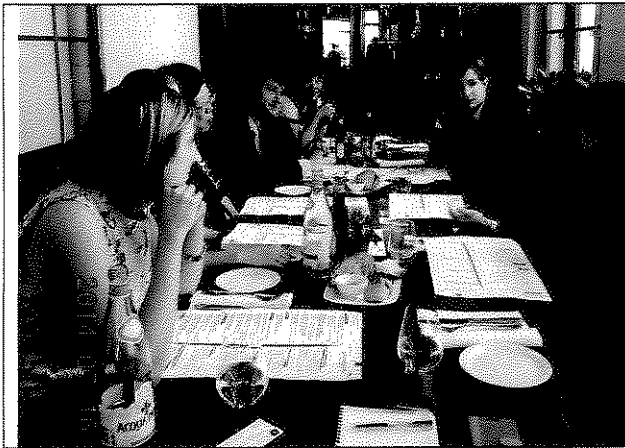
◀ 與捷克研究東亞問題學者午餐敘