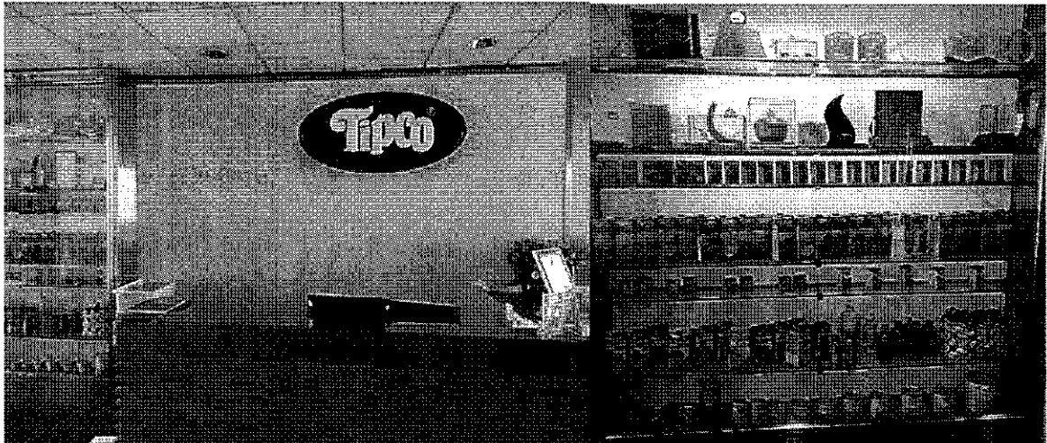
(圖 3：Tipco Foods Public Company Limited 辦公室)

Tipco 集團成立於 1965 年，自建辦公大樓 Tipco Tower，總公司位 26-29 層，其餘樓層出租予其他公司。該集團收入來源 59%來自飲料，32%來自鳳梨罐頭及鳳梨汁，9%來自零售店 Squeeze Bar 及鳳梨種植。