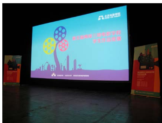
「兩岸三地電影學校電影節」開幕式