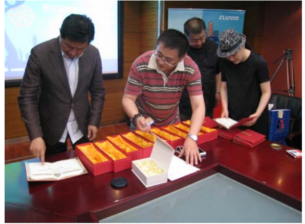
本次競賽作品評審結果出爐，準備頒獎