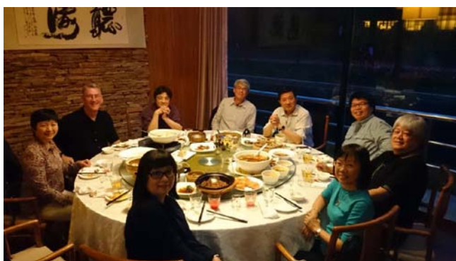
北京電影學院院長張會軍(右三)設宴歡迎本學系及香港演藝學院老師，會中達成北京電影學院與本校簽署學生交流協議之決議