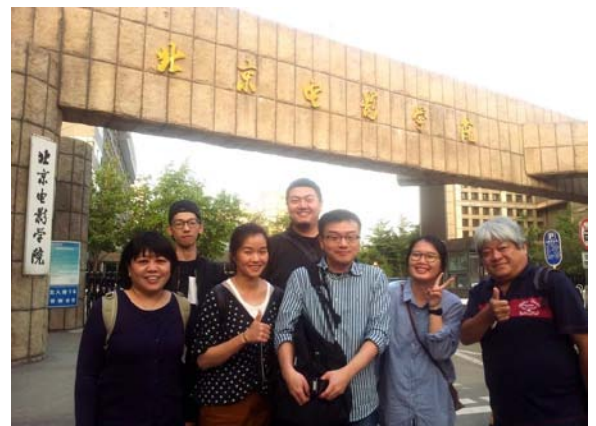
部分北藝大電影創作學系師生在北京電影學院校門合影