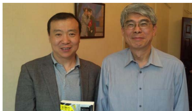
李道明系主任與北京電影學院副校長孫立軍合影