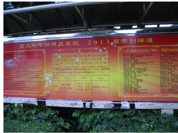
2013 廈門科技中學高考成果