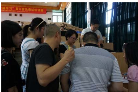
陸生家長與學生報到並索取會意資料