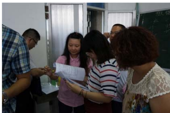
大陸新生說明會諮詢服務