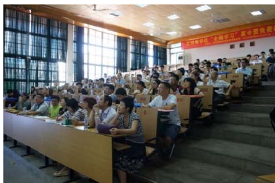
陸生家長與學生專心聆聽