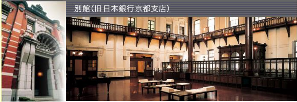
別館(旧日本銀行京都支店)