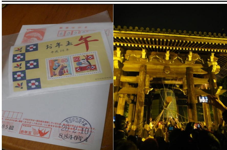
賀年名信片中了三等獎

除夕當晚還有一個必做的習俗，就是前往神社或寺院邊聽著跨年鐘聲邊迎接新年到來，順便完成新年到來後的第一次參拜，此一習俗叫初詣 はつもうで ，這和我們農曆新年去寺廟搶頭香有點類似，但日本人不燒香，而是靜肅的聽著敲鐘(除夜の鐘) じよや かね 迎接新年。