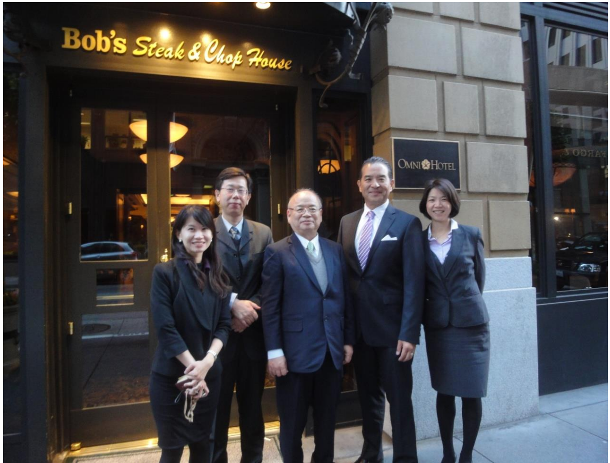
代表團與崔副檢察長在餐廳前合影留念