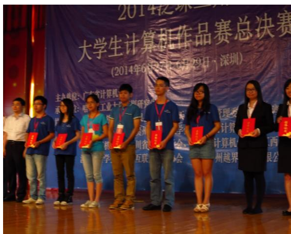
圖三 授領二等獎之紀念照