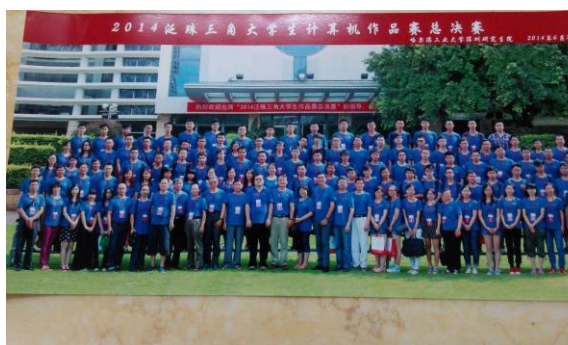
圖一 6/27 開幕式團體紀念照