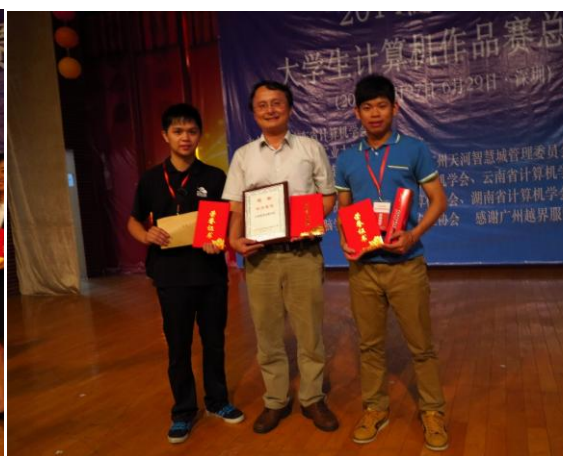
圖四 與參賽學生合影