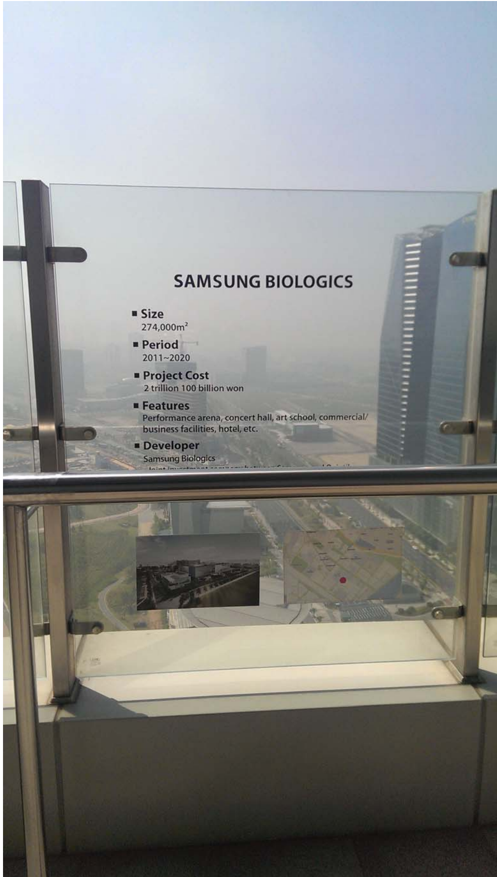
三星生醫物流園區