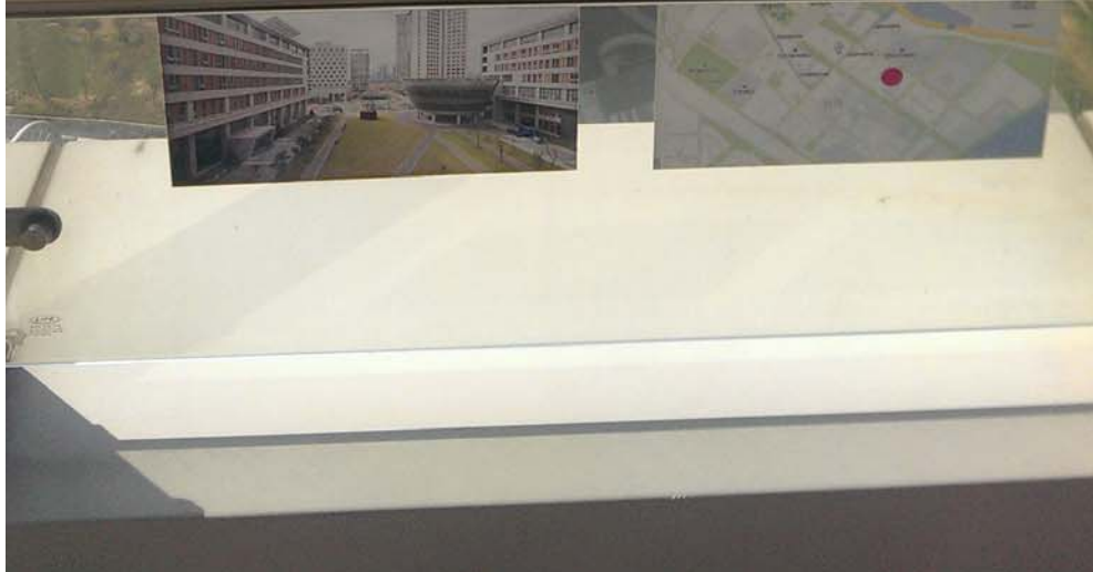
松島規劃的世界大學校區