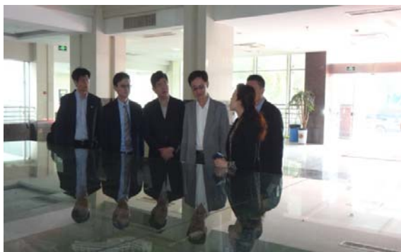
參訪寧波工程學院