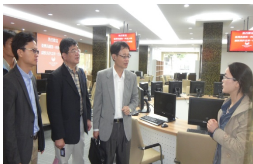
參觀國泰安創業學院