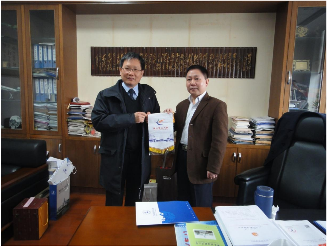
蘇建榮院長致贈中南財大楊燦明校長台北大學錦旗