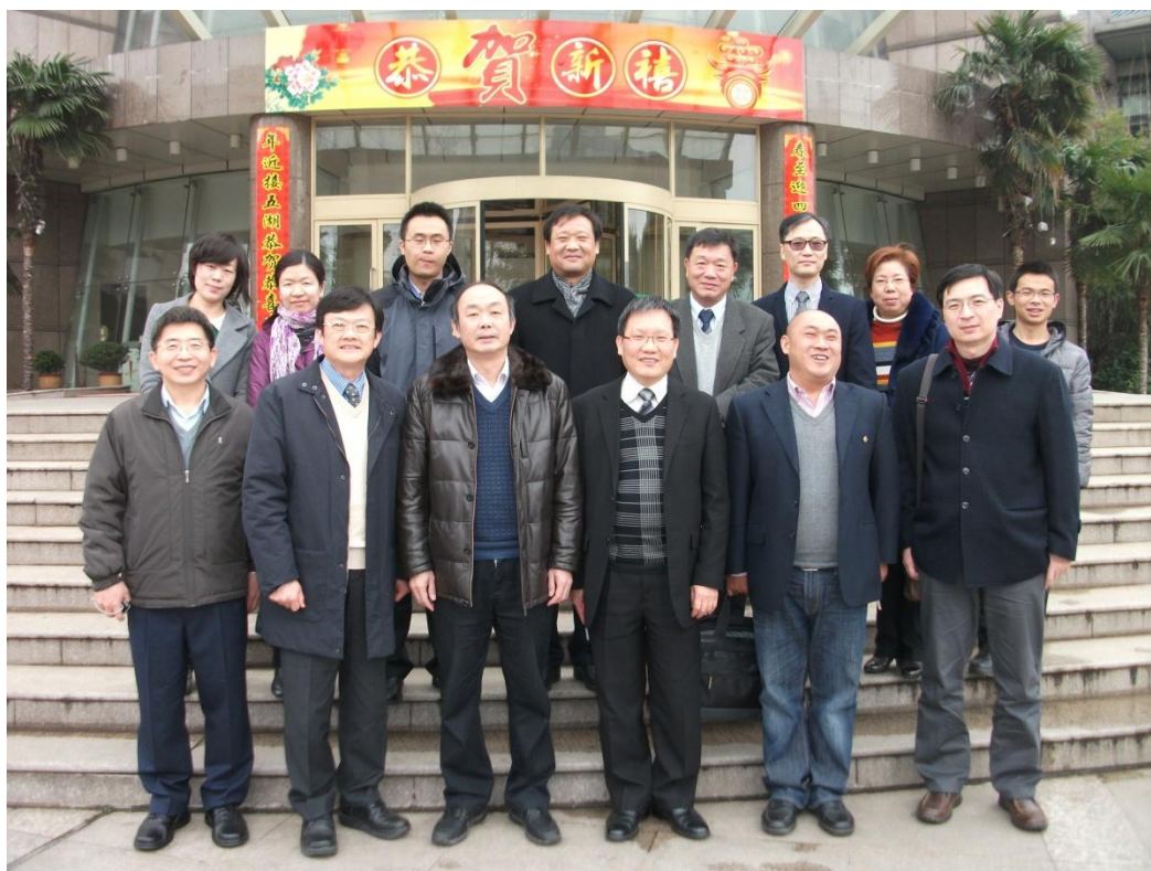
與中南財大會計學院及財政學院老師合影