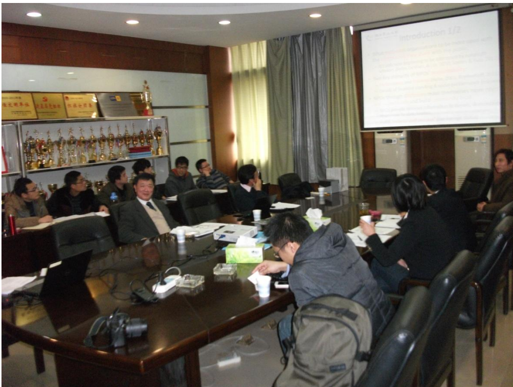
3月7日與中南財大會計學院學術交流 - 現場實況