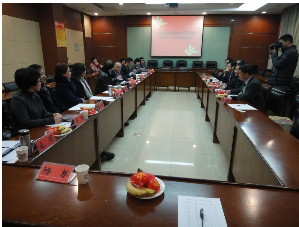
3月6日開幕式及交流會