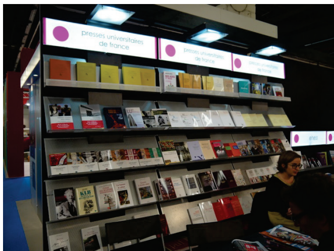
法國大學出版社展位

此次於展期當面交流會談的大學出版單位有：The MIT Press、日本大學出版協會（The Association of Japanese University Presses）、Rowman & Littlefield (University Press of America)