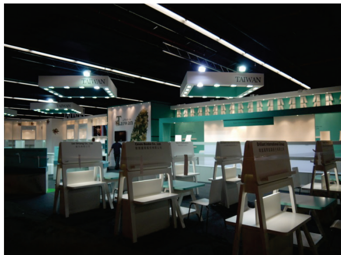
開展前臺灣館展場