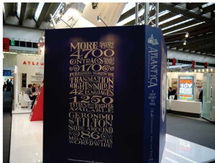
書展特殊展位設計