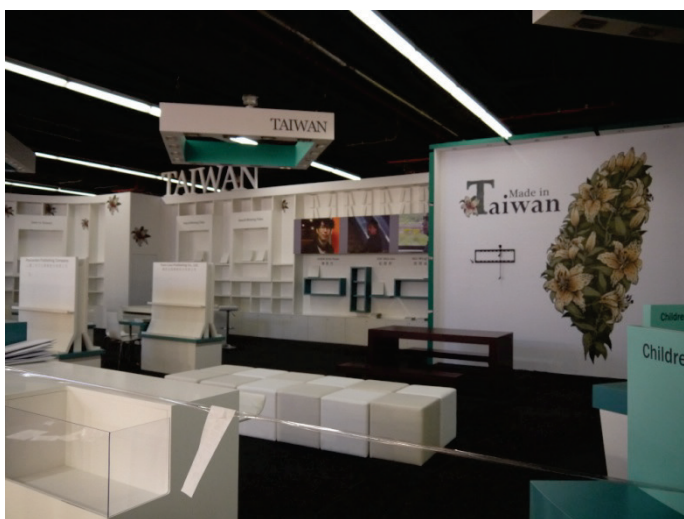
開展前臺灣館展場