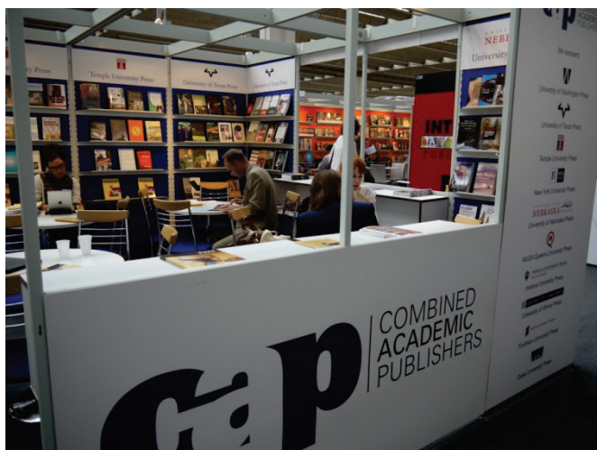
北美大學學術出版社展位