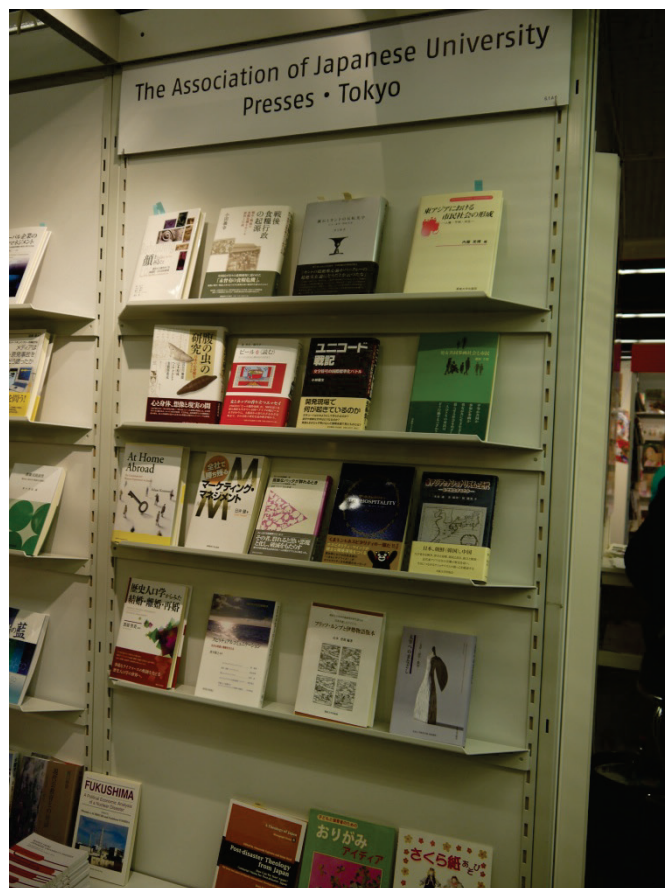
日本大學出版協會展位