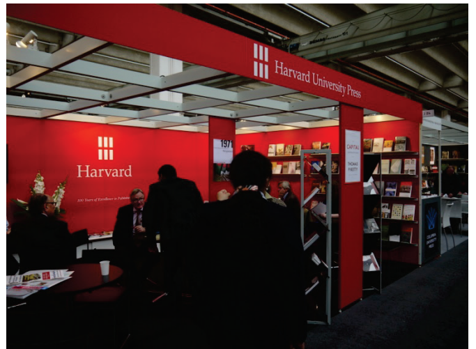
哈佛大學出版社展位