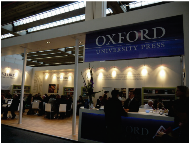
牛津大學出版社展位