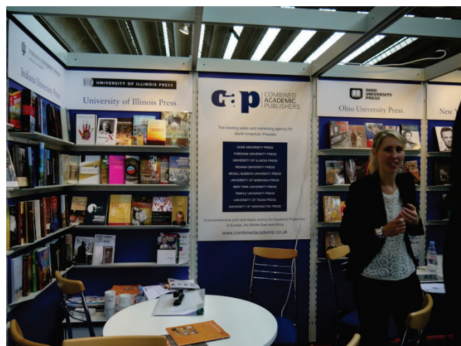
北美大學學術出版社展位