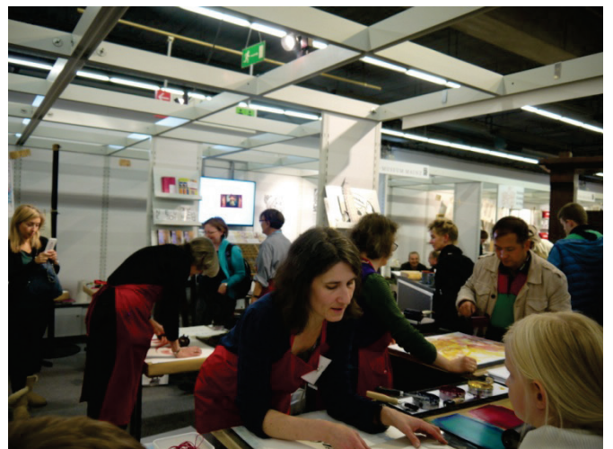
古騰堡博物館展位