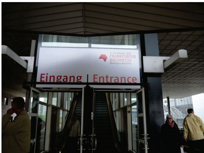
車站出口直往會展通行入口