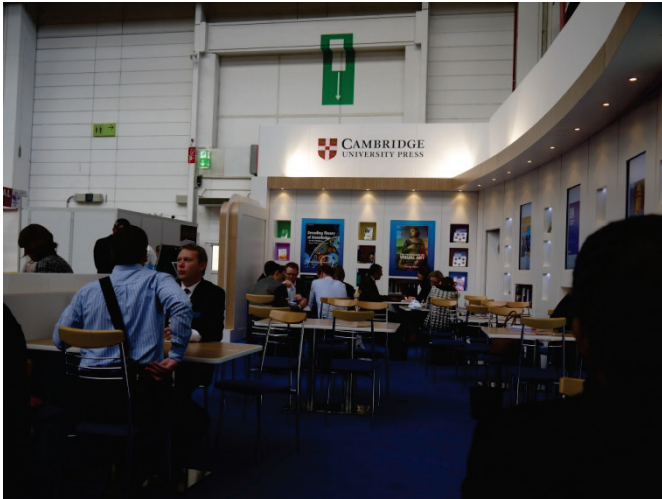
劍橋大學出版社展位