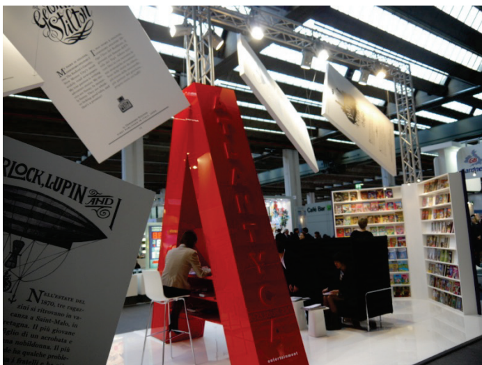
書展特殊展位設計