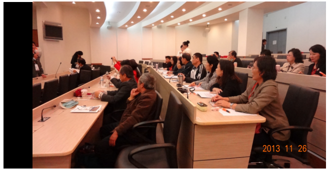
與會人員專心聆聽與熱烈討論