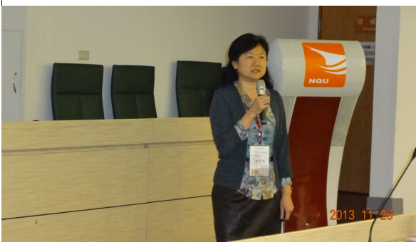
專題講座二—郭乃文教授