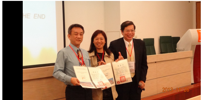
致贈主持人與講座感謝狀