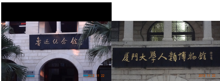
走訪廈門大學校史與魯迅紀念館、人類博物館及優美校園景致