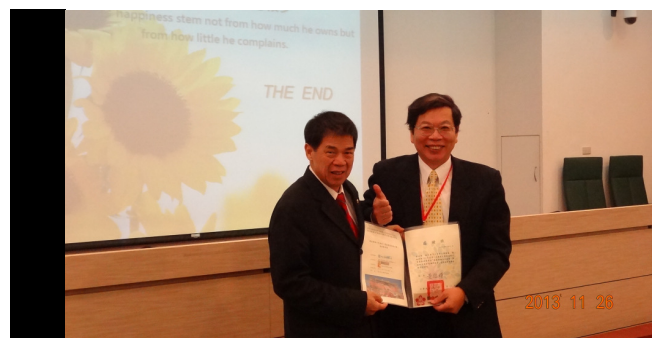
致贈國立金門大學感謝狀