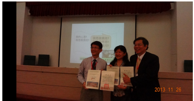
致贈專題講座二主持人與講座感謝狀