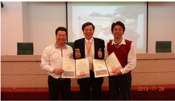
致贈專題講座一主持人與講座感謝狀