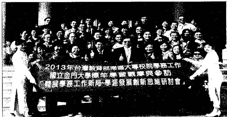
南區大專院校學務長抵金大召開「提昇學務工作專業發展與效能研討會」後合影。

記者莊煥寧／綜合報導 來自台灣南區大專院校學務長一行於昨(26)日假金門大學召開「提昇學務工作專業發展與效能研討會」，並進行學務工作標準學習觀摩參訪，深入了解金門大學位於具有特殊民俗文化的戰地金門，積極