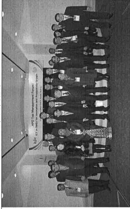
各國出席代表合照