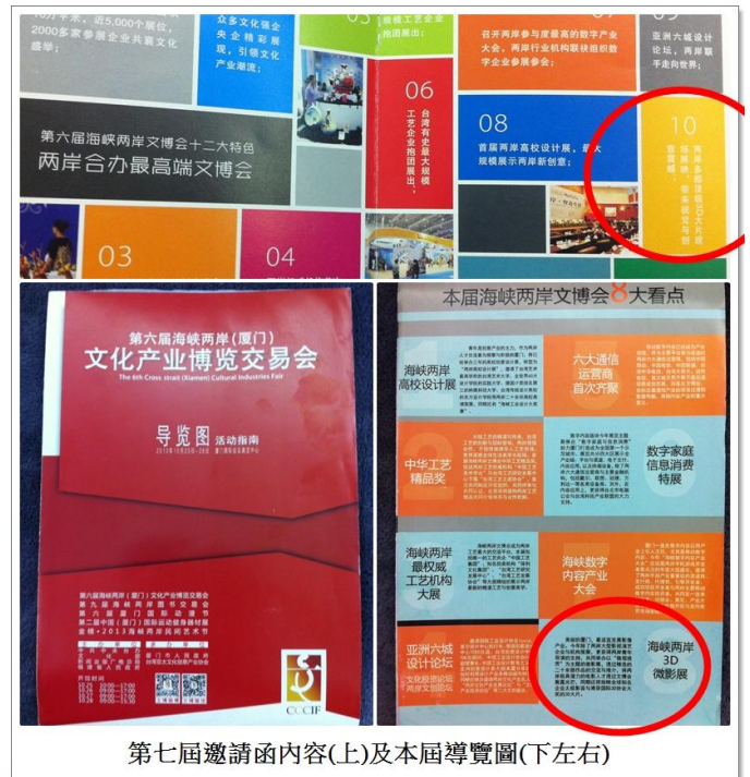
第七屆邀請函內容(上)及本屆導覽圖(下左右)

本次博覽會所有文宣品(如右圖)均將 3 D 微影展作為宣傳的重點項目之，列為「八大看點」及「12 大特色」之一。大會除在 E 展區入口製作微影展「排片表」的大型看板外，並特別為影展印製手冊(如下圖)，介紹參展兩岸影片，美中不足的是，手冊中並未標明作品產地，無法區別影片來自台灣或大陸地區。