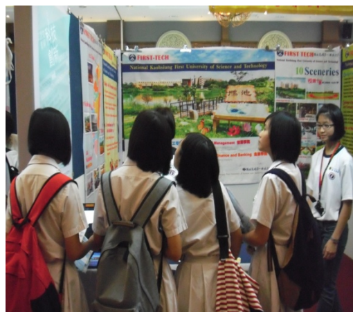
峇株巴轄展場參展學生