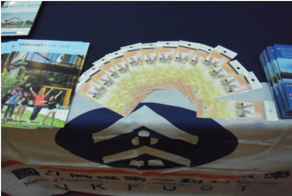
2013 台灣高等教育展文宣及紀念 品