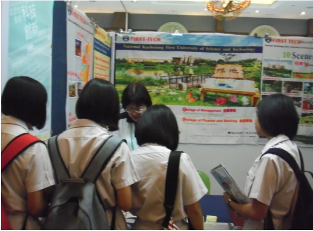
吉隆坡場學生參觀