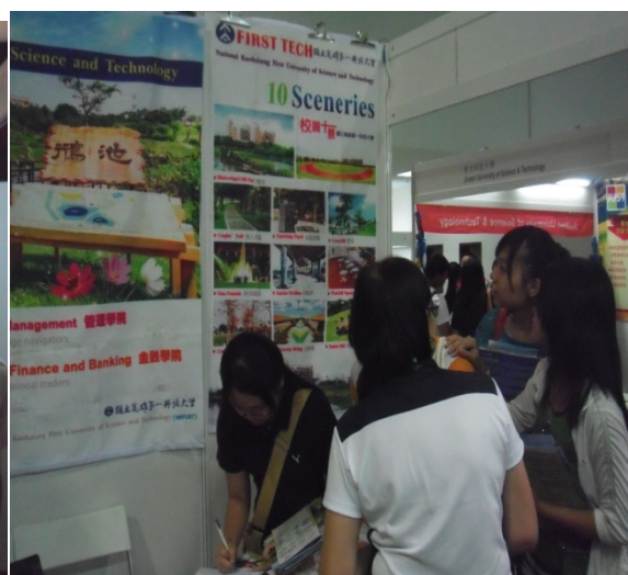
關思組長介紹學校系所 一旁同學 填寫資料