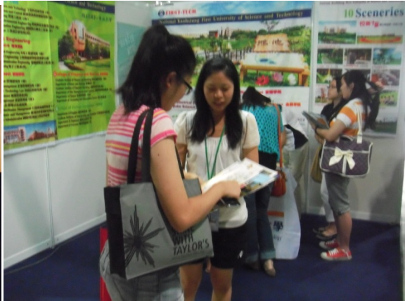
本校人員向學生詢問就讀科系意向