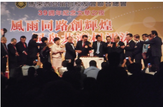
吉隆坡 39 週年紀念文華之夜