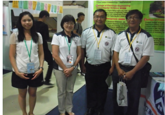
馬來西亞留台聯總會人員參觀合照