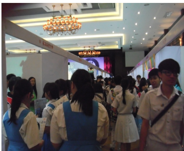
峇株巴轄展場參展人潮