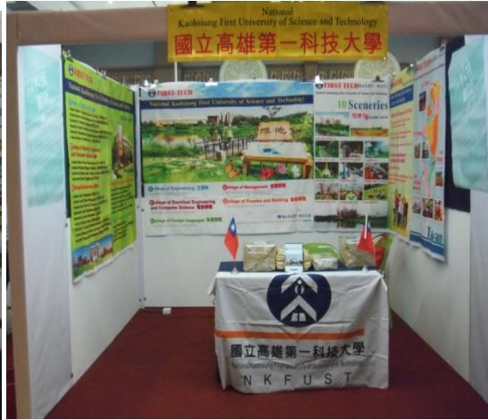
峇株巴轄場佈完成