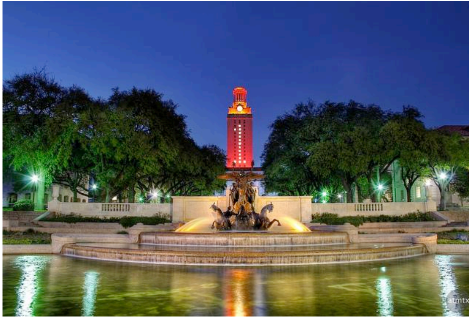
圖 2.2 德州大學奧斯汀校區一景