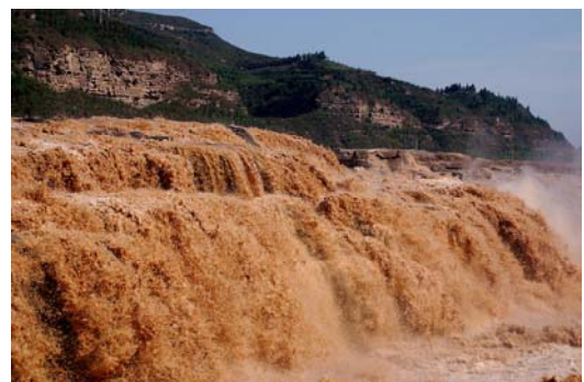
黃河壺口瀑布的壯觀奇景令人讚嘆，也讓同學們大開眼界