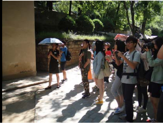
專業導覽員為同學們詳盡解說