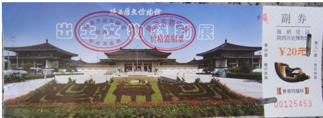
「陝西歷史博物館」文物特展門票