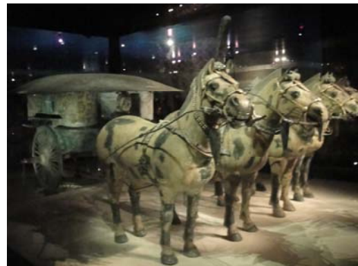
參觀「陝西歷史博物館」入門前留影 秦朝時『安車』可舒適乘坐官車