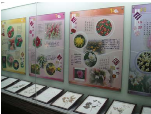
植物館植物標本解說