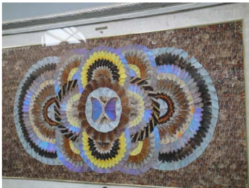
蝴蝶翅膀組合成美麗圖案會反光