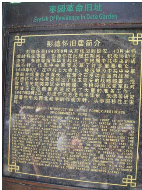
棗園-大陸革命基地舊址