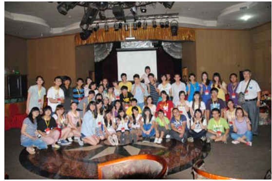
師生聯誼晚會-兩岸的同學們感情交融、個個盡興玩遊戲、開懷唱歌