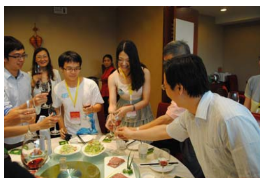
張副校長向台灣同學致意、氣氛和樂