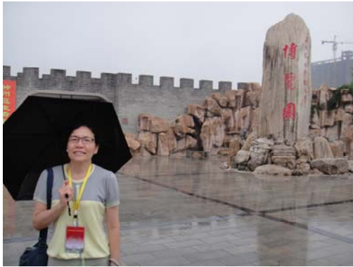
參觀西北農大之博覽園

位封號為「蝶神」的蠟像~周堯教授，是該校的傳奇人物，生前致力於昆蟲及蝴蝶的蒐集與研究，館內陳列了許多他的研究資料、書籍和照片，甚至配合許多有趣的歇後語讓參觀者更能生動的學習。