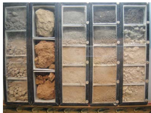
土壤館各種性質物理結構之標本