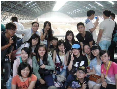
同學們在 1 號坑遺址合影

最早被發現的，由於當時開發的考古學家們缺乏經驗，而忽略了『氧化作用』致使原本附有顏色的彩色「兵馬俑」因長期接觸到空氣中的氧氣，造成化學反應致使其上的著色漸漸褪色，形成了現在大家看到的”單一土色”兵馬俑。依導覽員描述：「兵馬俑」其實在出土時原已裂成許多細小、成千上萬的碎片，而大陸政府爲了保護此文物而斥資鉅額、耗費了 20 多年的時間，用人工仔細地將這些『兵馬俑』重新拼湊起來。令人稱奇的是仔細觀察後這 8,000 多個「兵馬俑」即使裝扮相似(依軍階等級而有所差別)、但個個表情迥異，因此應該係由不同模子及工人逐一塑造來的，可見建造時的浩大工程實必然驚人。導覽員也細敘一件怪事~爲什麼他們都未穿戴頭盔? - 原因係他們都極度勇敢~不怕死。隨著導覽員的生動風趣的詳細解說，我們一一走訪了三個坑道，部份同學也興奮地自費拍照留念。我們對於秦始皇的魄力、古人先進的發明及不可思議的高度技術感到嘆爲觀止！下午我們參訪半坡遺址，隨著當時半坡人搭建房子所留下的遺跡、使用過的陶器及埋葬死者的方式了解他們當時的生活。