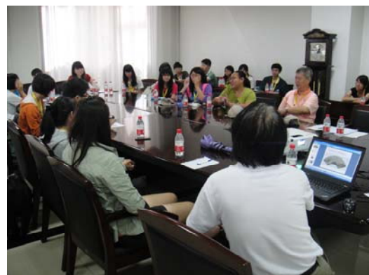
同學們踴躍發問、段教授予以解答