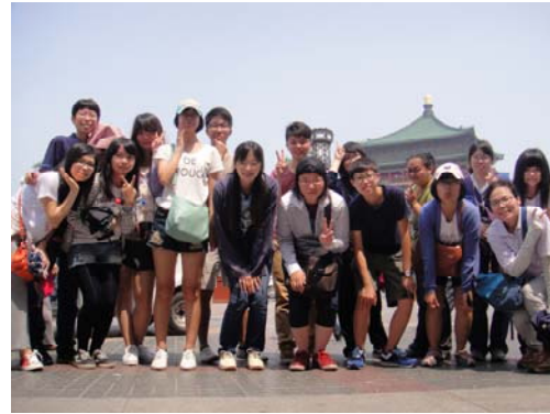
回民街上的特色小吃很多，而居民及商人必須是回族血統才能留駐