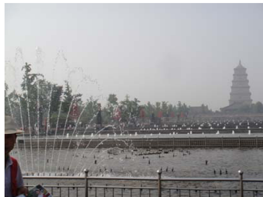
大雁塔前噴泉廣場及慈恩寺內的大雄寶殿(下圖左一)