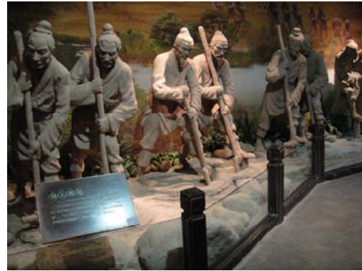
古人農耕期合力開墾