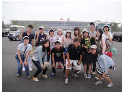
學生興奮到達機場合影