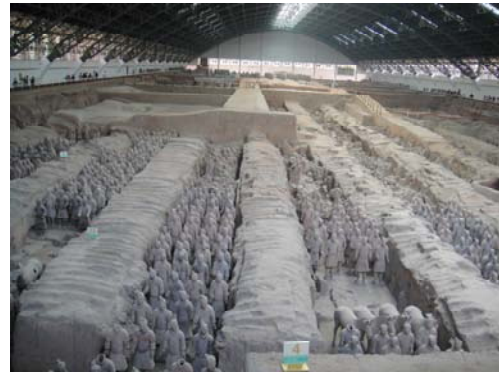
參觀兵馬俑壯觀景象