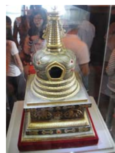
進入大雁塔內(共 7 層樓)，可見玄奘寺主持釋悟謙法師 1999 年所贈舍利子