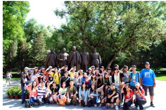
毛澤東在陝北的歷史痕跡，右圖 5 位革命領袖-毛澤東、朱德、劉少奇、周恩來、任弼

二、 返回西安→ 入住唐城賓館(路程 2~3 小時, 但有事故塞車多延長 1.5 小時)