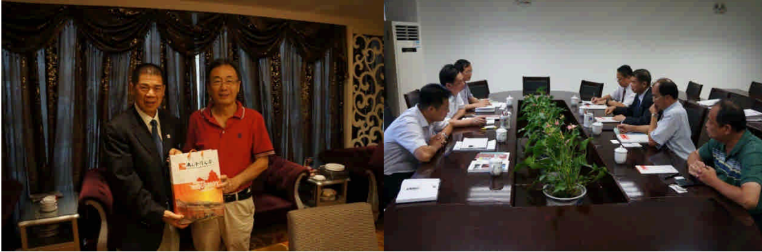
拜會王豫生校長拜會福建省教育廳