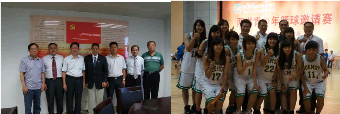
與福建省教育廳主管合影李校長率隊參加兩岸青少年籃球邀請賽