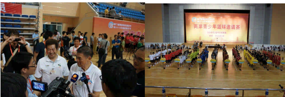
李校長接受兩岸記者採訪兩岸青少年籃球邀請賽開幕儀式