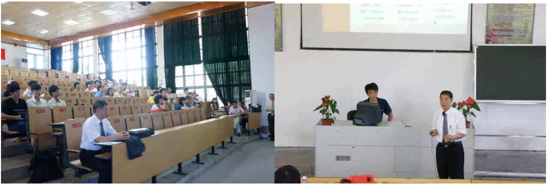
金門大學陸生新生入學說明會與座談會