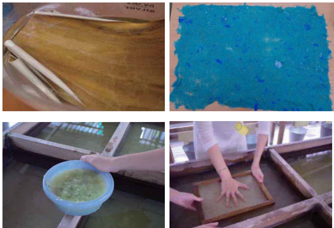
圖 4. 創作過程