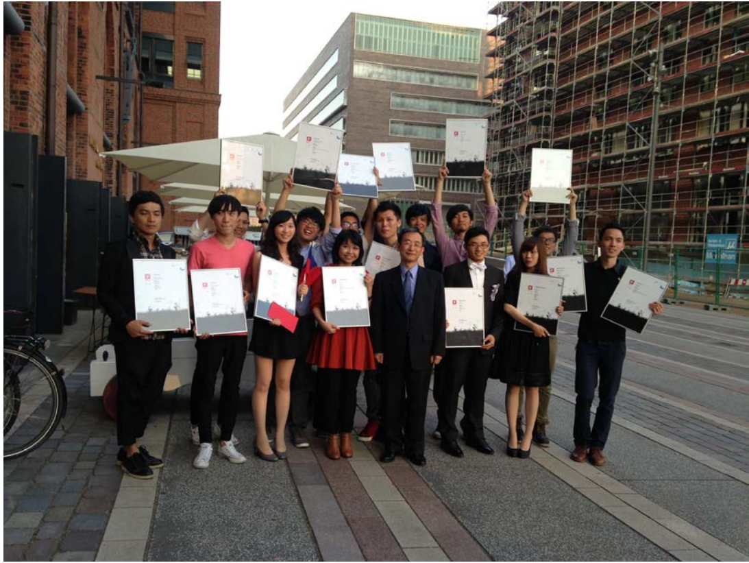
圖 8. 全體台灣得獎同學與張處長合影