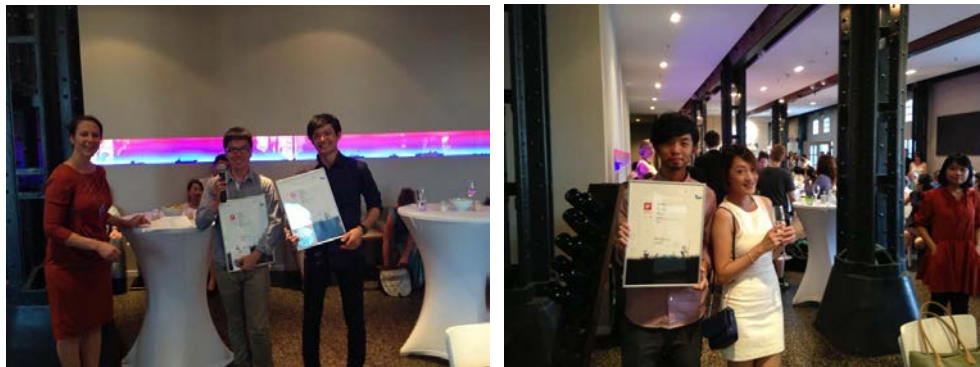
圖 7. 頒獎典禮實況