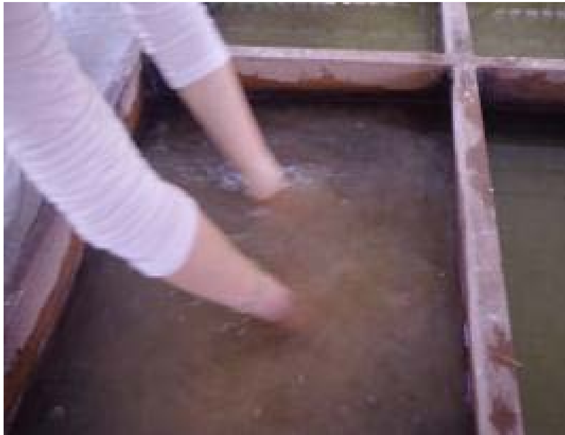
圖 3. 創作過程