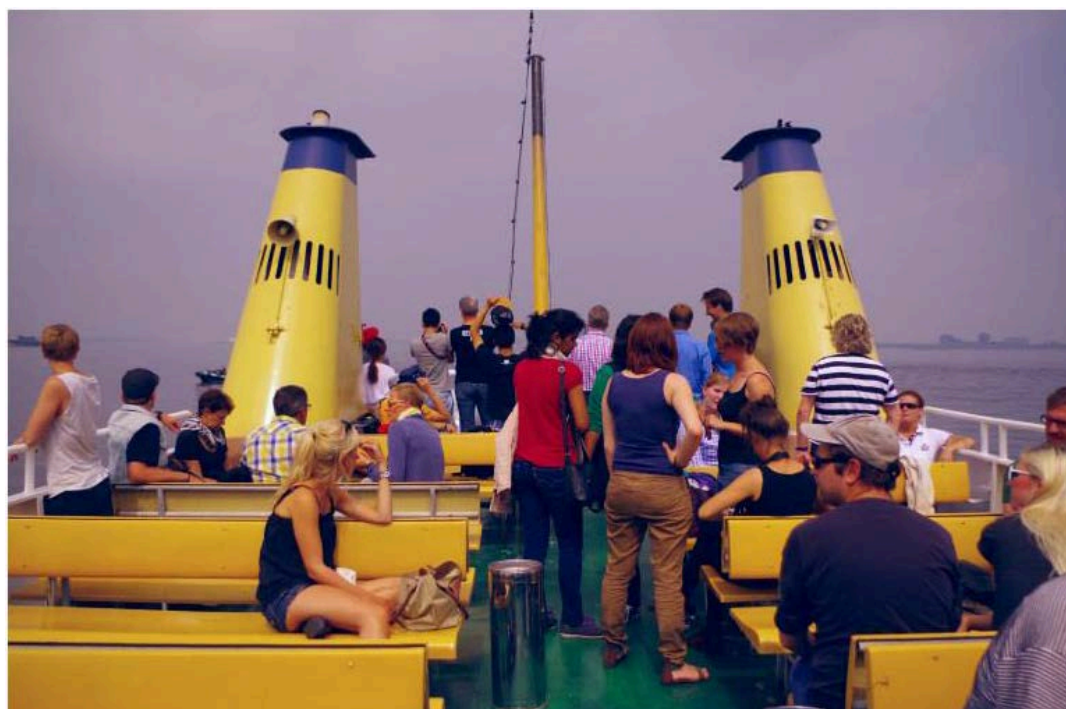
圖 2. 討論過程