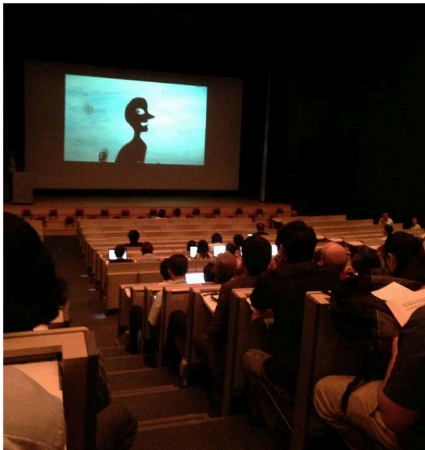
圖 1. 開幕式

進行方式：分成三個小組，各組針對此議題進行討論與思考，從社會、經濟與科技三層切入，並尋求機會點。