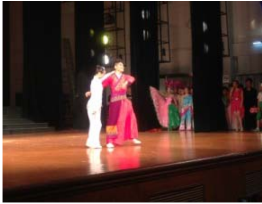
6月12日晚會演員謝幕