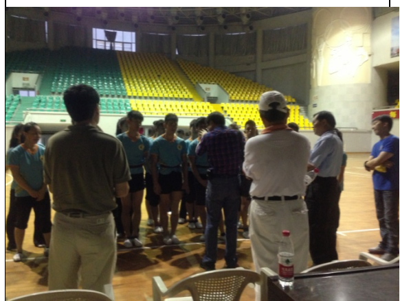
6月10日石獅體育館排練