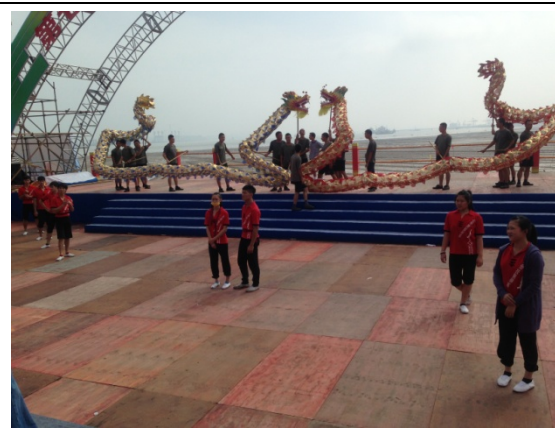
6月11日民俗技藝學系潑水節現場 彩排