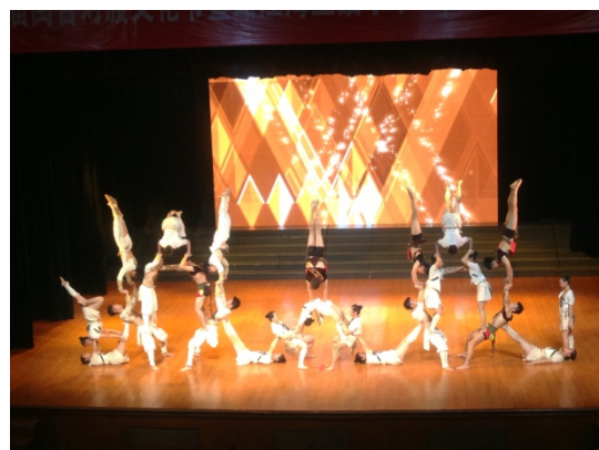
6月12日晚會民俗技藝學系 演出<大武術>