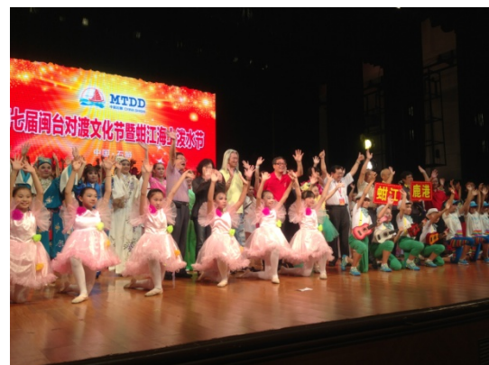
6月12日晚會演員謝幕