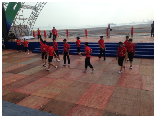
6月11日民俗技藝學系潑水節現場彩排