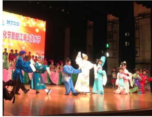
6月12日晚會演員謝幕