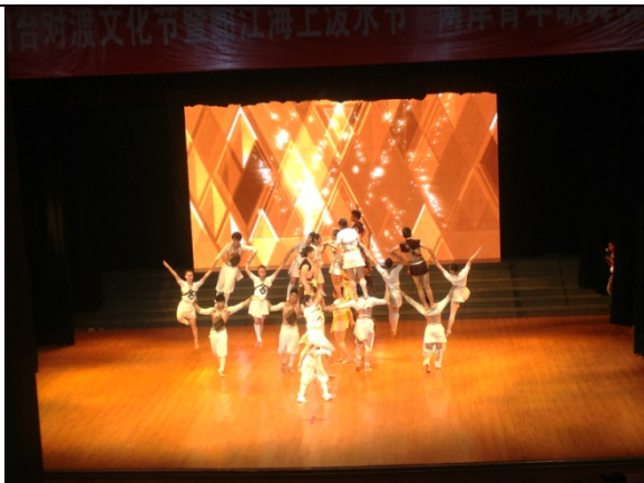
6月12日晚會民俗技藝學系 演出<大武術>