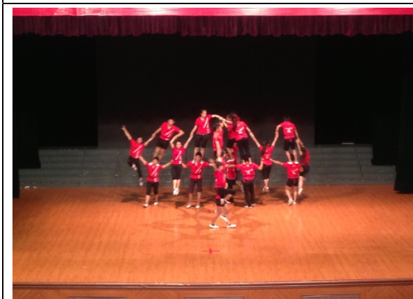
6月11日民俗技藝學系石獅音樂館彩排