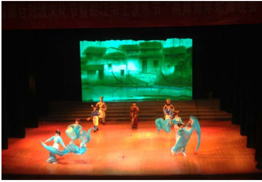
6月12日晚會歌仔戲學系 演出<歌仔戲組曲>