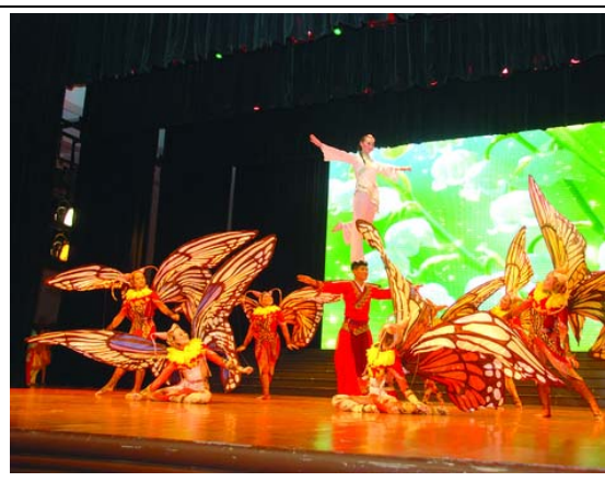
6月12日晚會民俗技藝學系 演出<金蛇騰龍>