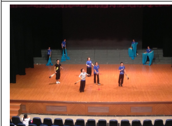
6月11日歌仔戲學系石獅音樂館彩排