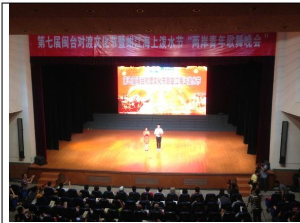
6月12日兩岸青年端午歌舞晚會現場