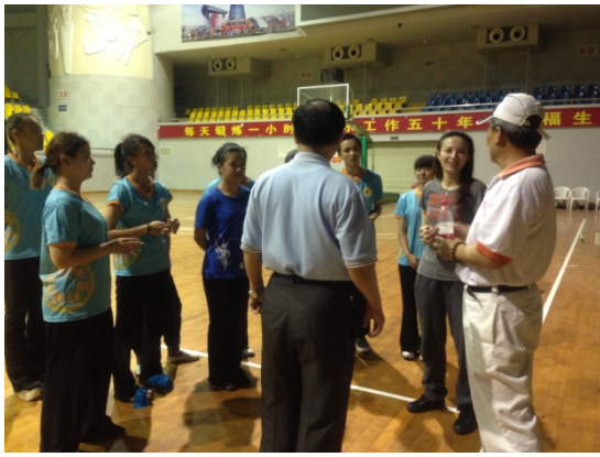
6月10日石獅體育館排練