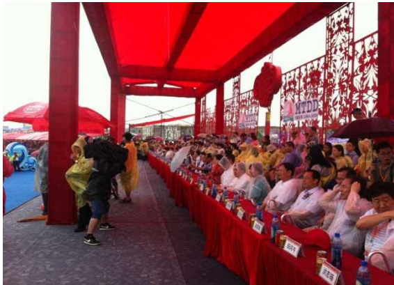
6月12日潑水節主席台