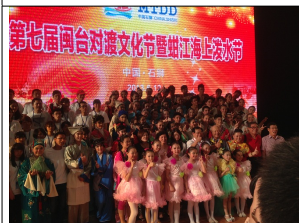
6月12日晚會領導演員合影