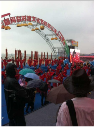
6月12日潑水節主舞台