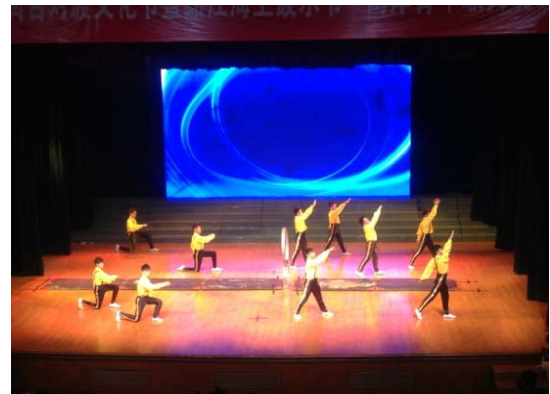
6月12日晚會民俗技藝學系 演出<地圈>