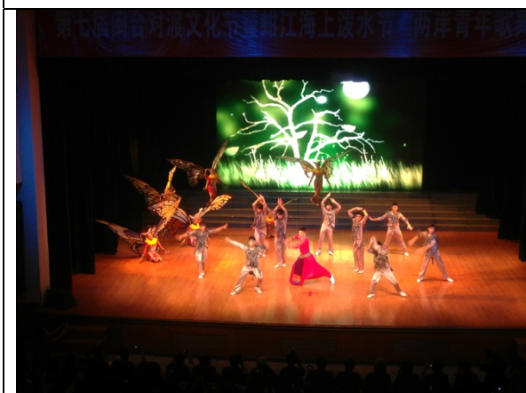
6月12日晚會民俗技藝學系 演出<金蛇騰龍>