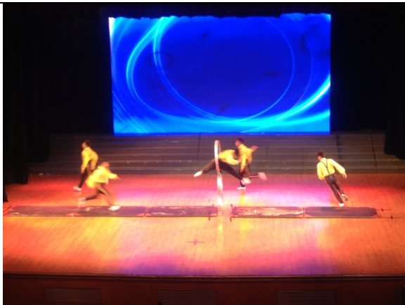
6月12日晚會民俗技藝學系 演出<地圈>