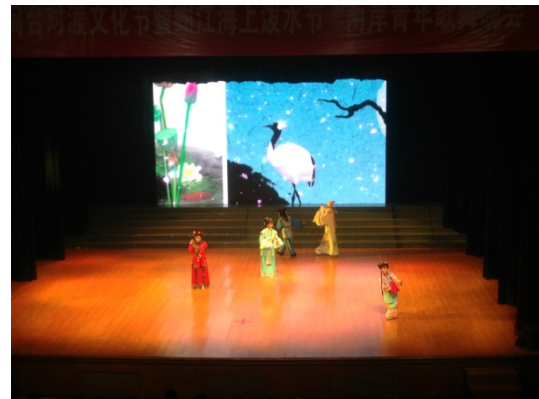
6月12日晚會歌仔戲學系 演出<陳三五娘慶端午>