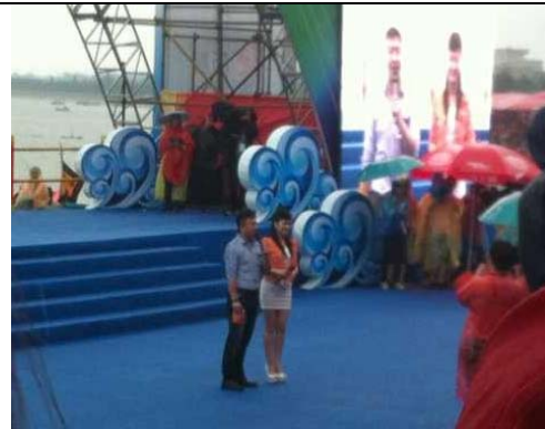
6月12日潑水節主舞台