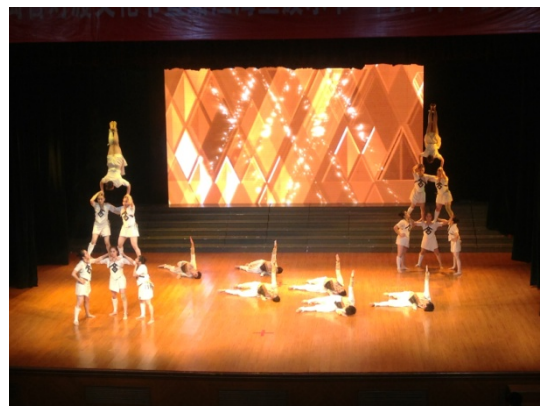
6月12日晚會民俗技藝學系 演出<大武術>