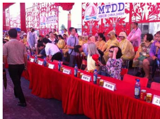
6月12日潑水節主席台