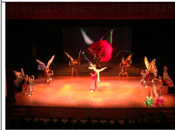
6月12日晚會民俗技藝學系 演出<金蛇騰龍>