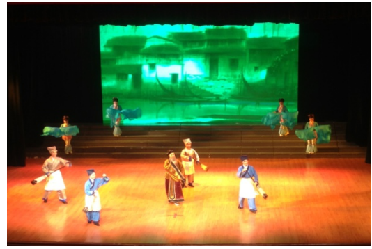
6月12日晚會歌仔戲學系 演出<歌仔戲組曲>