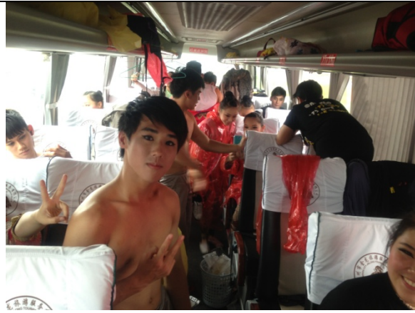
6月12日潑水節因天氣因素取消 民俗技藝學系於遊覽車上著裝準備