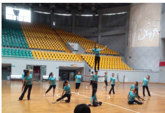
6月10日民俗技藝學系石獅體育館排練