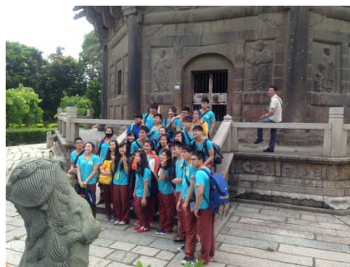
6月10日泉州開元寺參訪