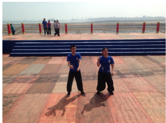
6月11日歌仔戲學系潑水節現場 彩排