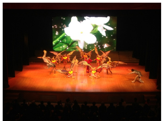
6月12日晚會民俗技藝學系 演出<金蛇騰龍>