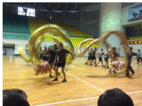
6月10日石獅體育館排練