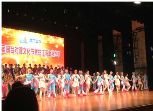
6月12日晚會演員謝幕