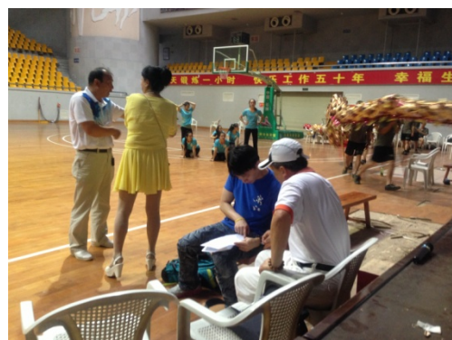
6月10日石獅體育館排練