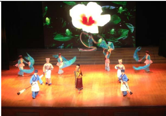
6月12日晚會歌仔戲學系 演出<歌仔戲組曲>