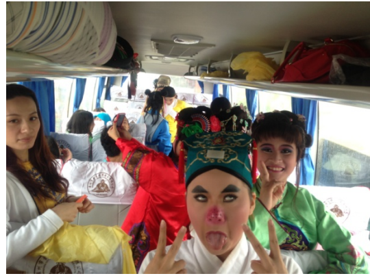
6月12日潑水節因天氣因素取消 歌仔戲學系於遊覽車上著裝準備