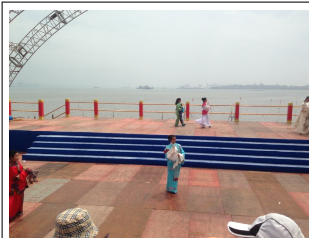
6月11日歌仔戲學系潑水節現場彩排