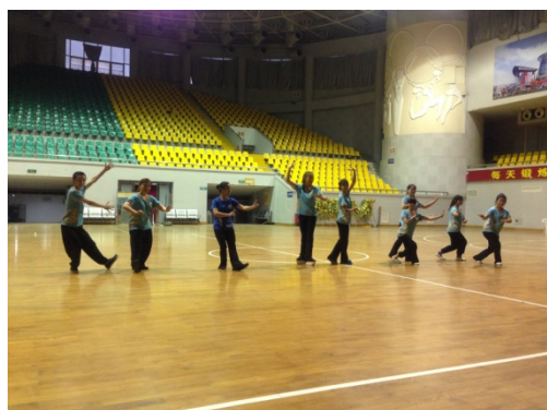
6月10日歌仔戲學系石獅體育館排練