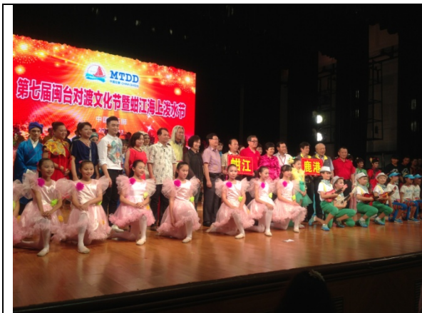
6月12日晚會領導演員合影