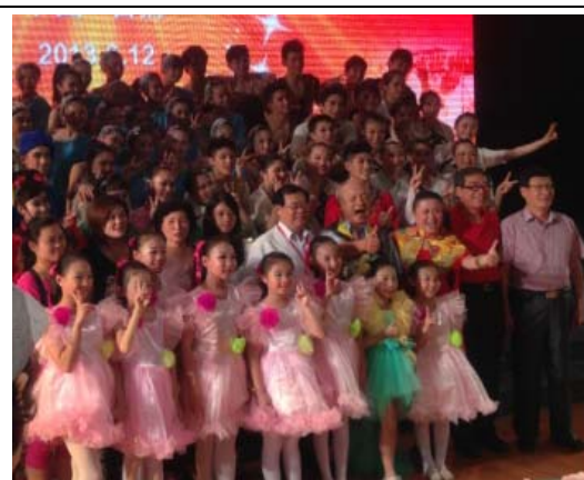
6月12日晚會領導演員合影