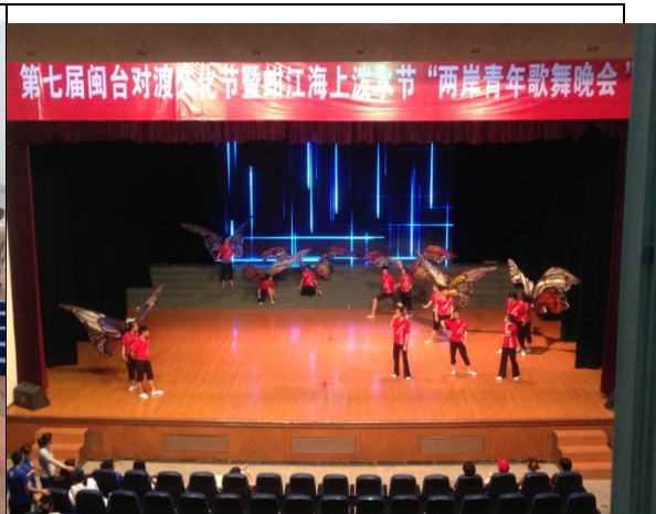
6月11日民俗技藝學系石獅音樂館彩排