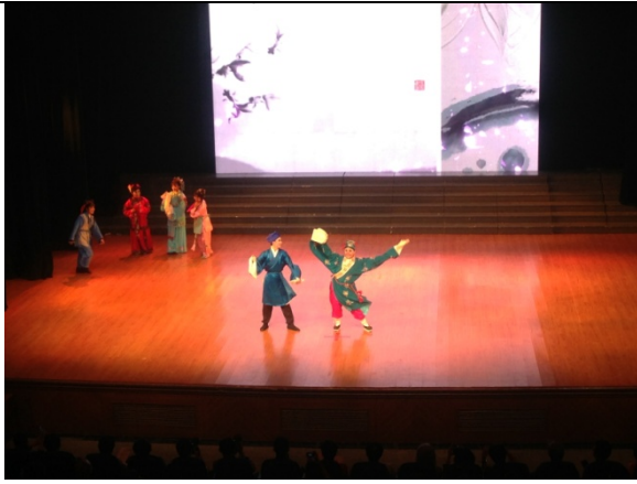
6月12日晚會歌仔戲學系 演出<陳三五娘慶端午>