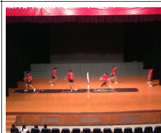
6月11日民俗技藝學系石獅音樂館彩排