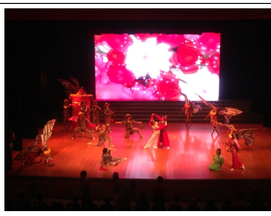
6月12日晚會民俗技藝學系 演出<金蛇騰龍>