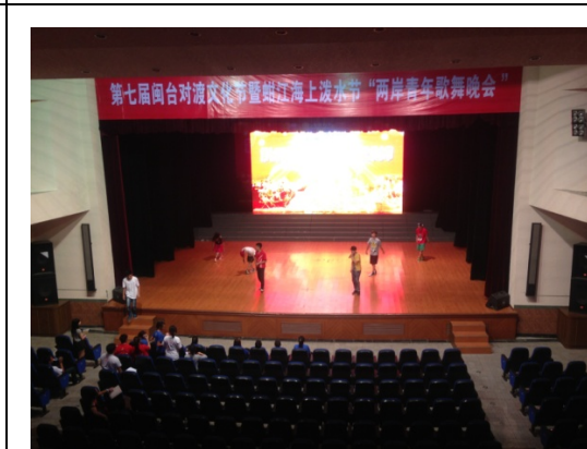
6月11日歌仔戲學系石獅音樂館彩排