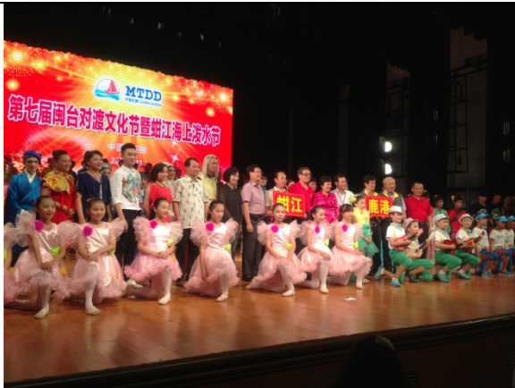
6月12日晚會演員謝幕