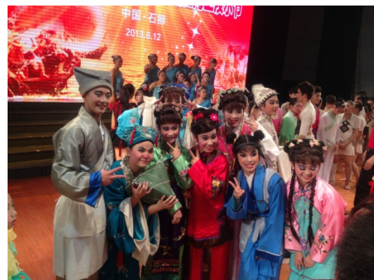
6月12日晚會演員謝幕