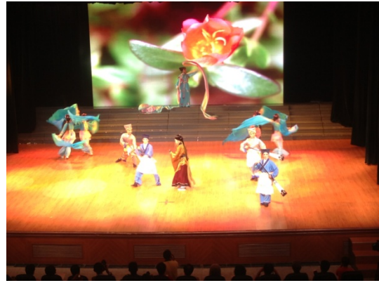
6月12日晚會歌仔戲學系 演出<陳三五娘慶端午>