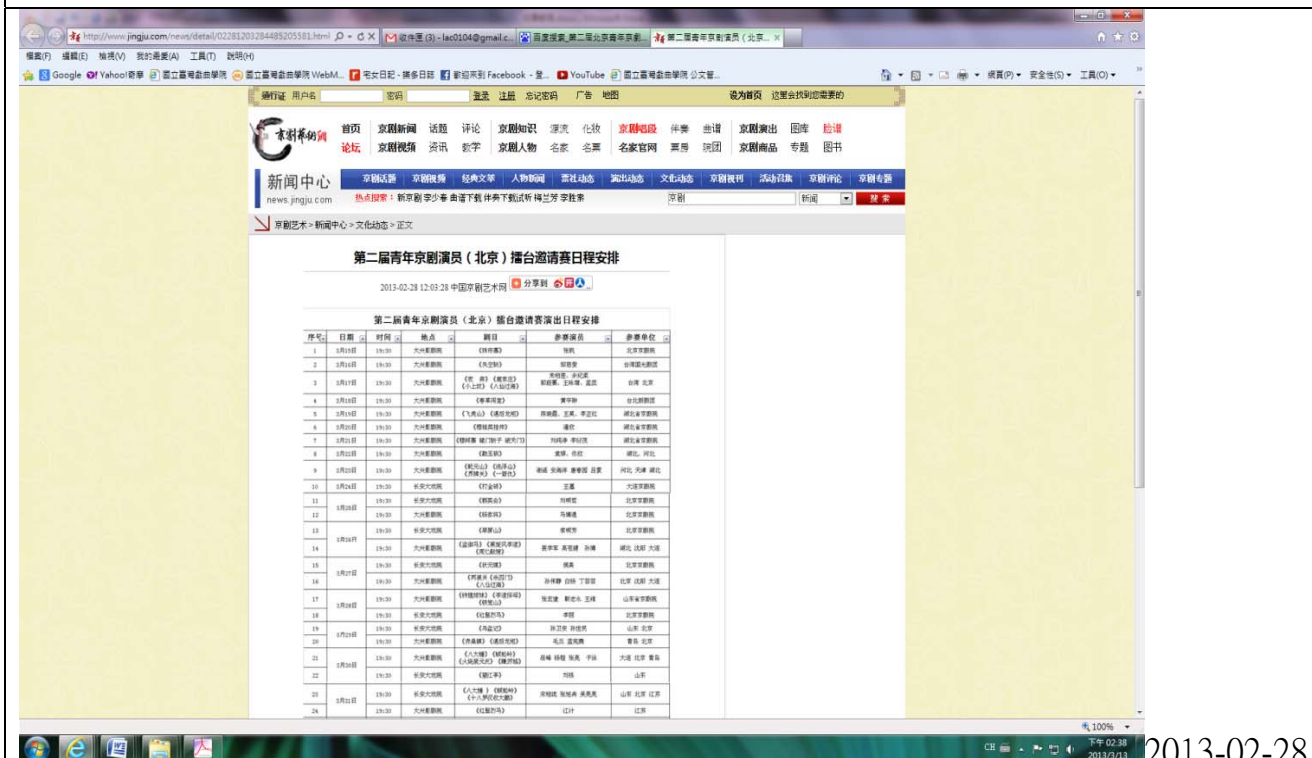
中國京劇藝術網<第二屆青年京劇演員擂台邀請賽日程安排>