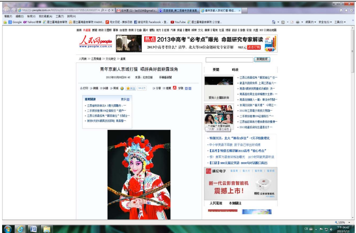
2013-03-08 人民網<青年京劇人京城打擂 唱經典好戲嶄露頭角>