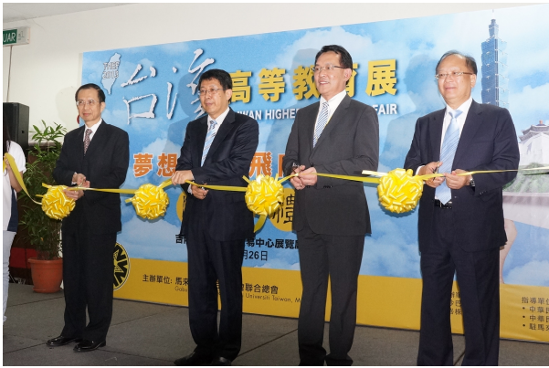
7/26 教育部長蔣偉寧、留臺聯總李子松會長、僑務委員會吳英毅委員長與駐馬來西亞臺北經濟文化辦事處羅由中代表開幕典禮剪綵