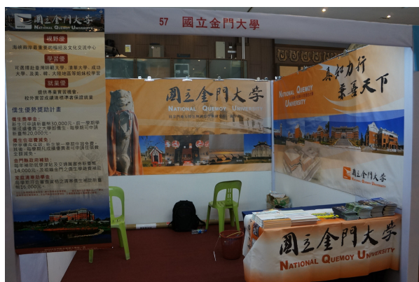
7/22 峇株巴轄海景宴賓樓展覽廳展場佈置情形