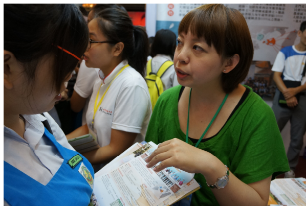
7/24 峇株巴轄海景宴賓樓展覽廳展出情形