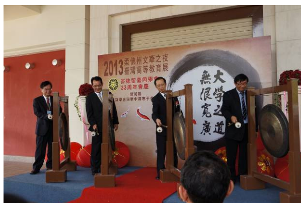
7/23 臺灣高等教育展峇株巴轄場開幕儀式