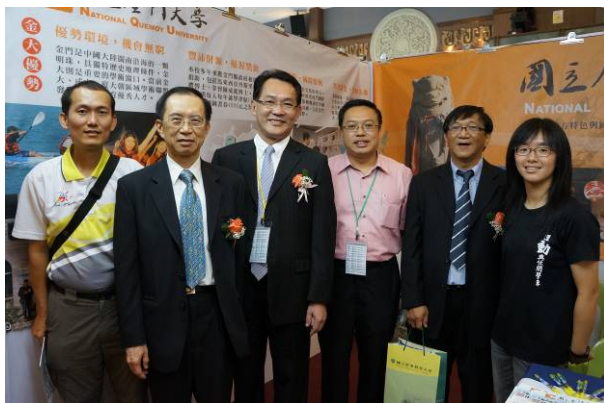
7/23 留臺聯總與峇株留臺同學會會長至各校巡禮