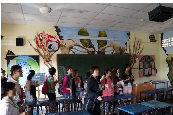
7/22 參訪華仁獨立中學—教室特色佈置參觀