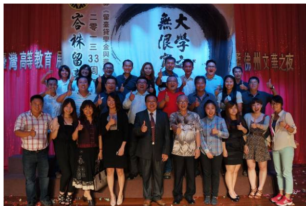
7/24 柔聯文華之夜—與金同廈會館相見歡