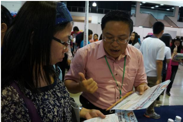
7/26 吉隆坡太子世界貿易中心展出情形