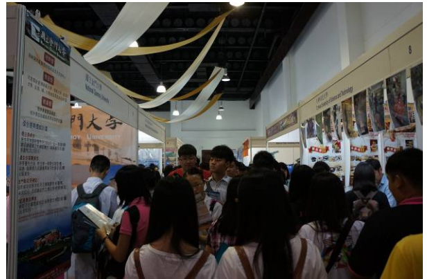
7/27 吉隆坡太子世界貿易中心展出情形