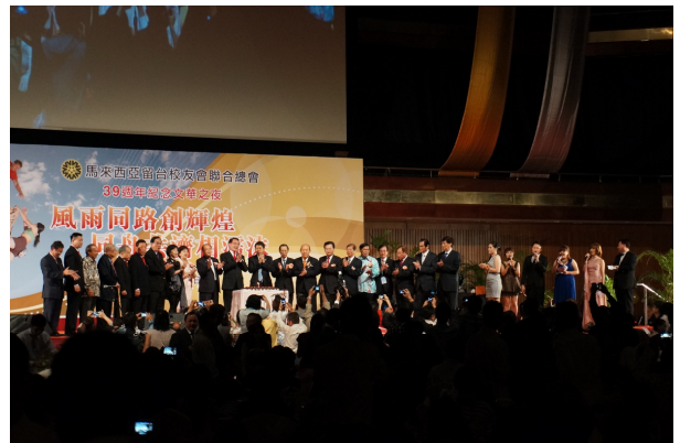
7/27 留臺聯總 39 週年文華之夜晚宴