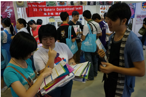
7/27 吉隆坡太子世界貿易中心展出情形