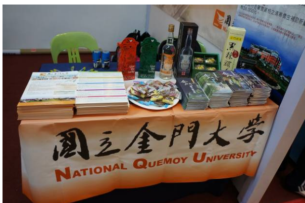
7/22 峇株巴轄海景宴賓樓展覽廳展場佈置情形