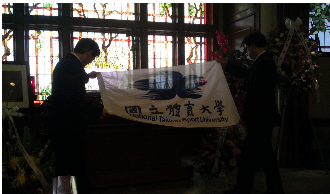
(高校長與袁教授 覆蓋體育大學校旗)