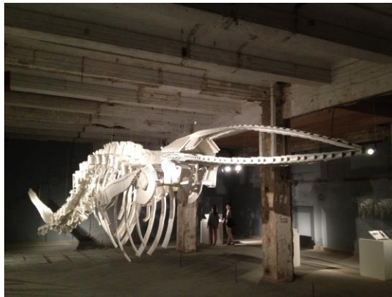
圖三：城市館展場之作品，與舊建築內形成展示張力。

虎丘路、圓明園路一帶，名為「外灘源」，為上海十里洋場繁華之興起地區，聚集多個商場大樓與新藝術風格飯店等歷史建築。城市館即利用這些因上海世博會初步修復外觀的建築物，進駐各地、各城市之不同策展團隊，以非代表的形式，形成另一個重要亮點。由於各館內的建築型態不一，設備狀態更不相同，與原有之私人美術館如上海外灘美術館等建築（亞洲文會大樓之博物館）形成一參觀連帶，反而提供了策展人執行其現地裝置、跨域創作的可能性，應為本屆雙年展喧賓奪主之意外效果，部分展館令人驚艷。