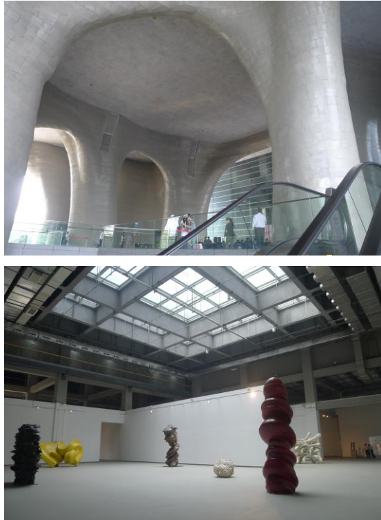
圖五、六：喜瑪拉雅美術館及其館內展場實況。

在考察上述雙年展與美術館機構之後，筆者亦赴上海市圖書館、上海市檔案館，及其週邊地區的美術館與畫廊，與中國第二歷史檔案館、中山陵等單位，同時考察南京一地藝術機構，但時間有限，故以蒐集相關研究教學材料為主。