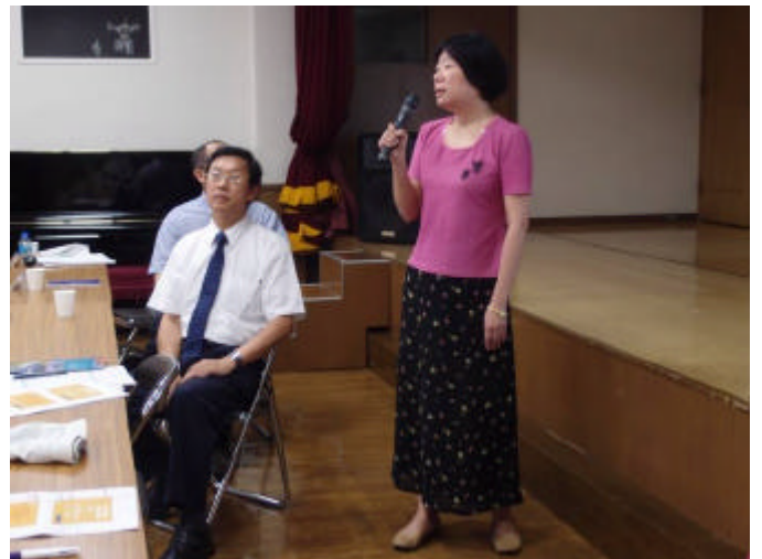
說明僑生資格與各項僑生輔導措施