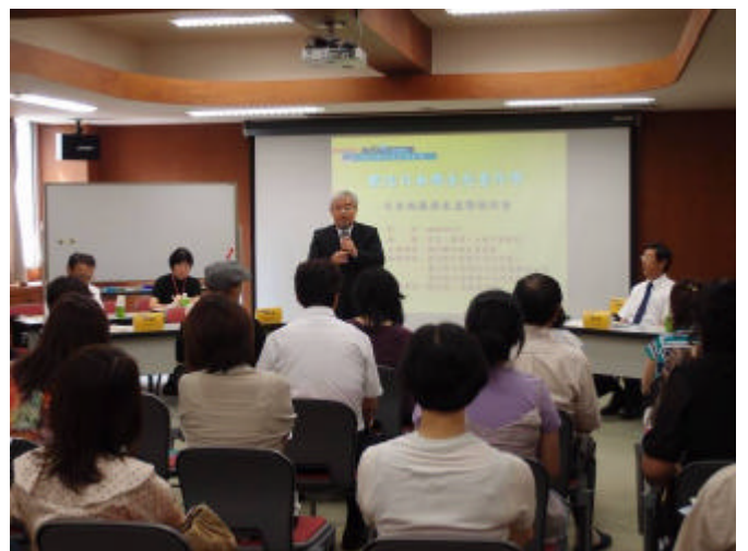
許主任委員和鈞簡報僑生赴臺升學資訊