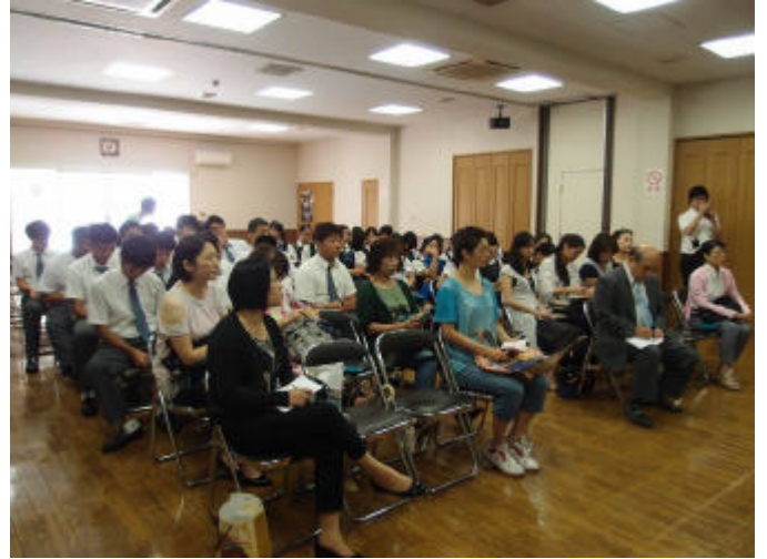
橫濱僑校招生宣導說明會