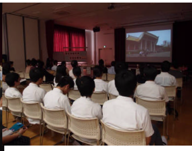
大阪中華僑校同學們觀看海外聯招會宣導短片