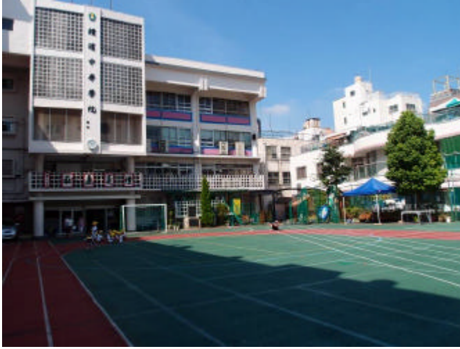
橫濱中華學院校園風景