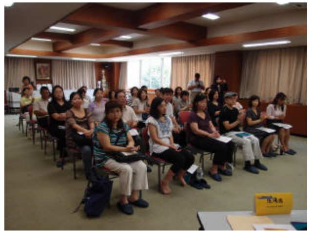
東京僑校招生宣導說明會