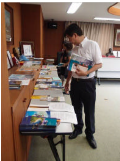
東京中華學校展示招生文宣品，供家 長索取參考