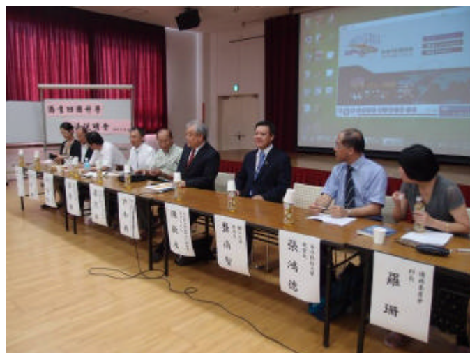
宣導團為與會家長、學生說明僑生赴臺升學各項資訊