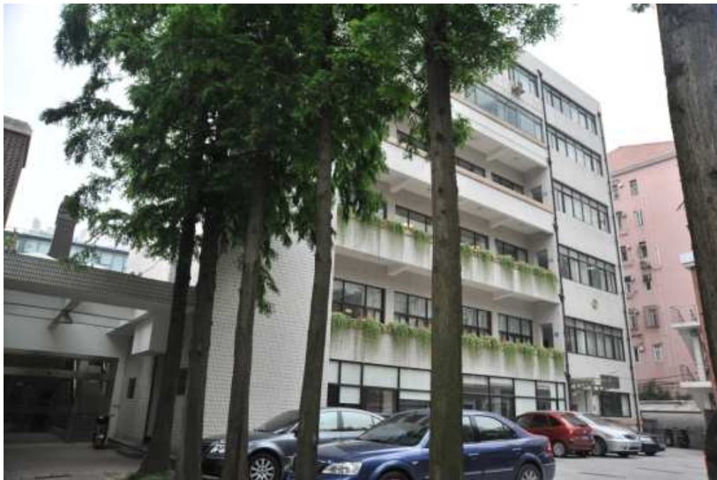
上海市教育委員會教學研究室建築外觀