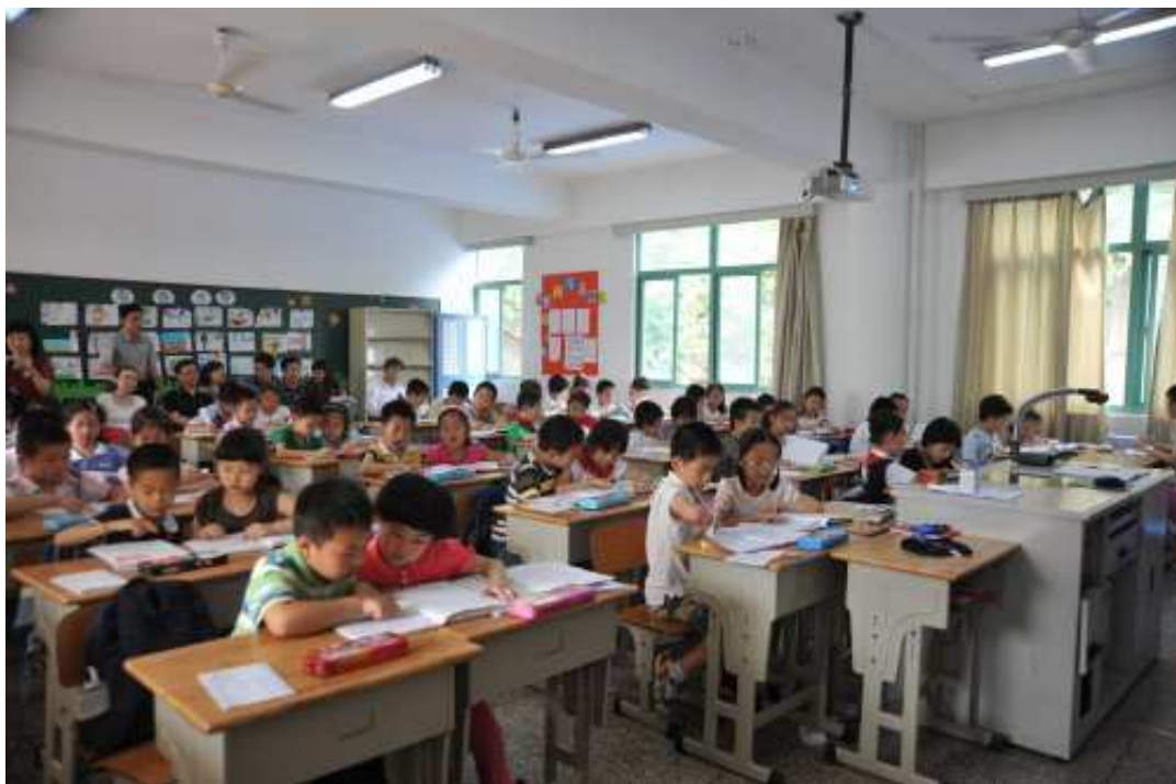
入班觀察南京師範大學附屬小學特級教師周衛東副校長進行教學演示（二）