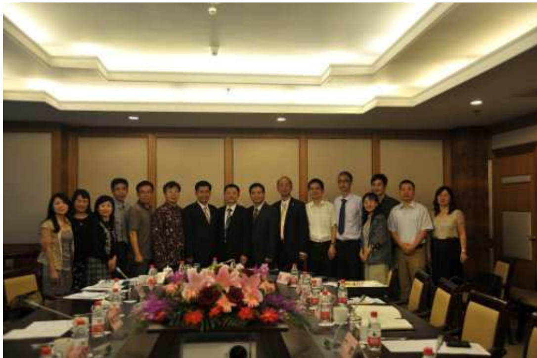
國家教育研究院與上海華東師範大學雙方代表座談後合影留念