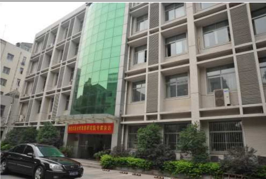
南京市小學教師培訓中心大樓