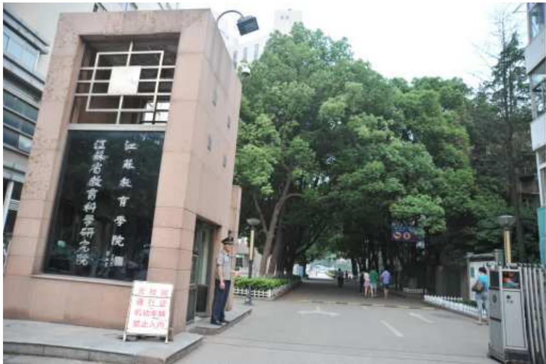
江蘇省教育科學研究院與江蘇教育學院二者緊密結合