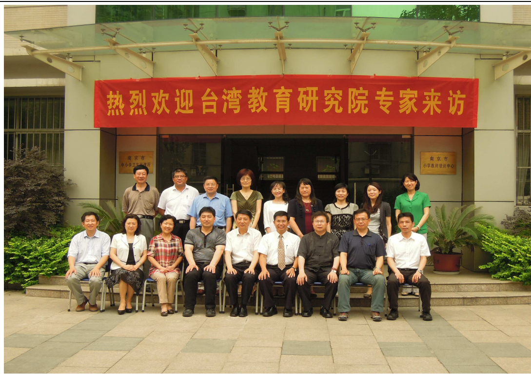
南京市小學教師培訓中心參訪會議會後合影