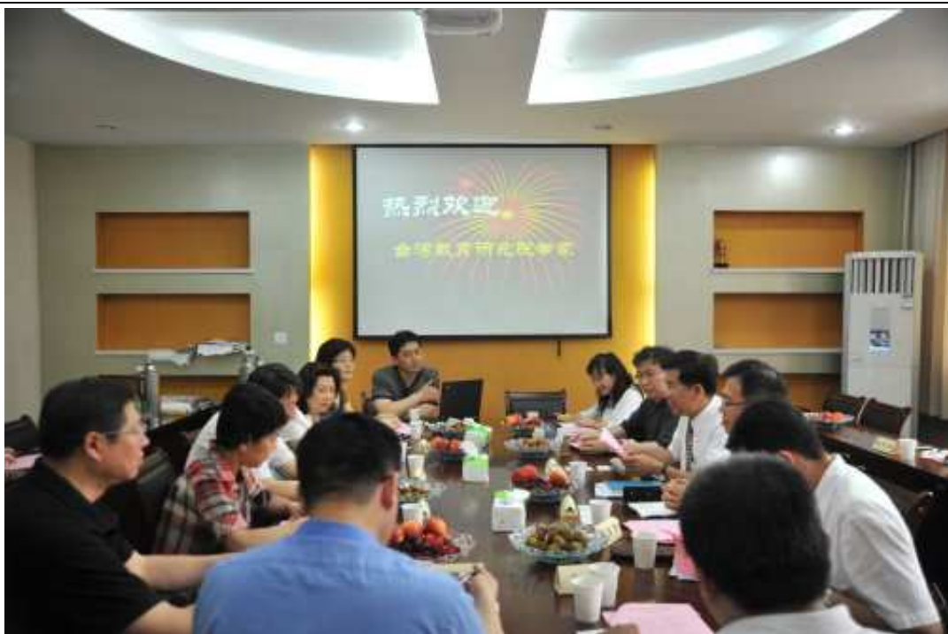
南京市小學教師培訓中心參訪會議會場活動情形（一）