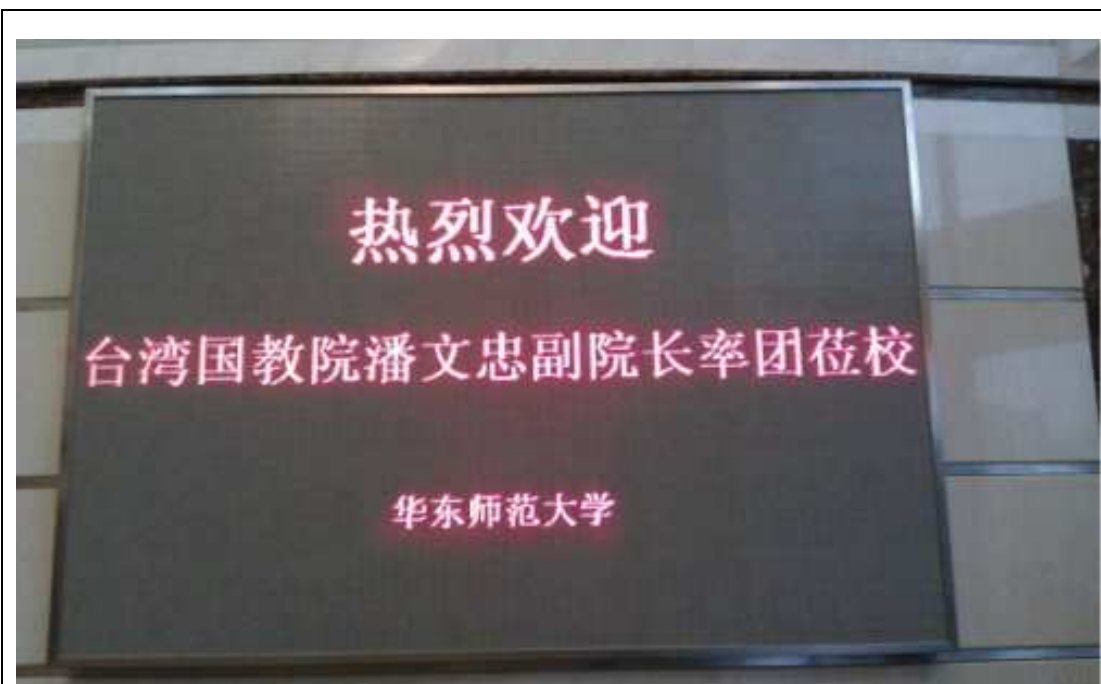
中學校長培訓中心（逸夫樓）電子看板歡迎國家教育研究院潘副院長率團到訪