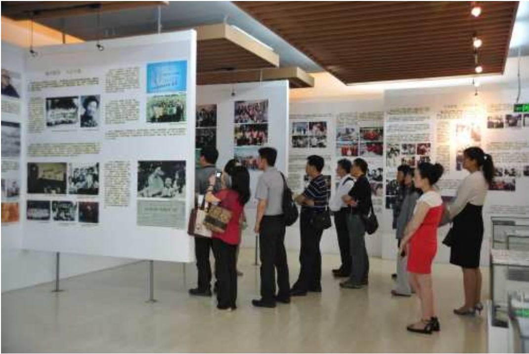
參觀南京師範大學附屬小學斯霞紀念館，介紹人民教育家斯霞老師偉大生平