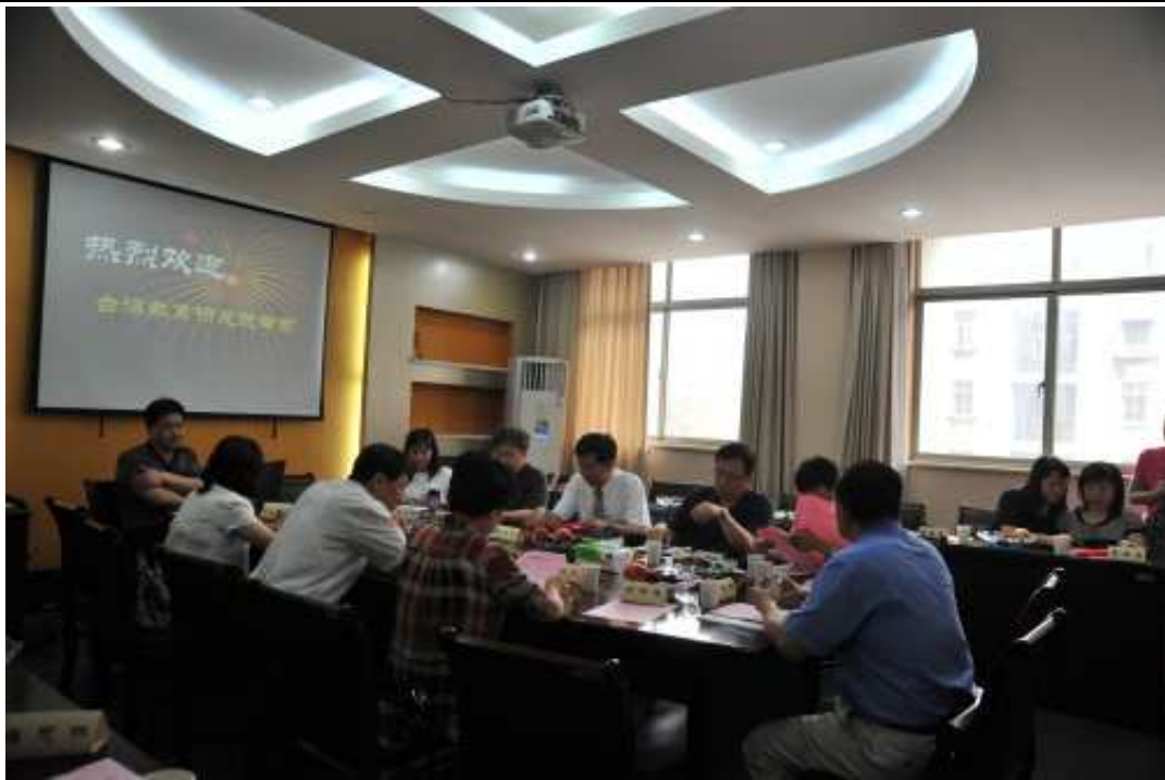
南京市小學教師培訓中心參訪會議會場活動情形（二）