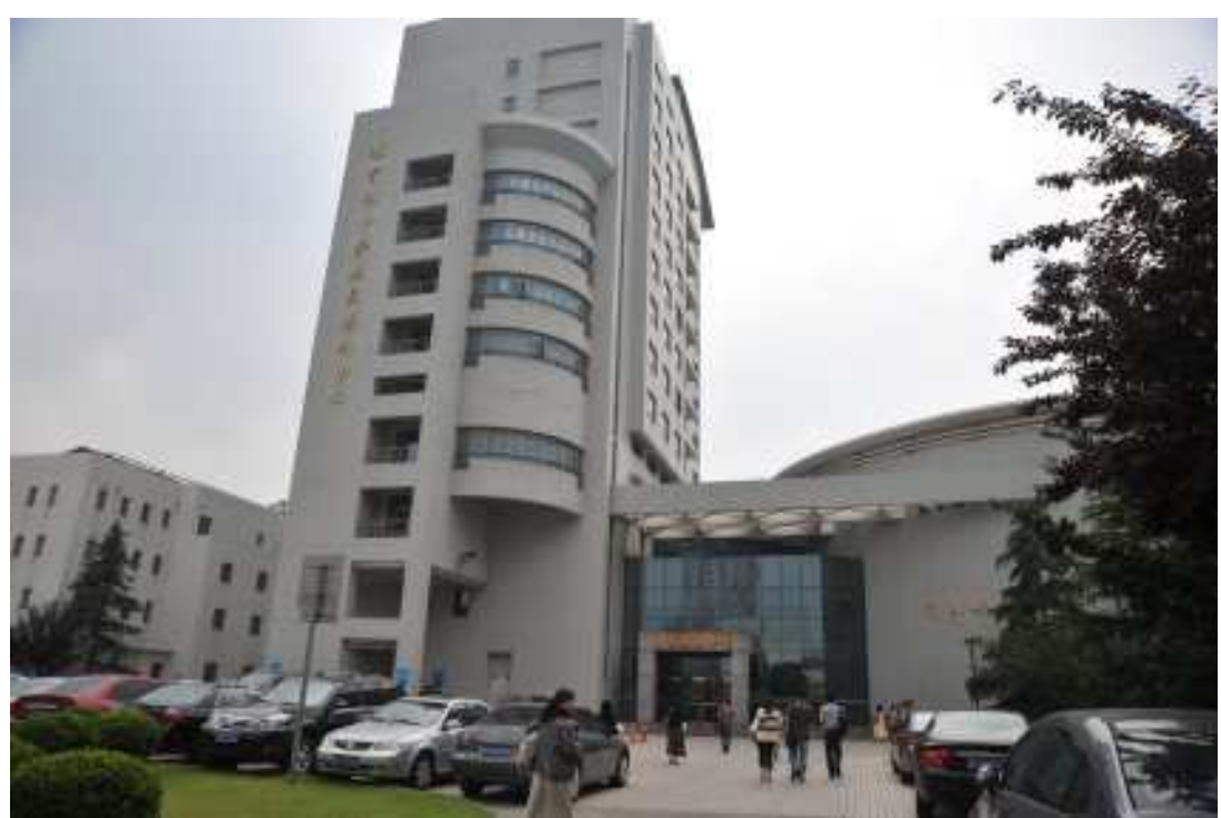
大陸教育部中學校長培訓中心外觀,位於上海市華東師範大學內