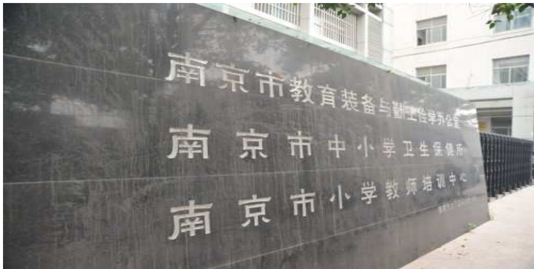
南京市小學教師培訓中心入口