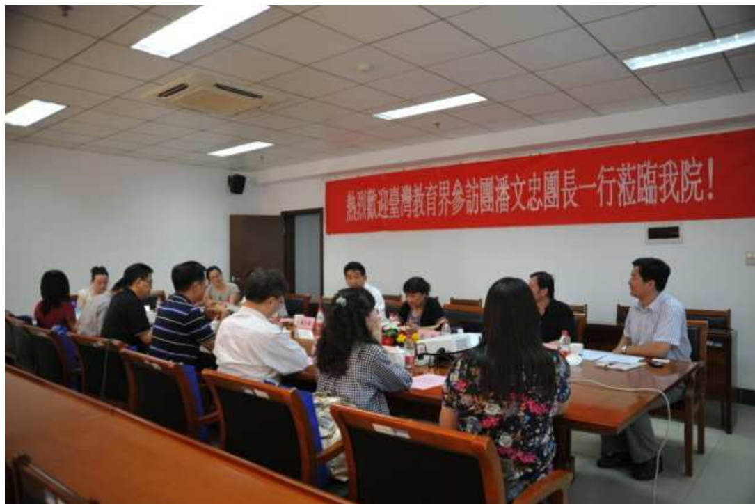
本計畫參訪人員與江蘇省教科院楊九俊副院長等人交流座談