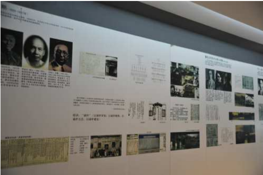
參觀南京師範大學附屬小學校史館，了解學校發展脈絡與沿革