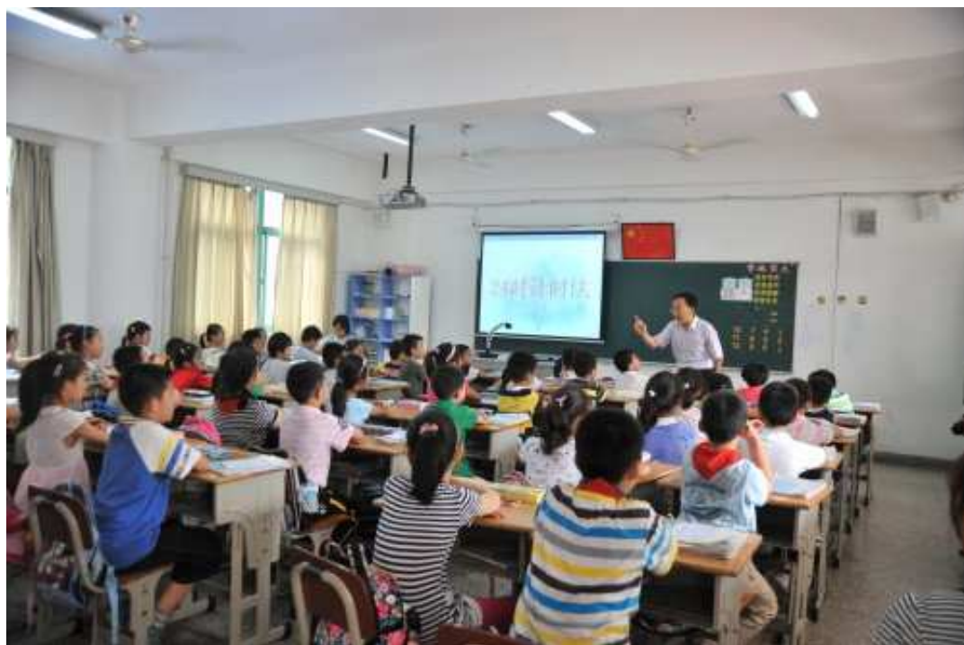
入班觀察南京師範大學附屬小學特級教師周衛東副校長進行教學演示（一）