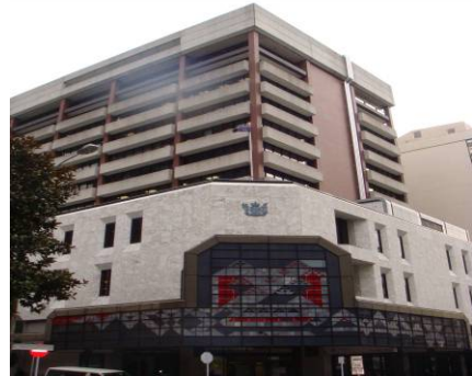
奧克蘭地方法院大樓

位在紐西蘭最大城奧克蘭市中心區 Albert Street. 上，該院歷史悠久，於 1840 年或 1841 年時即存在，目前的建物係在 1987 年開始使用。管轄區域即奧克蘭市地區，目前共有民事法庭(含 Disputes Tribunal and Tenancy Tribunal 二種特別法庭)、刑事法庭(包括 summary 及 jury)，及家事法庭(The Family Court)