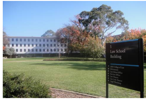
澳洲國立大學法學院大樓

邦國會立法設立的國立大學（校名：National），不同於其它澳洲公立大學皆是由各地州議會立法設立。