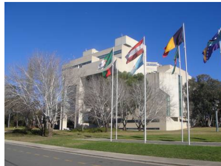
由格里芬湖畔遠眺澳洲高等法院