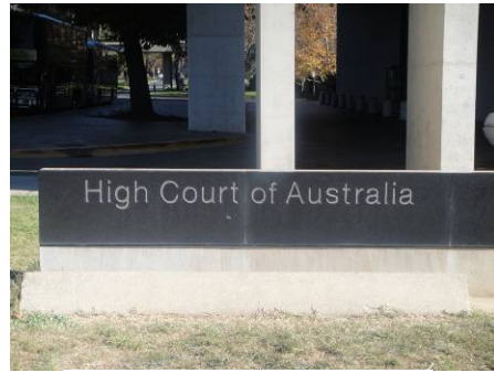
澳洲高等法院一隅

由於該院係屬國家級建築物，故一般民眾均可自由入內參觀，本日下午即見許多當地學生前來參訪，院內亦配有解說志工，溫文儒雅，令人印象深刻。凡此種種，均足為我國法院借鏡參考。