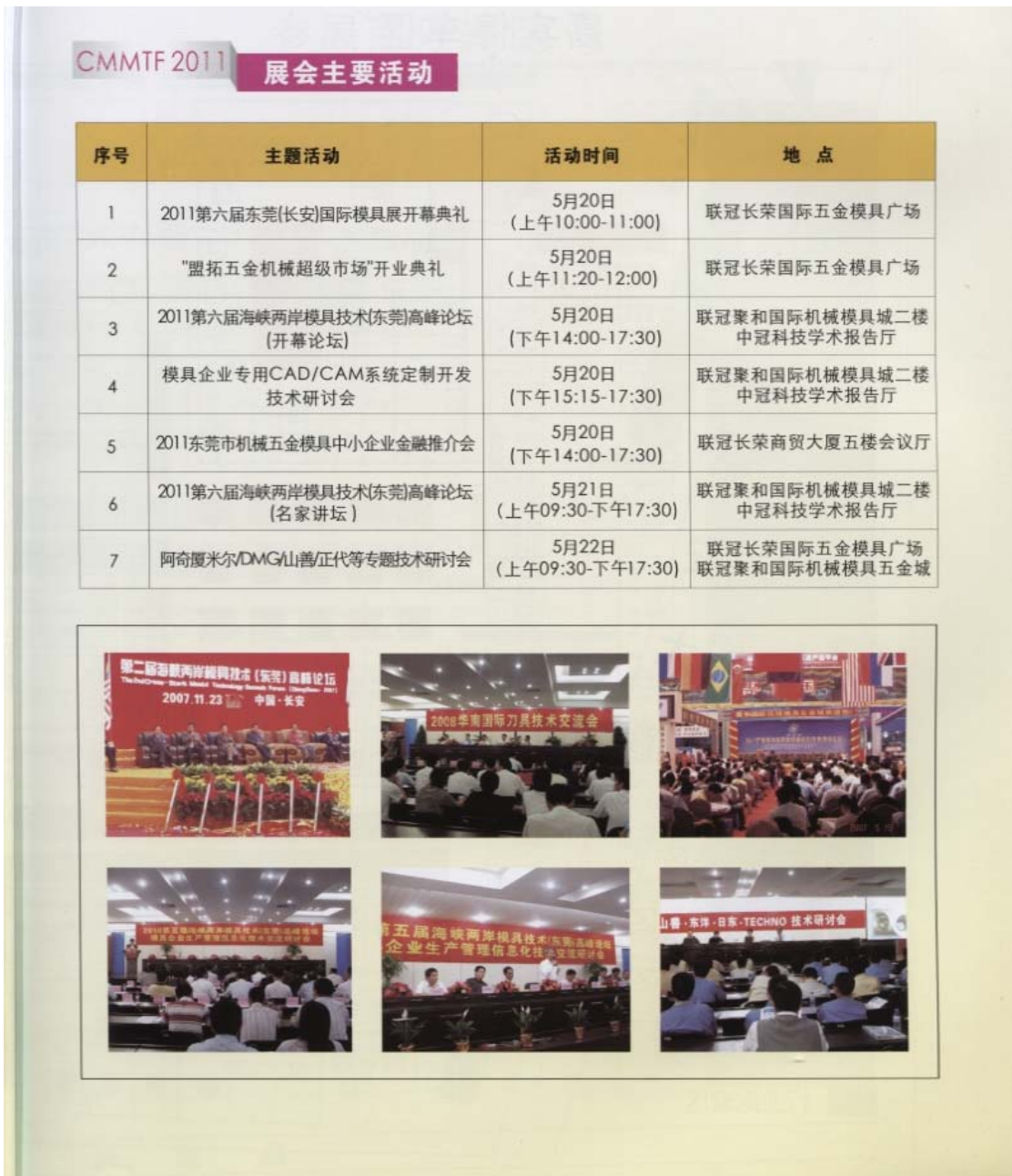
圖 4 第六屆兩岸模具技術高峰論壇之技術及設備展覽會主要活動