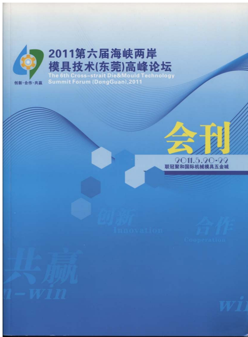
圖 1 第六屆兩岸模具技術高峰論壇會刊

早上集合於【小港國際機場澳門航空公司櫃檯】，搭乘【澳門航空公司】噴射客機飛往【澳門】。隨後，前往兩岸模具技術高峰論壇會場，高雄應用科技大學模具系有多位老師在場做學術論文報告。大陸的模具專家，對他們非常尊敬。會後，專車接往長安【五星級海悅花園酒店】辦理入住手續。