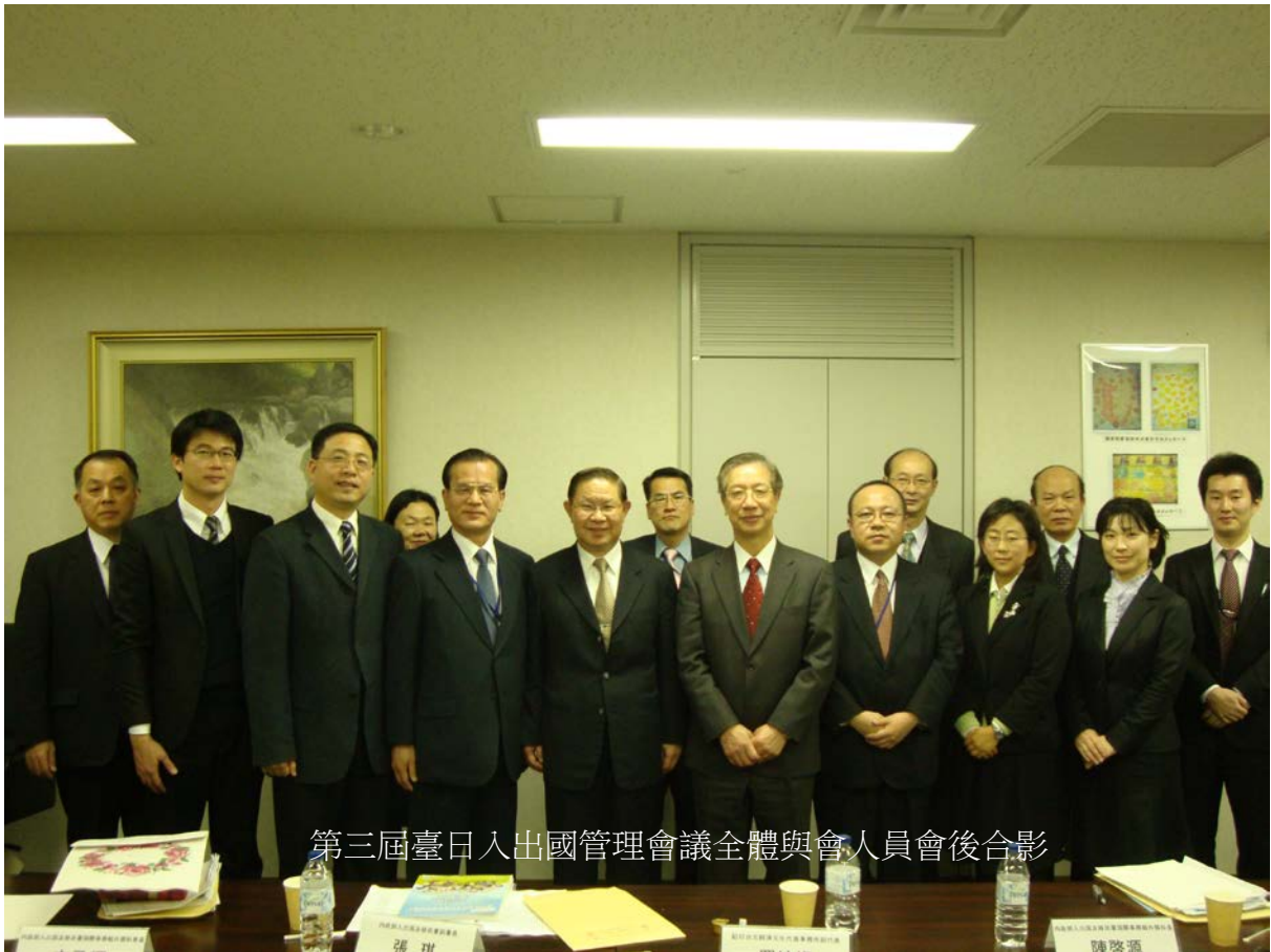
第三屆臺日入出國管理會議全體與會人員會後合影