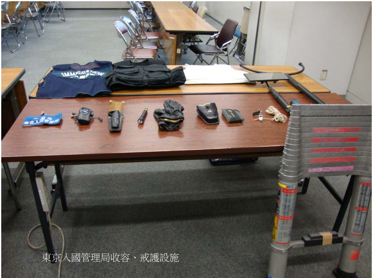
東京入國管理局收容、戒護設施