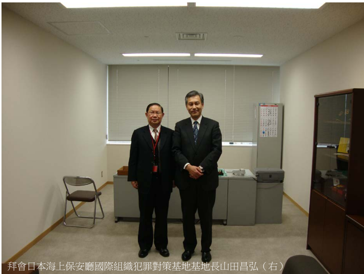
拜會日本海上保安廳國際組織犯罪對策基地基地長山田昌弘（右）