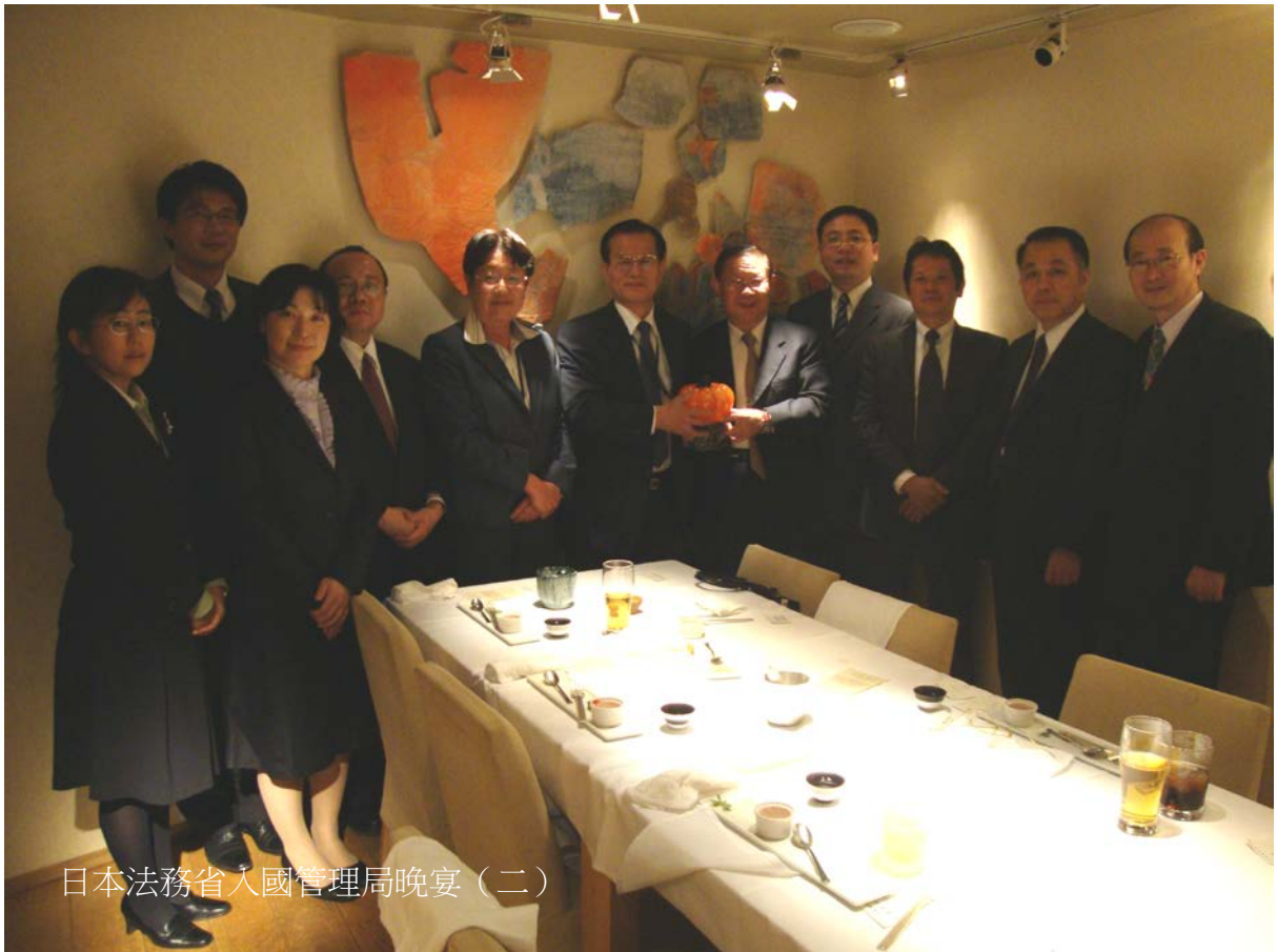
日本法務省入國管理局晚宴（二）