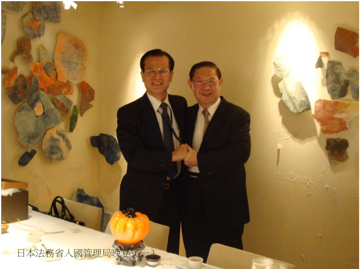
日本法務省入國管理局晚宴（一）