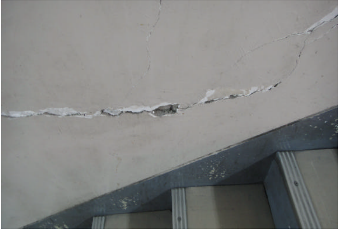
樓梯牆壁龜裂情況