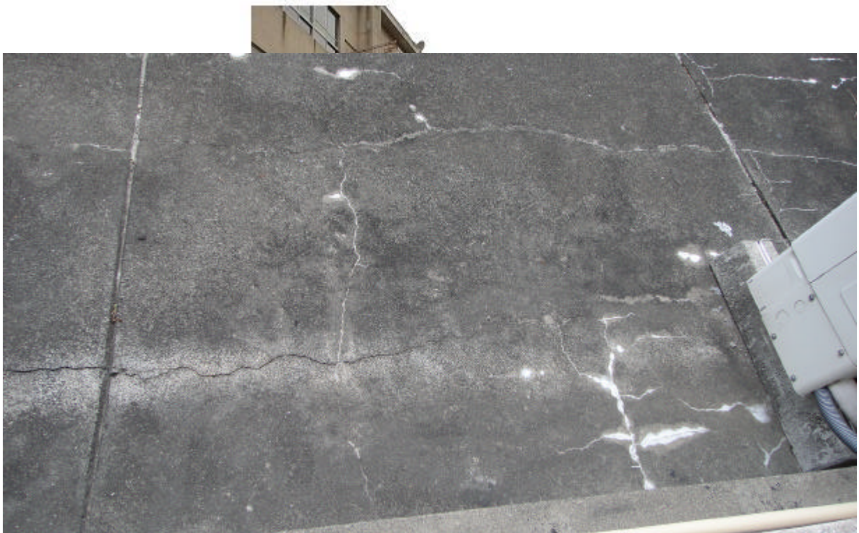
水管堵塞致地面積水