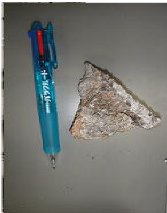
掉落之水泥磚約 10 公分