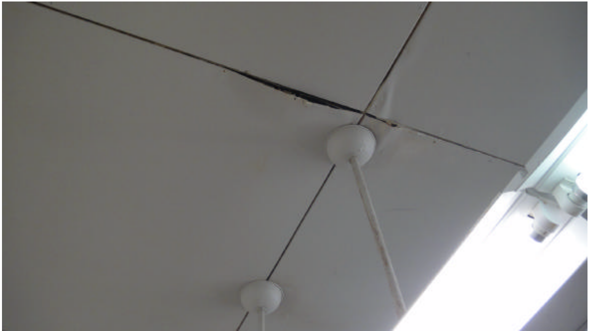
天花板龜裂，隨時有掉落危機