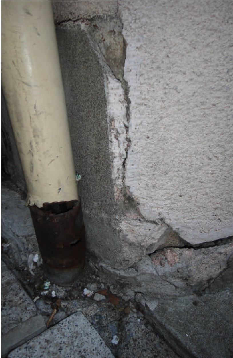
牆壁龜裂及水管破裂情形