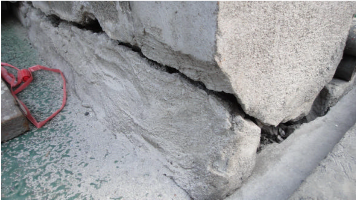
牆壁與地面龜裂情況