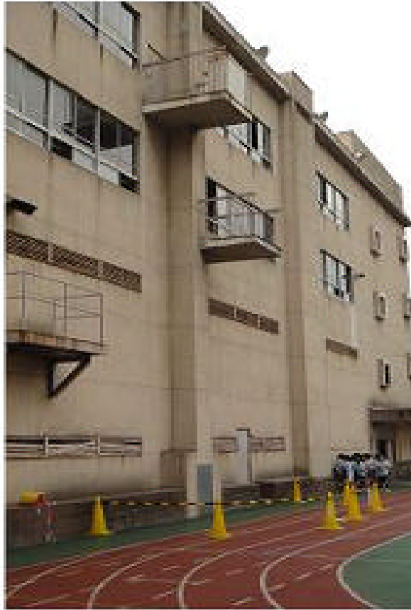
因受餘震影響，教室外牆時有水泥磚掉落