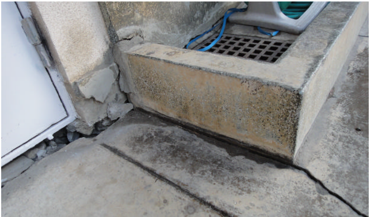
門柱及設備與地面龜裂情形