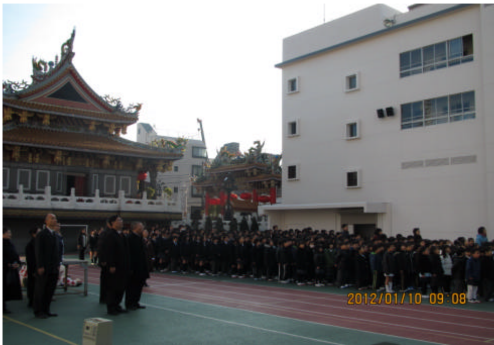
橫濱中華學院參加開學典禮