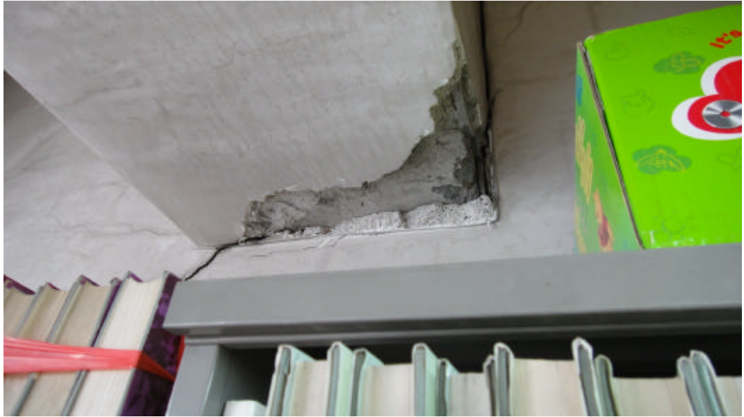
圖書館樑柱部分外觀已被震落