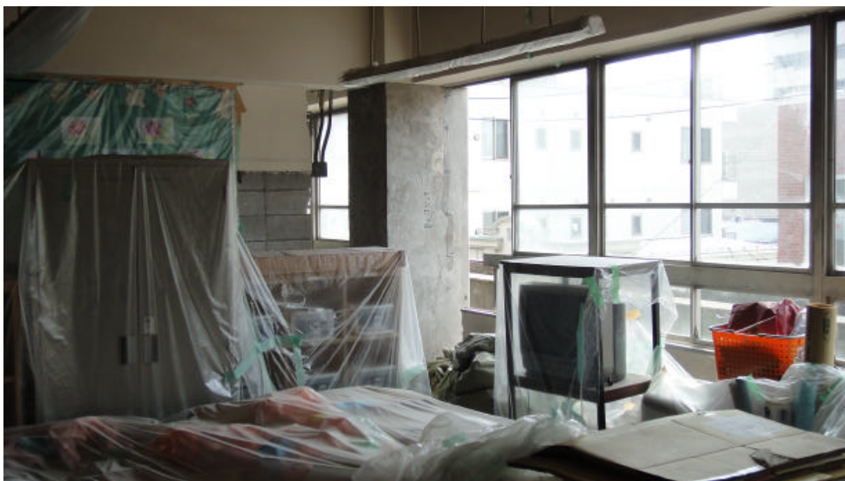
補強工程施工情形