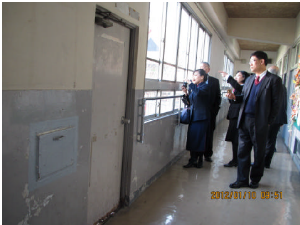
視察僑校受損及補強情況