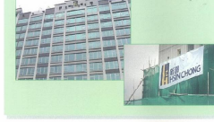
香港綠色企業大獎 Hong Kong Green Awards 2011

新昌營造廠非常榮幸獲頒「香港綠色企業大獎2010」中獲頒頒發的獎項。這不僅是新昌全體員工共同努力的成果，也是我們一直以來對環保、能源及社會責任的承諾。我們會繼續以可持續的方式發展業務，鼓勵業界對辦公室環境的關注，為綠色香港作出貢獻。