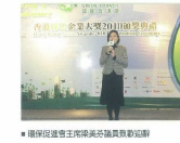
■ 環保局副局長梁潔瑩女士致辭