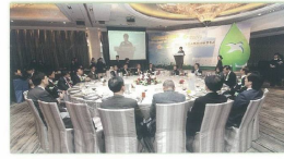
■ 香港綠色企業大獎2010頒獎典禮在香港英皇酒店舉行，超過500位嘉賓蒞臨出席