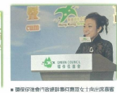
■ 環保局副局長梁潔瑩女士致辭