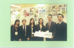
香港綠色企業大獎 Hong Kong Green Awards 2011

壹清潔環境榮獲由環保委員會頒發的「香港綠色企業大獎2010」中獲頒頒發的獎項。這不僅是壹清潔環境全體員工共同努力的成果，也是我們一直以來對環保、能源及社會責任的承諾。我們會繼續以可持續的方式發展業務，鼓勵業界對辦公室環境的關注，為綠色香港作出貢獻。