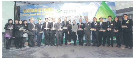
■ 頒發香港綠色企業大獎2010得獎者