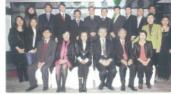
■ 一眾出席香港綠色企業大獎2010頒獎典禮的嘉賓

「香港綠色企業大獎」於2010年首次舉辦，入選分為兩部份「明智環保採購獎」Green Purchasing Award (GPA)及「環保辦公室管理獎」Green Office Management Award (GOMA)。「明智環保採購獎」是首本港環保採購獎，並表揚於環保採購表現出色的企業；「環保辦公室管理獎」則讚揚企業在辦公室環保管理方面的卓越成就。去年參加反應熱烈，當中有超過60家企業及中小企業獲得表揚。香港綠色企業大獎2010頒獎典禮與香港英皇酒店舉行，超過500位嘉賓蒞臨出席。