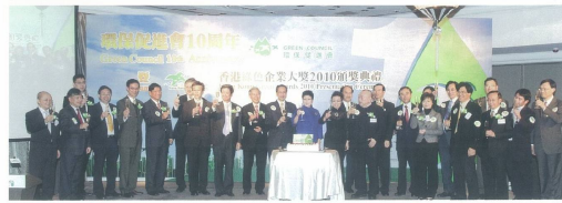
■ 香港綠色企業大獎2010頒獎典禮嘉賓及得獎者一齊合照