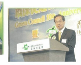
■ 環保局副局長梁潔瑩女士致辭