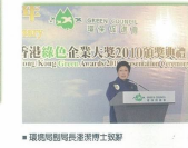
■ 環保局副局長梁潔瑩女士致辭