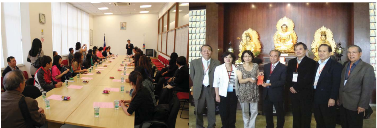
1 2 拜會客家大樓各單位：1. 客家大樓大門前合影 2. 拜會客屬崇正會團員簽名留念 3 4 3. 拜會聖保羅文教服務中心 4. 參觀佛光會