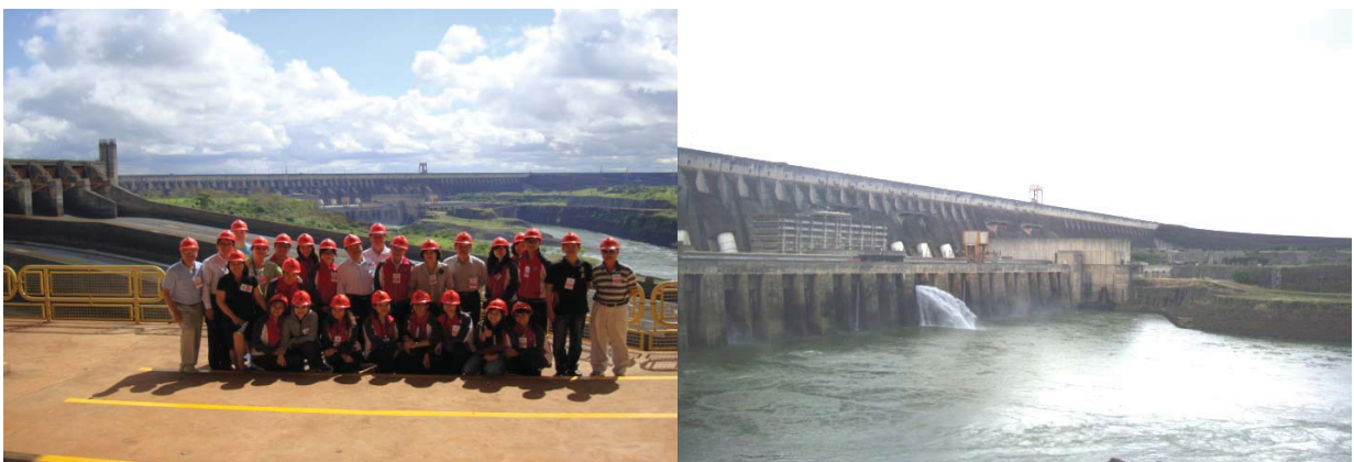
參觀 ITAIPu 水力發電廠