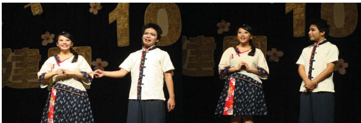
節目五：掌牛郎娶媳婦——《掌牛郎》《摘茶細妹》《天空落水》《廟口》 《迎親》舞蹈