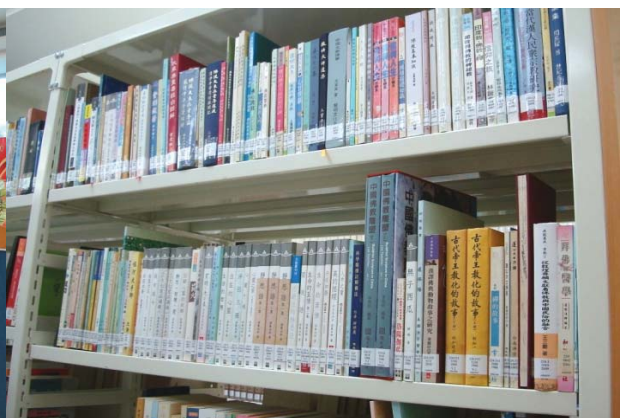
1. 僑委會捐贈數位學習示範中心 2. 替代役男教授小學生電腦課程 3. 參觀中巴文化中心附設之陳奉天紀念圖書館 4. 圖書館內中文藏書