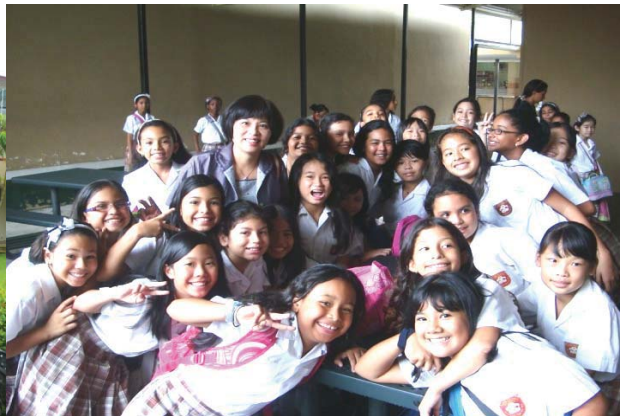
1, 2: 卡華耶魯校長陪同參觀中山學校 3. 在校園孫中山先生銅像前合影 4. 與活潑可愛的學生合影