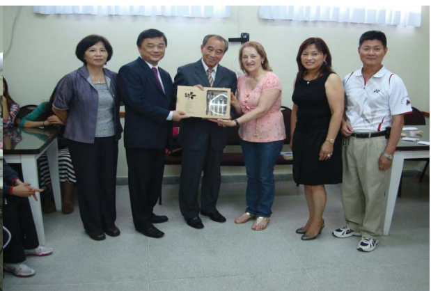
1. 洗衣班 2. 烘培班 3. 美髮班 4. 本會致贈職訓中心代理局長紀念品