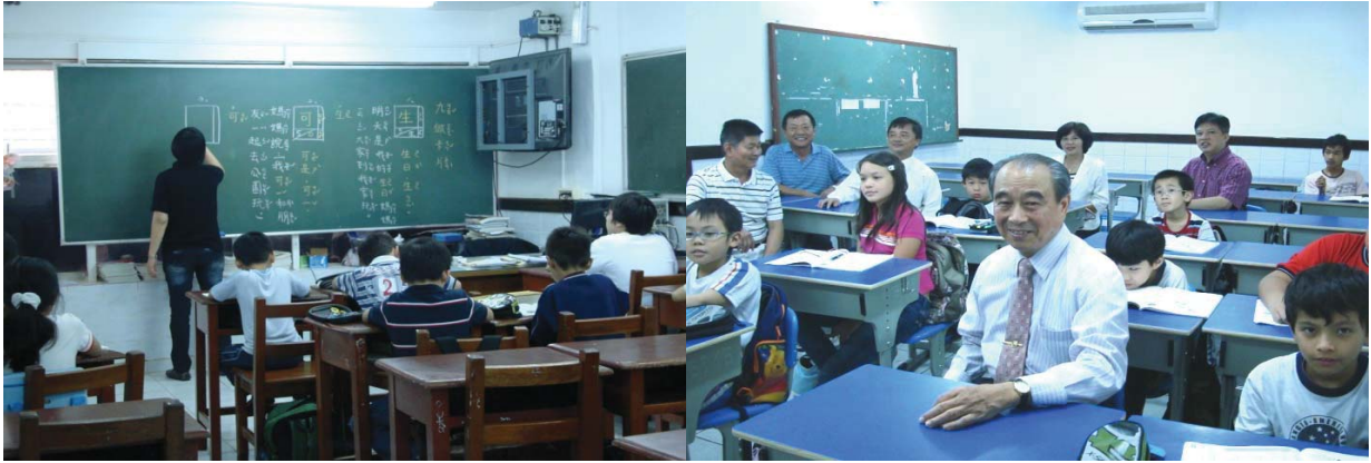
3. 團長致贈本會紀念品 4. 東方市政府前團員合影留念