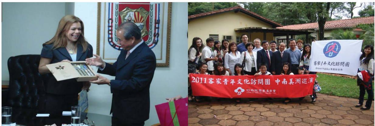
1. 拜會東方市市長 2. 團員合唱皇天不負苦心人