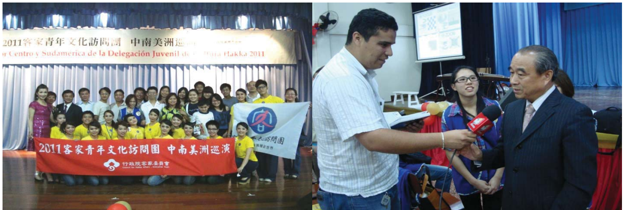
東方市 Colegio Inmaculada 高中演出現場來賓出席盛況