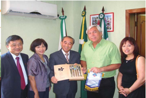
1. 出席客家鄉情座談 2. 鄉親熱烈發言 3. 拜會伊瓜蘇福斯市市長 4. 互相贈送紀念品