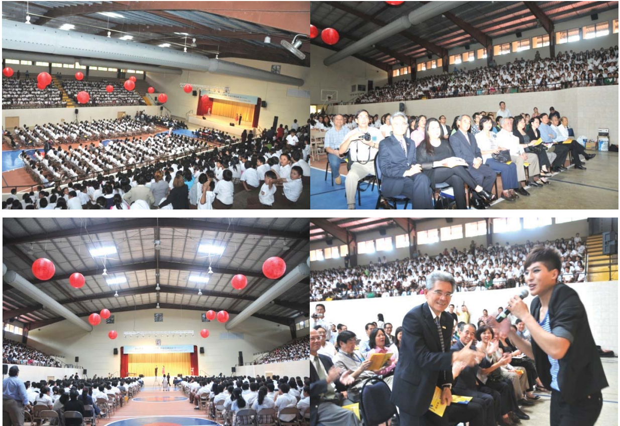
中巴學校體育館演出現場來賓出席盛況