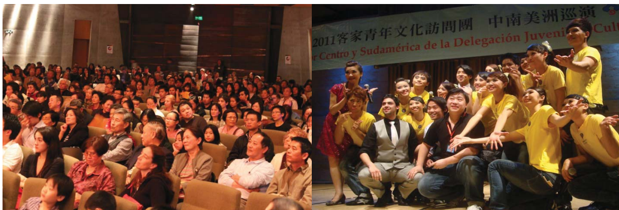
AMIJAI 劇場演出現場來賓出席狀況