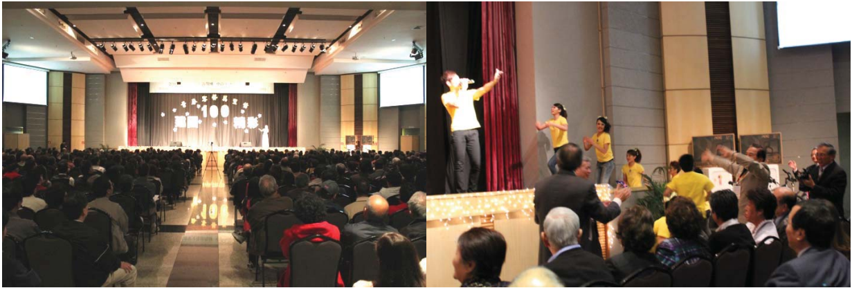
客家活動中心演出現場來賓出席狀況