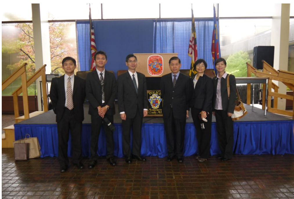
0923 蒙哥馬利郡警察局-合照 3