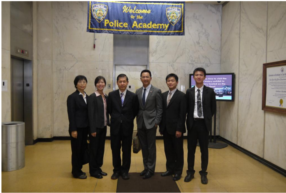
0926 紐約市警局-合照 1