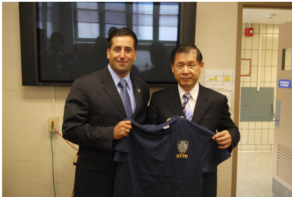
0926 紐約市警察局-合照 2