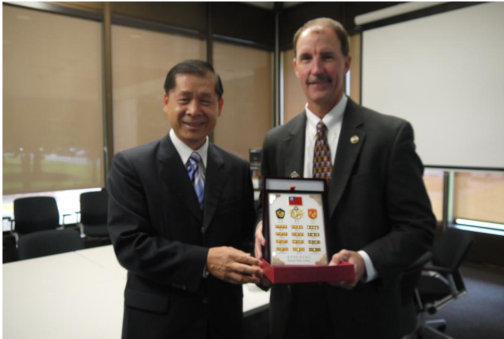
0922FBI 訓練中心副局長(致贈禮品)