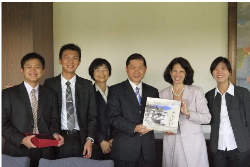
0920 姐妹校雪蘭多大學校長 Tracy Fitzsimmons(致贈禮品)