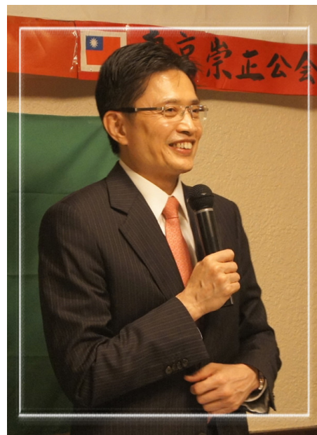
黃主委抱持著感恩的心，在交流餐會上與在場嘉賓分享經驗。

黃主委指出，行政院客委會正在推動客語能力認證獎學金制度，也確實成功引領客語學習風潮，國民中小學生通