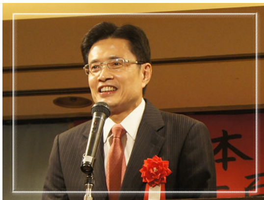
行政院客委會黃主委玉振感謝海外客僑的傳承客家精神，並分享推動客家事務心得。

黃主委以客家俗諺「好時好日多風雨」作為開場白，他表示原訂三月前來參加關西崇正會的懇親大會，卻因日本 311 震災而延後；終於等到與大家見面的這天，飛機卻罕見地因維修安檢而晚了一個小時抵達；到了大阪，原本萬里無雲的好天氣，卻突然下起傾盆大雨。黃主委笑說，或許這就是俗稱的「好事多磨」，也可以預見本次懇親大會必將圓滿成功。