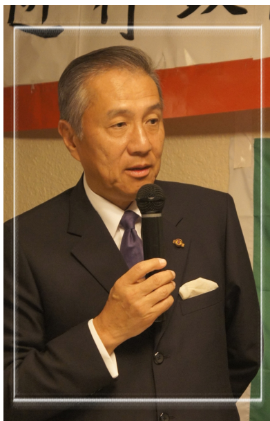
台北駐日經濟文化代表處馮大使 寄台得知黃主委將出席交流活 動，特別撥空參與。

最後，黃主委力邀鄉親參加 11 月將在台灣舉行的「全球客家懇親大會」，他表示，行政院客委會所編列的客家預算已激增 3 倍，不但舉辦各種研習培訓班、海外客家社團負責人諮詢會議，今年也首度籌組客家青訪團至中南美洲宣慰僑胞，更盼世界各地的客家鄉親能透過這些活動，聯繫情感，凝聚彼此向心力，在世界各角落展現客家力。