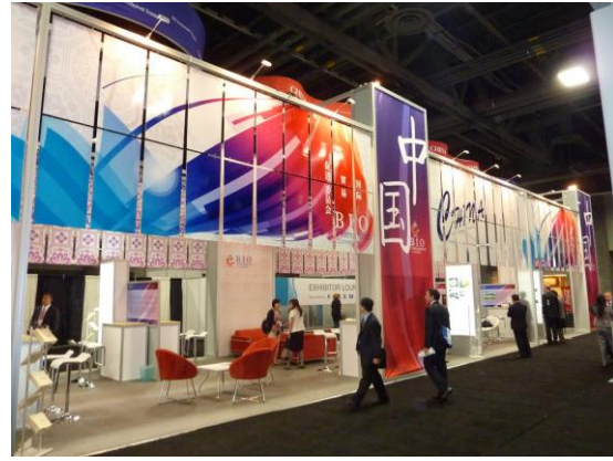
BIO 2011 生技展—中國展示攤位