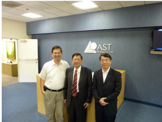
拜訪 AST Products 公司

表示目前該公司於波士頓的廠房面積約有 23,000 平方呎，廠房配置有 Class 10,000 及 Class 100,000 的無塵室，以及先進的分析及研究實驗室。該公司新近於新竹生醫園區投資設立之應用奈米醫材科技(股)公司，係以開發新一代預置人工水晶體植入系統(preloaded IOL delivery system)為主，該產品訴求安全容易使用，可提升醫生手術醫療效率與品質。