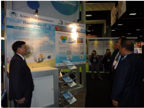
國科會新竹生醫園區攤位