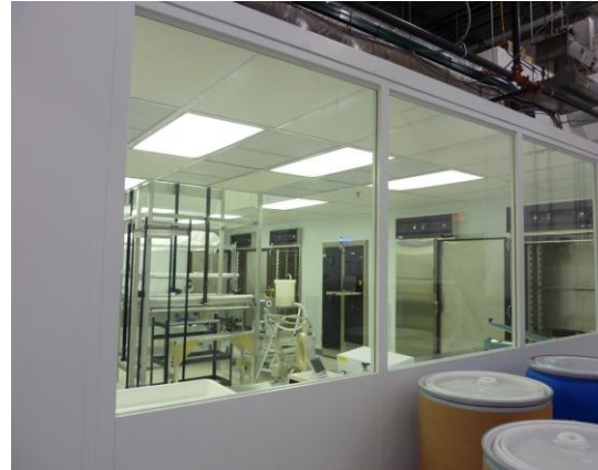
AST Products, Inc. 廠房

於參觀完該公司無塵室及研究實驗室後，顏局長表示目前美國、歐洲、日本及印度均有人工水晶體的生產技術，我國卻尚未有人工水晶體的生產技術。以國內優異的隱形眼鏡鏡片製造技術、模具開發及射出成型技術，加上該公司引進之人工水晶體生產技術，不但可突破國內人工水晶體製造技術，生產台灣製的人工水晶體，並且可降低高品質人工水晶體的價格，降低國內白內障手術施行價格。希冀該公司進駐生醫園區後，不僅引進人工水晶體生產技術，更藉此吸引相關廠商進駐園區，於園區中形成一個眼科相關醫療器材產業的創新聚落，厚植產業的營運及研發人才。