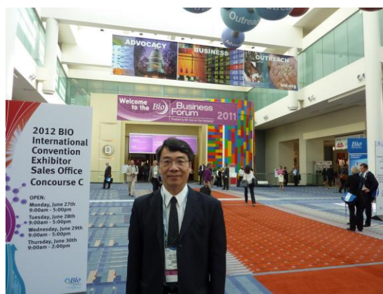
Bio Business Forum 入口

美國 Biotechnology Industry Organization (BIO) 成立於 1993 年，其主辦的生技展覽暨研討會為全球最大型之國際生技年會，今年邁入第十八屆，結合展覽、大型專題研討會、成果發表會及多場商機洽談會，是全球生技業者不可錯過的年度盛事。今年度 BIO 2011 生技展展場，除了公司及各國參展攤位外，展場依舊規劃有 Bio Business Forum，設計上朝向提供更多商談機會及空間的方式規劃。展場內除有大會提供的開放洽談區，放置有洽談桌數張，另規劃有多個會議室，可讓廠商與各國生技業者一對一洽談或進行商務交易等活動的封閉空間。在各公司及各國的展示攤位，今年度佈置上仍以形象展示為主，展場中明顯可見中國大陸館較往年又更大更宏偉，且在商談區懸掛著年底預計於中國大陸舉辦之生技展布條，顯示出中國大陸在生醫產業發展上的強烈企圖心。