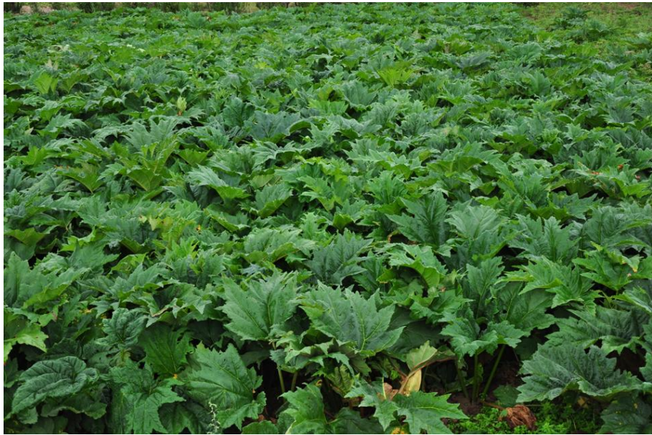
宕昌縣大黃栽培基地