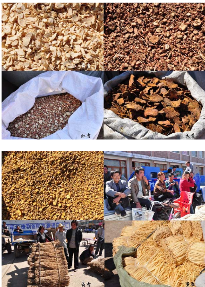
首陽藥市當地藥材

當地大多將原形藥材以切製成飲片，如黃耆、當歸、大黃、黨參、甘草等。店鋪販售形式為露天集市擺攤，無明顯告示牌標示藥材品名。