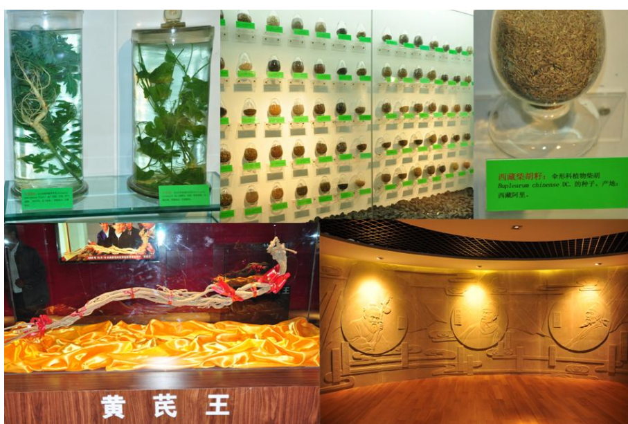
文峰藥材市場交易城展示館

參觀當天只見新興大樓，參觀交易城內的中藥展示館，分為當地中藥材、種子類藥材、浸液標本、藥材原植物圖片及藥材發展歷史等區。值得一提的是，在此收購到 42 種中藥材之種子，包括大黃、黃耆、當歸、知母等常見中藥材，能收集其種子，十分難得。