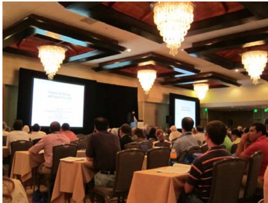
圖 2 大會演講