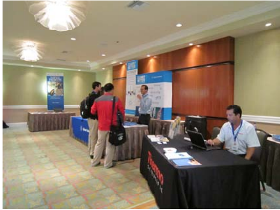
圖 4 廠商展覽室之一隅