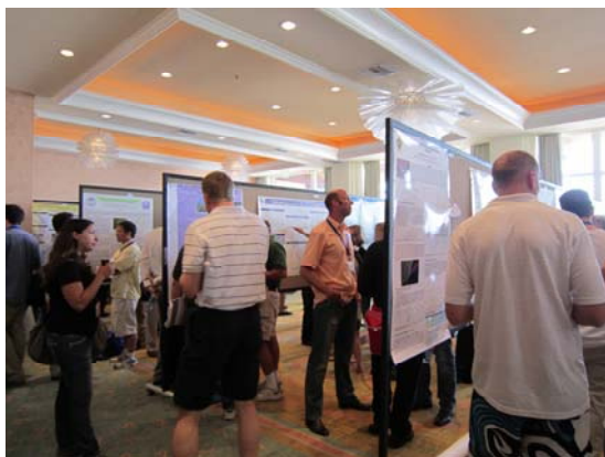
圖 6 壁報論文展示