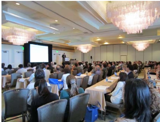
圖 5 分主題進行邀請演講及口頭報告