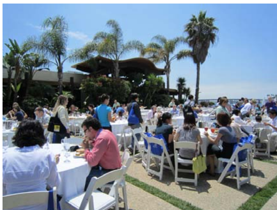
圖 3 中午至戶外用餐