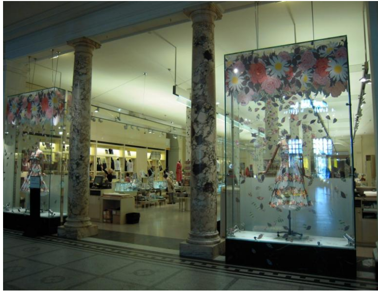
圖 13 英國倫敦 Victoria and Albert Museum 博物館賣店