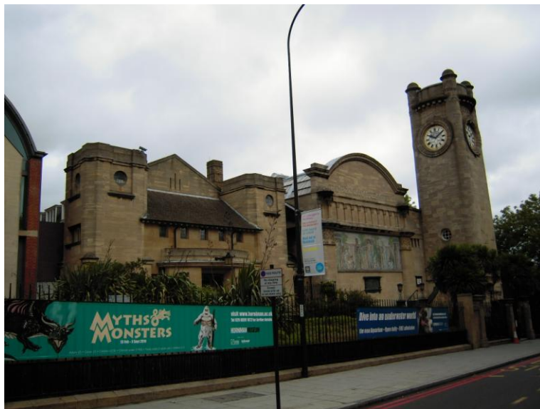
圖 1 英國倫敦 Horniman Museum