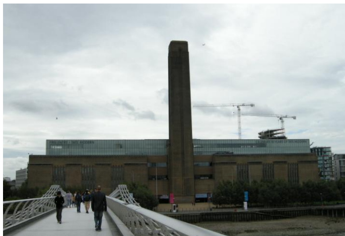
圖 11 英國倫敦 Tate Modern Museum