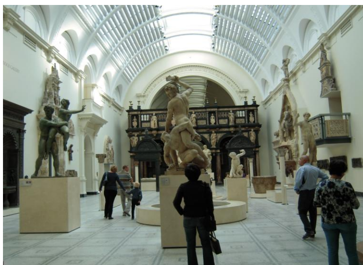
圖 12 英國倫敦 Victoria and Albert Museum 展場一景

B、特性：(1) 經由館藏公開，展示教育，提供時尚、休閒觀光、表演藝術或商業領域，作為創新設計靈感來源；(2) 結合其他文化部門，經由商品開發或授權，促進共存共榮，製造產值。