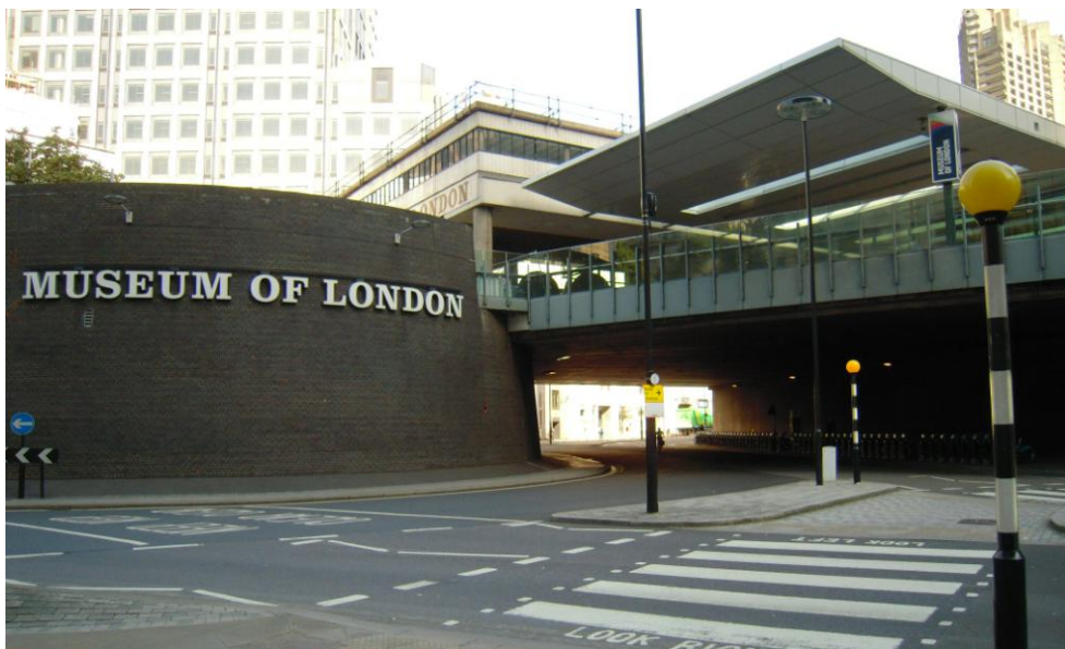
圖 8 英國倫敦之城市博物館 Museum of London

B、爲了詮釋溝通，展示手法有現址保存、造景、文字、器物和影像等。其中，影像資料並附有手法表達，兼顧身障者需求。