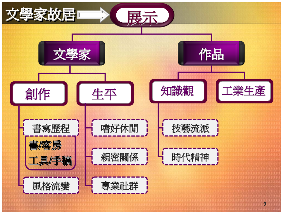
圖 10 Charles Dickson 博物館展示分析