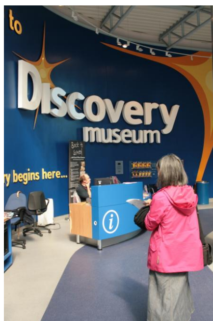
圖 7 英國新堡 Discovery Museum