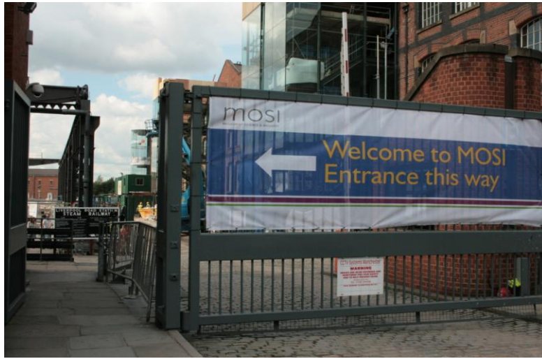
圖 4 英國曼徹斯特 Museum of Science and Industry (簡稱 MOSI)